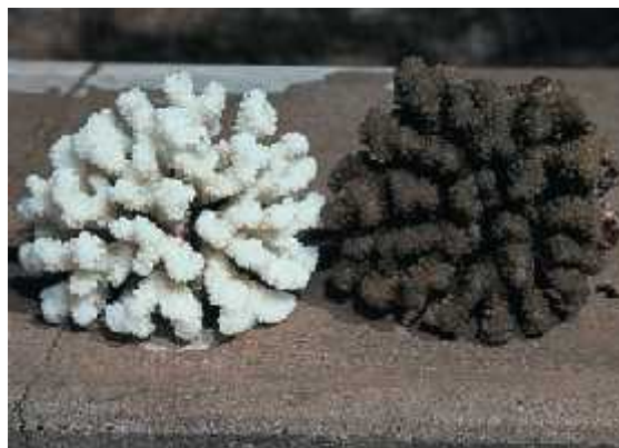
Slika 7. Prikaz vapnenačkog skeleta koralja na lijevoj strani te desno živi koralj (Castro)