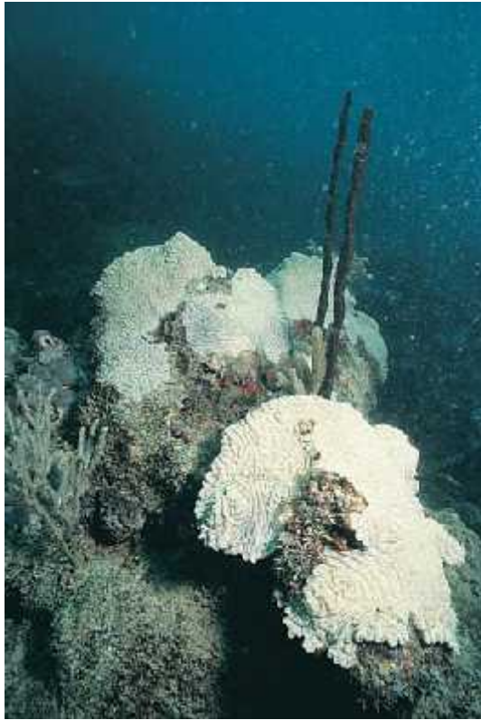
Slika 6. Izbjeljeni koralji zbog gubitka simbiotskih zooksantela (Castro)

samih koralja i pritom postaju vidljivi donji bijeli slojevi. Koralji mogu podnijeti smanjen salinitet sve do 23 nakon čega odumiru. Razne studije potvrđuju činjenicu da je izbjeljivanje koralja direktno povezano sa zatopljivanjem mora u kojima se nalaze s time da je dovoljan porast temperature od samo 1° C. Takvi izbjeljeni koralji ne rastu i podložni su raspadanju. Izbjeljeni koralji ne izgube sve svoje simbioante što je vrlo važna činjenica jer omogućuje oporavak koralja ukoliko se okolišne uvjerenice stabiliziraju.