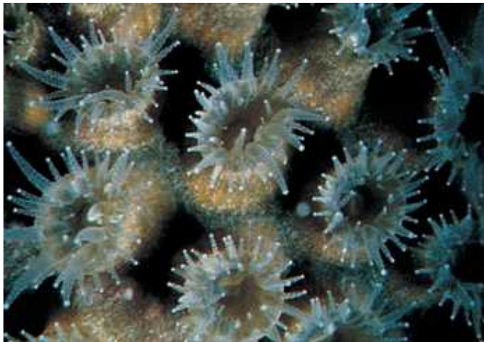
Slika 3. Polipi na koraljnom grebenu (Castro)

Koralji spadaju u skupinu žarnjaka, a postoji više vrsta koralja od kojih samo neki izgrađuju grebene. Žarnjaci imaju dvije generacije, sesilni polip i pokretnu meduzu. Kod koralja nalazimo samo polip. Polip koji ima skelet od vapnenca može izgraditi grebene. Grebeni su milijarde tih malih polipa i umrlih polipa koji su vapnenački skeletni podlogu za žive polipe. Te koralje često nazivamo "kamenim koraljima".