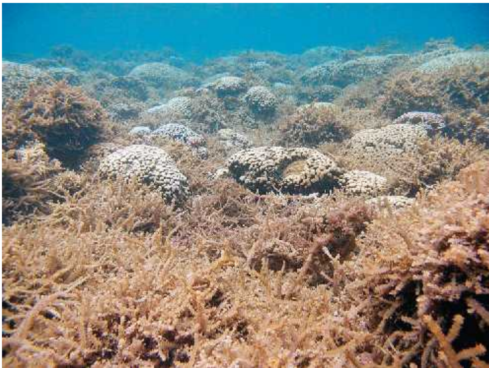
Slika 5. Crvena alga Eucheuma denticulatum koja prekriva koraljni greben (Castro)

Temperatura je također važan ograničavajući faktor za rast koralja. Gornja temperaturna granica je oko 30° C do 35° C, a sve temperature iznad su loše za koralje, baš kao i preniske temperature. Prvi simptom koji se tada pojavljuje, baš kao i u drugim stresnim uvjetima, je izbjeljivanje koralja. Koralji se od toga mogu oporaviti pribavljanjem novih zooxantela ako stresni uvjeti ne potraju predugo vremena. U tom slučaju koralji umiru. Masovna izbjeljivanja koralja, razne bolesti koje pogađaju koralje, njihova smanjena stopa rasta i ostali stresni faktori polako pretvaraju ekosustav koraljnih grebena u ekosustav u kojem dominiraju makroalge. Što je i dulje te alge prekrivaju greben tako se i njegova sposobnost oporavka smanjuje.