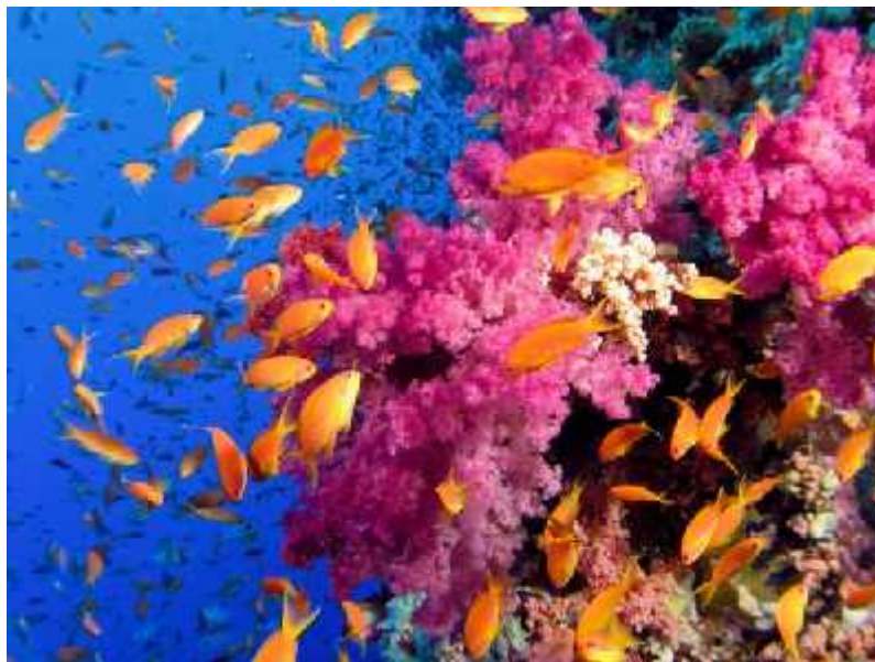
Slika 1. Raznolikost koraljnog ekosustava

Unatoč njihovom značaju kao i dugotrajnoj postojanosti kroz geološka razdoblja, koraljni grebeni su vrlo osjetljive i ranjive strukture. Ugroženi su raznim ljudskim djelatnostima kao što su prevelika eksploatacija, mehanička oštećenja grebena, eutrofikacija i ubrzana sedimentacija zbog poremećaja u terestričkim ekosistemima... Velik problem predstavlja i izbjeljivanje koralja koje ćemo kasnije zasebno obraditi.