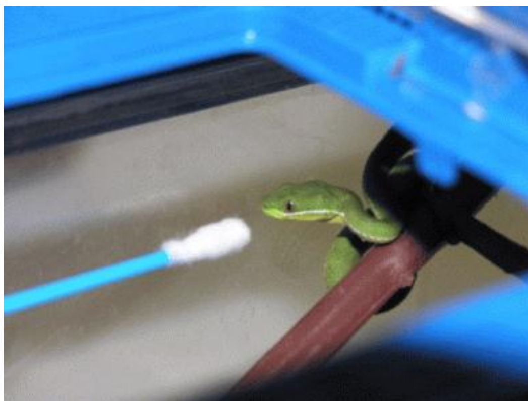
Slika 11. Testiranje zmija na mirise pomoću pamučnih štapića

Prezentaciju mirisa izvela bi tako da sam najprije otvorila vrata kaveza i ostavila ih otvorenima oko 5 minuta kako bi se zmija smirila (otvaranje vrata obično uznemiri zmiju). Zatim bi, vrlo oprezno, pomoću duge pincete, zmiji prinjela vrh štapića na koji sam prethodno nanjela miris (slika 11). Ako zmija ne bi počela palucati jezikom u roku jedne minute, vrhom štapića bi vrlo lagano dodirnula vrh njenog nosa. Nakon prvog palucanja počela bi mjeriti broj palucanja u jednoj minuti. Pokus je završio po isteku jedne minute od početka palucanja. Nakon toga bi odmaknula pamučni štapić, zatvorila vrata kaveza, a zmiju više ne bi uznemiravala. Isti pokus ponovila bi s ostalih 13 zmija.