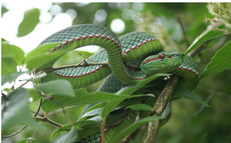
Slika 4. Trimeresurus gumprechtii

Zeleni pripadnici ovog roda, odnosno zelene jamičarke (eng. bamboo vipers, green pit vipers) vrlo se teško razlikuju, čak ni morfološke razlike poput oblika hemipenisa, te broja i oblika ljusaka, ne zadovoljavaju. Velika morfološka sličnost te prisutnost znatne varijacije u arealu rasprostranjenosti često dovodi do krive identifikacije tih vrsta (Malhotra i Thorpe, 2004). Mnoge vrste imaju geografske podvrste, a mogućnost da sve vrste još nisu ni pronađene i/ili opisane velika je. Pošto neke vrste nemaju jasan sistematski položaj, potrebna su daljnja istraživanja i korištenje molekularnih metoda kako bi se u potpunosti objasnio rod Trimeresurus sensu stricto (Malhotra i Thorpe, 2004).