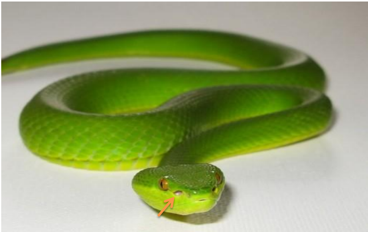
Slika 1. Smještaj termoreceptora u zelene jamičarke ( Trimeresurus albolabris )

nalazi odmah do vidnog, što bi značilo da je moguće da se vidne i infracrvene informacije integriraju i/ili nadopunjuju (Ford i Burghardt, 1993).