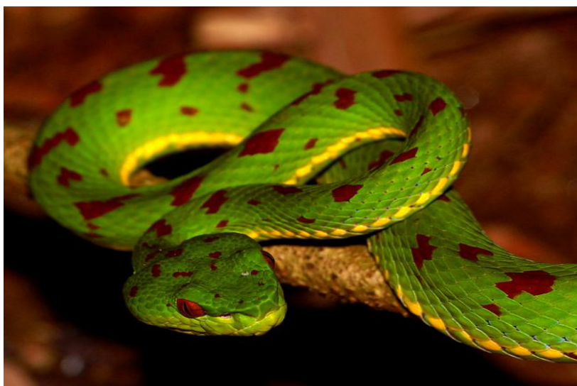
Slika 6. Trimeresurus flavomaculatus