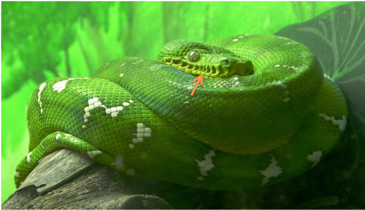
Slika 3. Smještaj termoreceptora u smaragdno udava ( Corallus caninus )