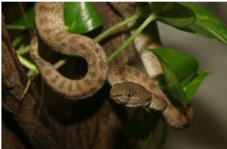
Slika 5. Trimeresurus fasciatus