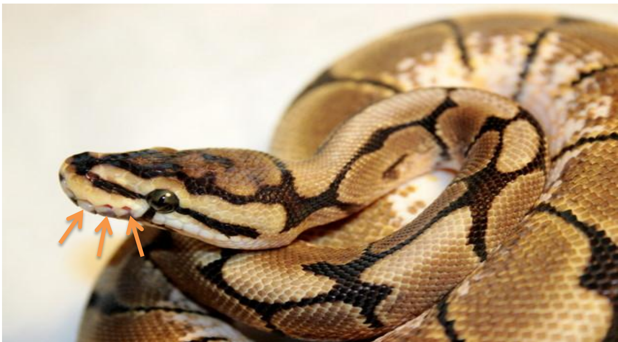
Slika 2. Smještaj termoreceptora u kraljevskog pitona ( Python regius )