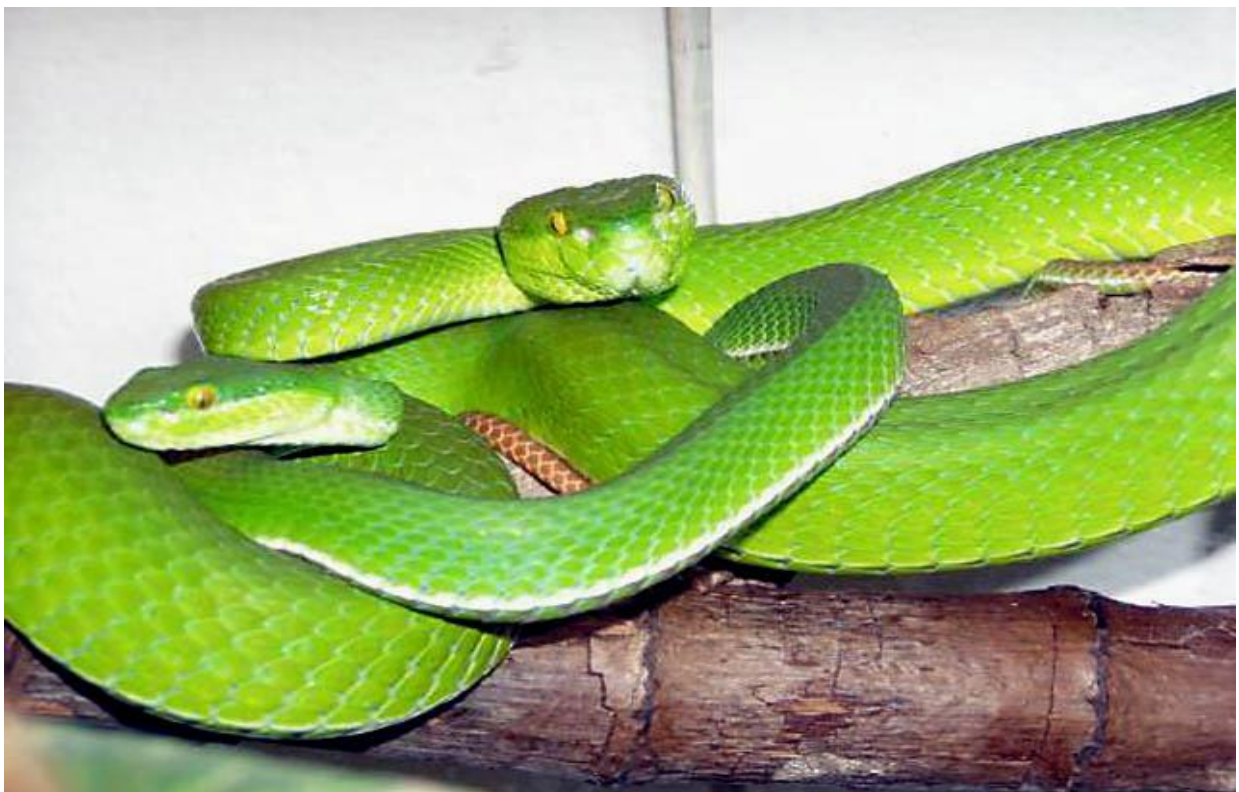
Slika 10. Spolni dimorfizam vrste T. Albolabris