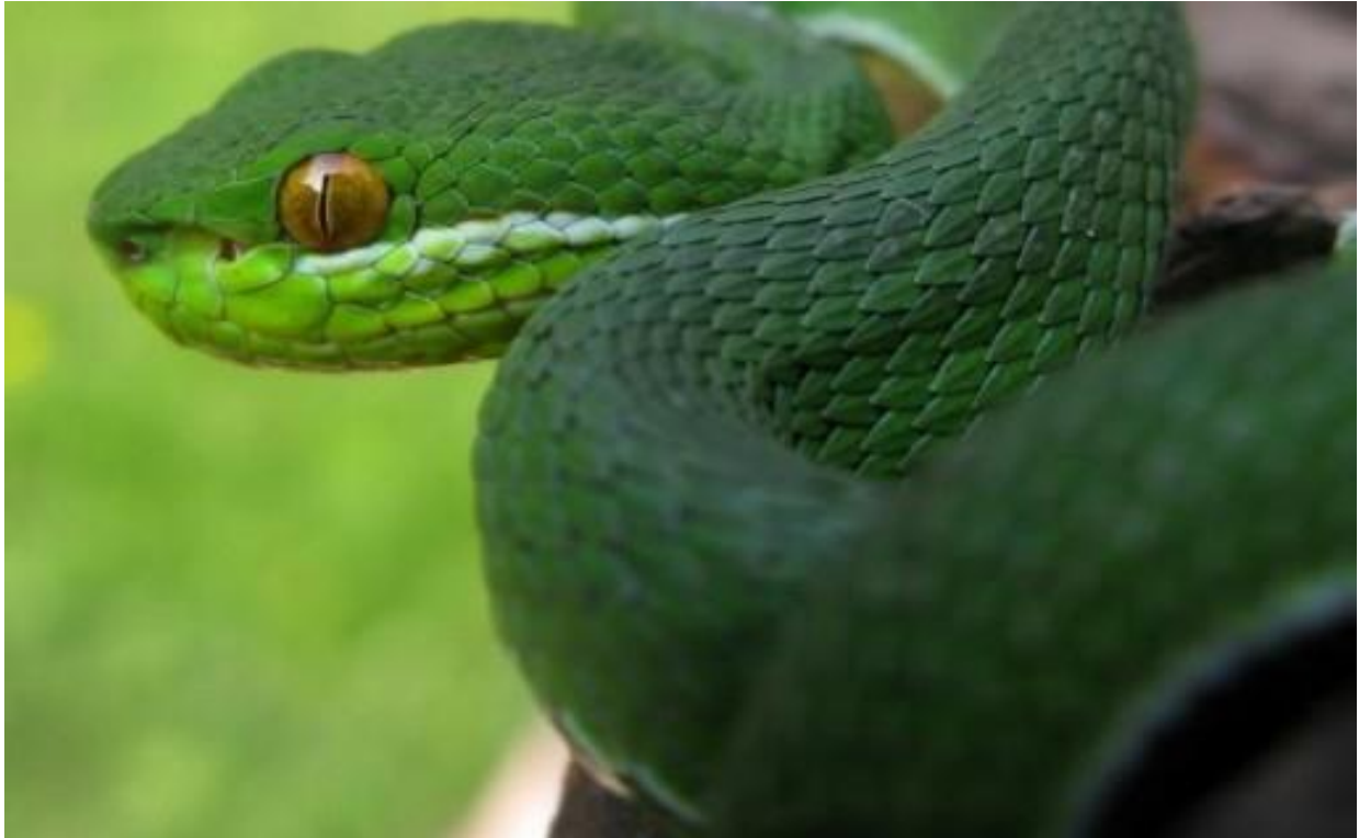
Slika 9. Trimeresurus albolabris , mužjak