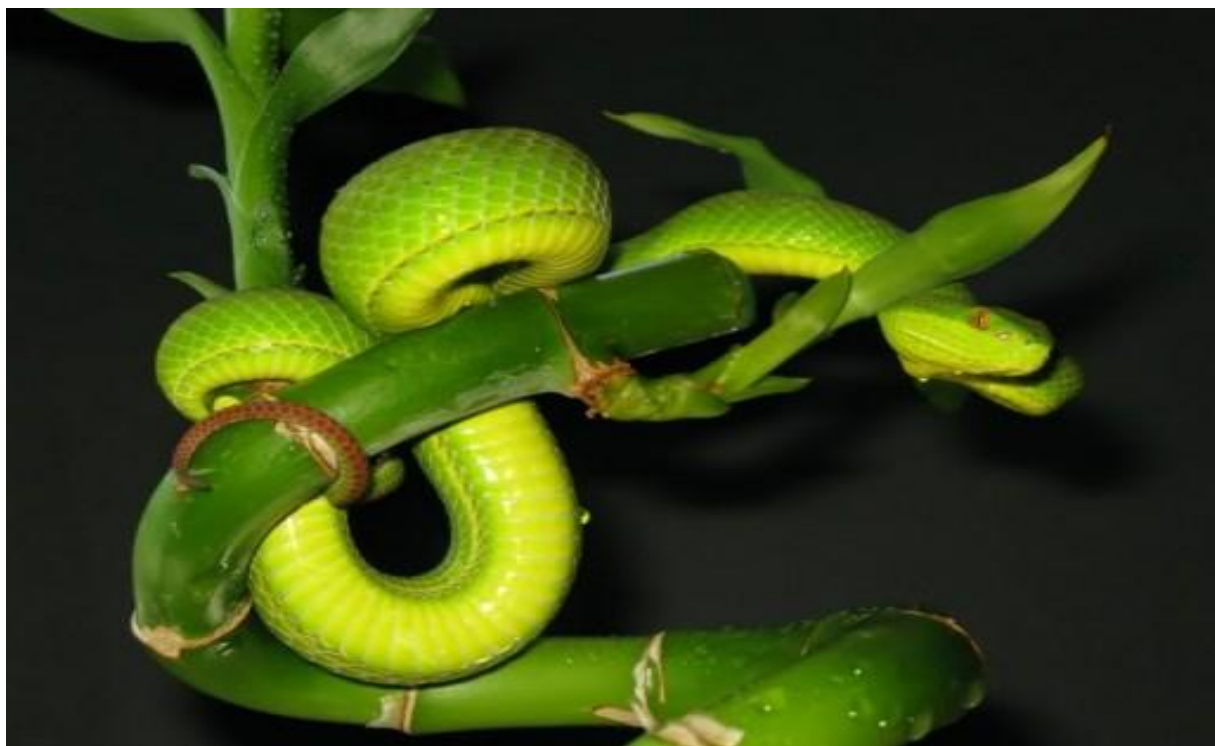
Slika 8. Trimeresurus albolabris , ženka

Ugriz je bolan i uzrokuje obilno oticanje, a može dovesti i do oštećenja tkiva. Smrt u zdravih ljudi nije česta, iako je broj ugriza zelene jamičarke prilično velik.