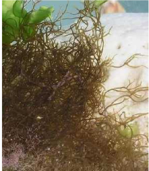
Slika 7. Cladosiphon okamuranus ( http://www.algaebase.org/search/species/detail/?species_id=3887 )

Mozuku je naziv za vrstu Cladosiphon okamuranus (Slika 7.). To je vrsta koja pripada skupini sme ih algi. Podru je njenog rasta su ravni grebeni južnih otoka Japana. Preferira život u mirnoj vodi, ali s umjerenim strujanjima koje su joj potrebne zbog donosa nutrijenata. Uglavnom raste na dubinama 2 do 3 metra, te u razdoblju od kasnog listopada do travnja doseže veličinu od po etnih 2 do 3 centimetra u listopadu do 20 do 30 centimetara u travnju ( www.fao.org/docrep/006/y4765e/y4765e0b.htm#TopOfPage ).