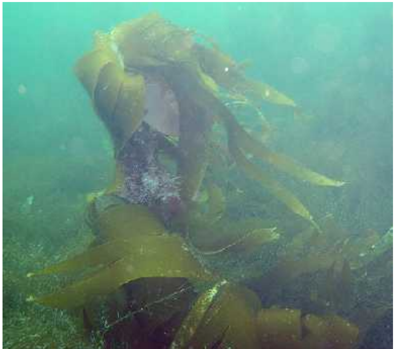
Slika 1. Laminaria sp. ( http://www.searchdictionaries.com/?q=laminaria )

Kombu je japanski naziv za sušene alge koje se dobivaju sušenjem mješavine vrsta iz roda Laminaria (Slika 1.). U Koreji se za istu mješavinu koristi naziv dashima, a u Kini haida ( http://en.wikipedia.org/wiki/Kombu ). Mješavina obuhvaća vrste Laminaria longissima , Laminaria japonica , Laminaria angustata , Laminaria coriacea i Laminaria ochotensis . Glavnu mješavinu čine tri vrste Laminaria longissima , Laminaria japonica , Laminaria angustata . Nabrojene vrste beru se u prirodi, a rastu uglavnom na sjevernoj strani otoka Hokkaido, te manjim dijelom na sjevernim obalama otoka Honshu. Područje njihova rasta su kamenje i grebeni u sublitoralnoj zoni na dubinama od 2 do 15 metara, te na temperaturama od 3 do 20°C.