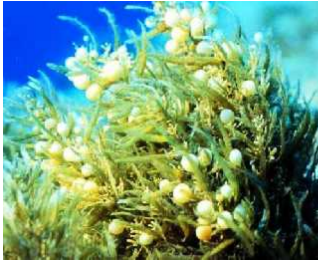
Slika 3. Sargassum fusiforme ( http://tuelinh.vn/rong-mo-1207 )

Kao hrana tradicionalno se koristi u Japanu. Dio se sakuplja iz prirodnih izvora, no sve manje od kada je uvedena kultivirana proizvodnja. Najve u poteško u kod kultivacije predstavlja razmnožavanje u neprirodnim uvjetima. Stoga se talusi sakupljaju u prirodi, postavljaju na užad, te se takvi nasadi spuštaju u more na dubine od 2 do 3 metra. Takav na in uzgoja obi no traje od studenog do svibnja, dok je žetva u svibnju i lipnju.