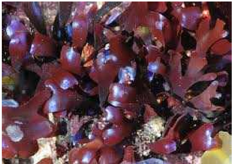
Slika 9. Chondrus crispus ( http://www.seaweed.ie/descriptions/Chondrus_crispus.php )

Njena primjena je vrlo raznolika. U industriji se upotrebljava kao izvor karaginanana koji se upotrebljava kao zgusnjiva i stabilizator u mlijecima i mesnim proizvodima. Na prostorima Europe se obilježava kao E407 i E407b. U pivskoj industriji se koristi kao pročišćivač, pogotovo u proizvodnji za vlastite potrebe. Mala količina se prokuhava s nefermentiranim pivom, te na sebe veže proteine koji se izdvoje iz mješavine nakon hlađenja. Također se koristi kao zgusnjivač kod tiskanja tekstila. U Aziji se koristi kao sredstvo za želiranje. Na Karibima se upotrebljava kao sastojak za pripremu popularnog pića. Alga se kuha sat vremena, doda se aroma, ponekad vanilija, kikiriki ili jagode, te na kraju mlijeko, kondenzirano mlijeko, rum i začin. Obično se servira hladno. Napitak je vrlo gust i neki ga smatraju afrodisijakom i lijekom za mušku impotenciju. U nekim dijelovima Škotske i Irske prokuhava se s mlijekom i cijedi. Na kraju se dodaju arome poput vanilije, cimeta, te viski ili brandi ( http://en.wikipedia.org/wiki/Chondrus_crispus ).