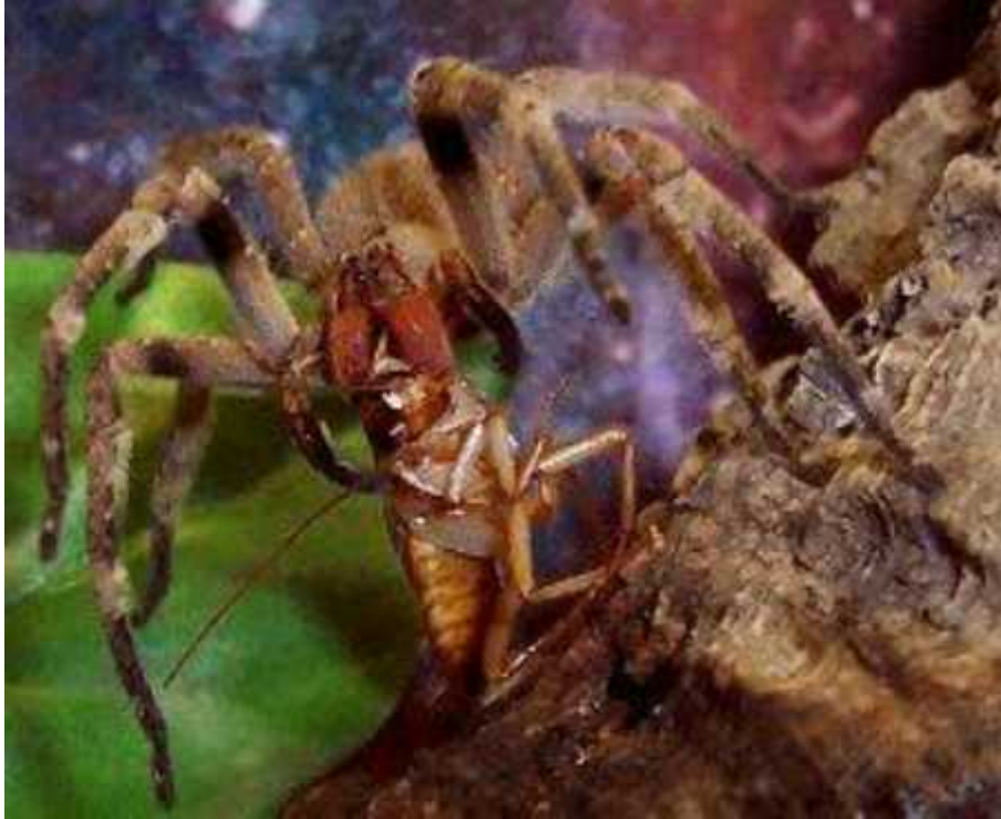
Slika 4. Phoneutria nigriventer . Preuzeto iz Nieuwenhuys E, 2008

Navedeni rodovi pauka, koji ukupno broje dvjestotinjak vrsta, svojim ugrizom mogu uzrokovati bol ili, u jako rijetkim slučajevima, ozbiljnije posljedice. Postoje i druge vrste koje prati glas izuzetno opasnih, primjerice australski mišji pauk roda Missulena , ili noćni pauk Dysdera crocata , čiji ugrizi mogu uzrokovati kratkotrajnu bol, ali ni u kojem slučaju nisu opasni po život ljudi. Prijetnja koju pauci predstavljaju uglavnom je preuveličana. Kliničke studije pokazale su da su ugrizi samo u izuzetnim okolnostima smrtonosni, a za otrove nekih pauka proizveden je i protuotrov ili antitijelo, kao npr. za sfigomijelinazu D iz otrova L. reclusa ( http://ednieuw.home.xs4all.nl/Spiders/Nasty-Spiders/Demystification-toxicity-spiders.htm ).