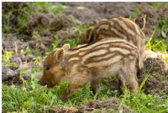
Slika 2. Mladi prašci sa karakteristično obojanim krznom