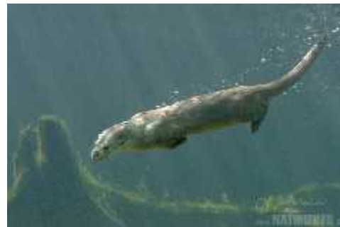
Slika 4. Kretanje vidre na kopnu, foto: J. Bohdal Slika 5. Vidra roni pod vodom, foto: J. Bohdal ( http://www.naturephoto-cz.com/otter-photo-884.html )

Od osjetila, vidra ima dobro razvijen osjet vida, sluha i njuha. U uvjetima slabe svjetlosti pod vodom oslanja se na osjet dodira pomoću brkova ( vibrissae ). Komunikacija između vidri odvija se pomoću mirisa, a rijetko glasanjem prodornim zviždukom, kratkim cvrčanjem te režanjem i pištanjem. Izmetom karakterističnog mirisa vidre označavaju svoj teritorij ostavljajući ga na istaknutim mjestima kao što su velike stijene, debla na obali, ušća pritoka i kanala u glavnu rijeku ili ispod mostova. Osim izmeta mogu se pronaći i želatinozne izlučevine. Velicina teritorija varira ovisno o fizikalnim značajkama vode i dostupnosti hrane. Srednja vrijednost gustoće vidri je jedna jedinka po 15 km toka. U zatočeništvu vidre mogu živjeti od 11 do 16 godina, dok u divljini žive puno kraće, uglavnom od 3 do 4 godine (Jelić, 2010.).