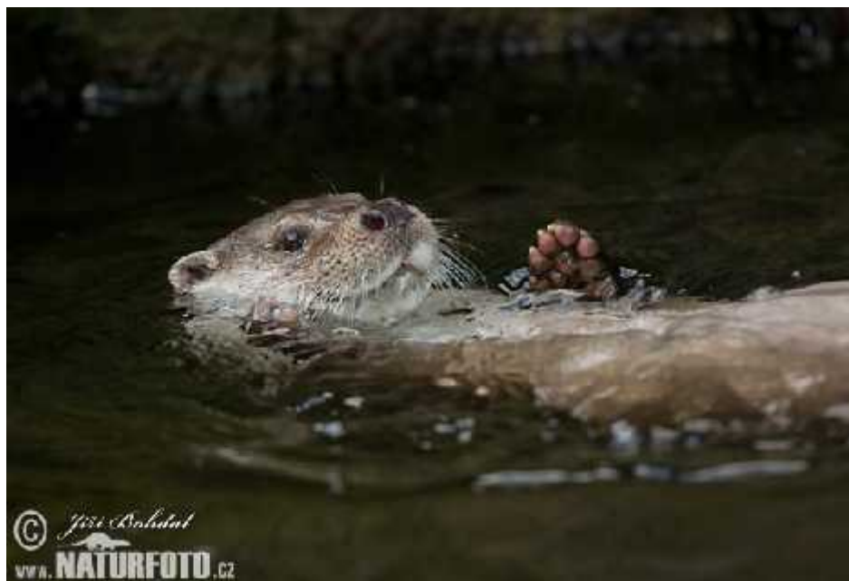
Slika 1. Vidra ( Lutra lutra ) u vodi

Vidra (Sl.1.) je jedna od najljupkijih zvijeri, koja živi na gotovo cijeloj sjevernoj polutki i autohtona je u Europi. Budu i da se lako prilago ava ovjeku, nekada je bila esto pripitomljivana, pa i u ena da bi lovila za ovjeka. Ipak je ovjek nije uvao, naprotiv, proganjao ju je i uništavao zbog visoke cijene njezina krzna i konkurencije u ribolovu. U Hrvatskoj je postala vrlo rijetka. Prije oko pet desetlje a vidri je još bilo u gotovo svim našim rijekama i velikim potocima (Trohar, 1995.).