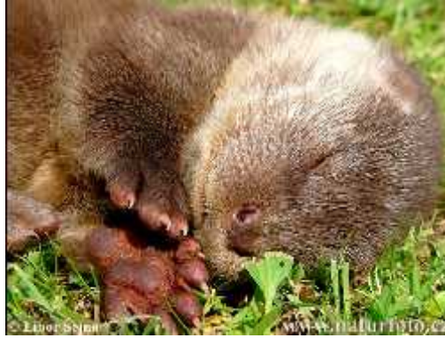
Slika 6. Mladun e vidre