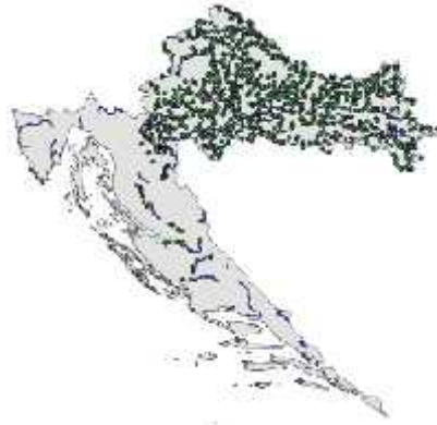
Slika 8. Rasprostranjenost vidre prema istraživanjima provedenim 2009. godine ( http://www.dzpz.hr/dokumenti_upload/20110401/dzpz201104011327570.pdf )