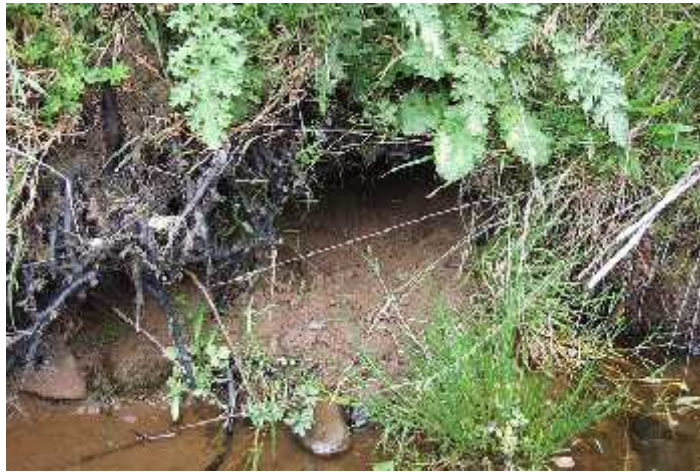
Slika 3. Vidrin brlog na obali rijeke

Vidra je uglavnom aktivna noću, dok preko dana leži u brlogu pod zemljom ili u skloništu iznad zemlje. Obično pola metra ispod površine vode iskopa kosi hodnik na obali rijeke (Sl.3.), koji nakon dva metra završava u njezinoj nastambi. Brlog je sasvim suh i obložen travom. Iz njega izlazi hodnik za prozračak, koji obično završava uz korijenje na obali rastu eg grmlja ili stabala. Vidra sama gradi svoje brloge koristeći i se pritom kakvim rupama koje je izdubila voda. Katkad se koristi jamama lisica ako nisu predaleko od vode. Pravi je vidrin ambijent voda (Trohar, 1995.).