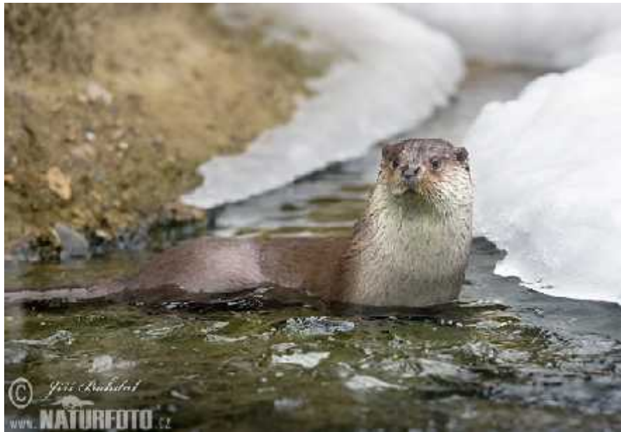
Slika 2. Vidra u potoku, foto: J.Bohdal

Ukupna dužina tijela kod mužjaka koji teže oko 10 kg iznosi oko 100 do 135 cm, od čega na rep otpada od 40 do 50 cm. Ženke su u prosjeku manje te njihova ukupna dužina tijela iznosi od 90 do 125 cm, dok je dužina repa od 35 do 45 cm, a težina oko 7 kg. Vidru prepoznajemo po dugom vitkom tijelu, kratkim nogama i dugom repu (Jelić, 2010.). Na šapama ima jake pandže, koje ne uvlači, a između pet prstiju imaju plivaću kožicu, koja seže do korijena pandži. Vidra ima 36 zubi, a zubna formula je (Trohar, 1995.).