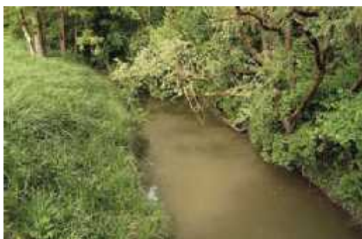
Slika 9. Rijeka Pakra- tipična nizinska rijeka kao stanište vidre

Tijekom 2004. godine u sjeverozapadnom dijelu ribnjaka vidjena su dva mladunca vidre što je dokaz da se one i razmnožavaju na samim ribnjacima. Zbog svojih stalnih i stabilnih izvora hrane te staništa odgovarajućim zaklonom, ribnjaci Poljana jedan su od najvažnijih lokaliteta za očuvanje i zaštitu vidre na području županije. Vidre koriste i ostale manje vodotoke za kretanje po području, osobito one koje posjeduju prirodnu obalu i odgovaraju u vegetaciju koje osigurava zaklon. Recentna istraživanja rasprostranjenosti vidre u Hrvatskoj pokazala su da se u slijevnom području Ilove i Pakre (Sl.9.) nalazi jedna od najgušćih populacija vidri koja je za Ilovu i pripadajuće šaranske ribnjake procijenjena na 33 jedinke, što čini 2,3 % nacionalne populacije. Iz tih razloga su rijeka Ilova i rijeka Toplica predložene za jedno od 31 važnog područja za vidre u Hrvatskoj (Mikuska i Livak, 2010.).