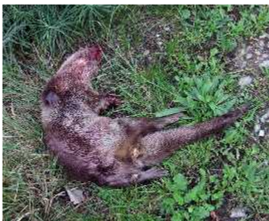
Slika 10. Vidra stradala na prometnici

Vidru ugrožava redovito iš enje “zelenih koridora” (kanala, potoka, obalnih zona) koji imaju važnu ulogu u migracijama vidre. Stradavanja u prometu (Sl.10.) su esta zbog nedostatka tunela i prolaza za životinje. Vidru najviše ugrožava one iš enje voda, time nestaju organizmi kojima se one hrane, a javlja se problem akumuliranja toksi nih tvari kroz hranidbeni lanac. Nedostatak financijske potpore ribnja arstvu uzrokuje napuštanje ribnjaka koji su bili pogodno stanište vidrama. Vidru ugožavanju i problemi na prirodnim staništima kao što su ljetne suše i nedostatak hrane (Lanszki i Kova i , 2007.).