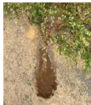
Slika 12. Izmet na vrhu humka, foto: M. Jelić Slika 13. Želatinozna izlučevina, foto: M. Jelić

( http://www.dzpz.hr/dokumenti_upload/20110401/dzpz201104011327570.pdf )