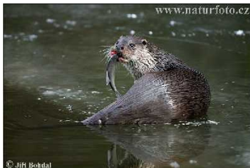
Slika 7. Vidra se hrani ribom, foto: J.Bohdal ( http://www.naturephoto-cz.com/otter-photo-884.html )

U prehrani vidre prevladavaju ribe (Sl.7.), a druge dvije skupine plijena koje imaju znatan udio u prehrani su rakovi i vodozemci. Normalno se hrani svakom vrstom ribe u razmjeru s njezinom brojnoš u te nema dokaza da izbjegava bilo koju vrstu. Rakovima se hrane u ljetnom razoblju, a žabama obično u zimskom i proljetnom razdoblju. Vidra se povremeno lovi i druge kralješnjake (vodene ptice i glodavce) (Jelić, 2010.). U lov polazi sa zalaskom sunca i lovi do svitanja. Pri hvatanju ribe obično je podroni i uhvati za trbuh. Male ribe jede odmah u vodi, a veće od 30 dag iznosi na kopno i ondje ih jede, ostavljaju i glavu i peraje (Trohar, 1995.).