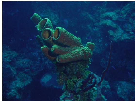
Sl. 4. (a,b). Eksploatacija morske flore i faune

Hidrati prirodnog plina su potencijalno značajan izvor energije, iako je još potrebno dosta znanja o mogućnostima ekonomski isplative eksploatacije. Hidrati su raznoliko distribuirani po svijetu, a najprije su pronađeni u područjima permafrosta Sjeverne Amerike i Sibira. Utvrđeno je da se nalaze i na morskom dnu kao čvrsta masivna brda, a nalazišta su ponekad smještena i nekoliko kilometara ispod morskog dna. Ogromne količine prirodnog plina koje se nalaze u hidratima ne bi se mogle eksploatirati postojećim tehnološkim rješenjima, a uz to, eksploatacija je usko povezana s velikim sigurnosnim problemima mogućeg oslobađanja velikih količina metana iz oceana u atmosferu, požara i eksplozija na proizvodnim postrojenjima, promjene stabilnosti dna mora itd.