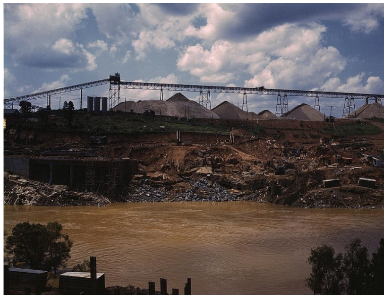
Sl. 5. Negativni utjecaj nalazišta šljunka i pijeska na mora

Šljunak i pijesak kontinentalnog šelfa nadmašuju u volumenu i potencijalnoj vrijednosti sve ostale nežive resurse izuzev nafte i plina. Koriste se uglavnom u građevinskoj industriji. Zbog toga je vrlo bitno da mjesta pronalaska ili vađenja takvih materijala budu što bliža tržištu. Velika Britanija, primjerice, čak 20% svoga šljunka i pijeska dobije iz mora. Takav materijal je cijenjen zbog odlične uniformiranosti čestica, međutim vađenje materijala može itekako oštetiti morsko dno, povećati mutnoću koja bi tako moglo reducirati rast bilja u plićim područjima i samim time utjecati na život riba, rakova i ostalih morskih organizama što bi uvelike moglo utjecati na stabilnost ekosistema. Negativan utjecaj na žive organizme reflektirao bi se i na mogućnosti eksploatacije ekonomski isplativih vrsta.