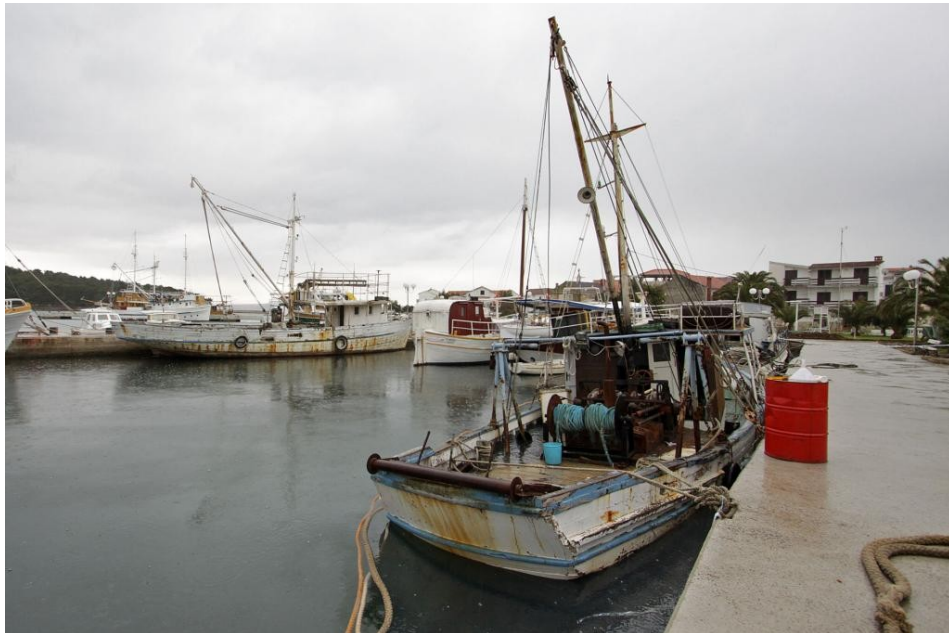
Sl. 6. Prikaz sredstva za prekomjernu eksploataciju živućih resursa

podjednako bentoske i bentopelagične krajnje su ugrožene. Raže, psi i mačke posebno su ugroženi kočarskim ribolovom u ZERP-u.