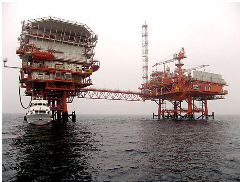
Sl. 3. Naftne platforme i duboka morska crpilišta

Prema definiciji nekadašnjeg predsjednika SAD-a, Trumana, kontinentalni šelf je definiran kao morsko dno zajedno s dubljim slojevima u blizini obale, ali izvan teritorijalnog mora do dubine od 200m (ili dublje od te granice na mjestima gdje je moguća eksploatacija prirodnih resursa na većim dubinama). Iz geološke perspektive kontinentalni šelf je tek jedan dio potopljenog produžetka kopnenog teritorija. Šelf, slaz i podina zajedno čine kontinentalnu granicu.