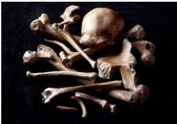
SLIKA 5. Kostii prona ene u dolini Neandertal u Njema koj 1856. godine

vrste Homo sapiens . Otprilike 1-4% suvremenog ljudskog genoma potječe od neandertalaca.