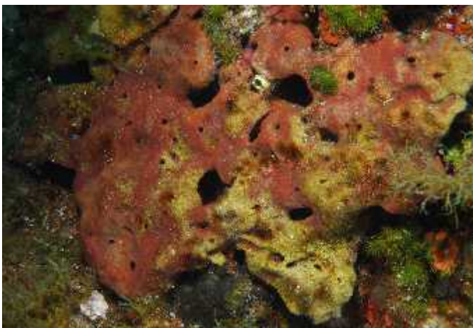
Slika 10. Nekroza tkiva kod spužve Petrosia ficiformis