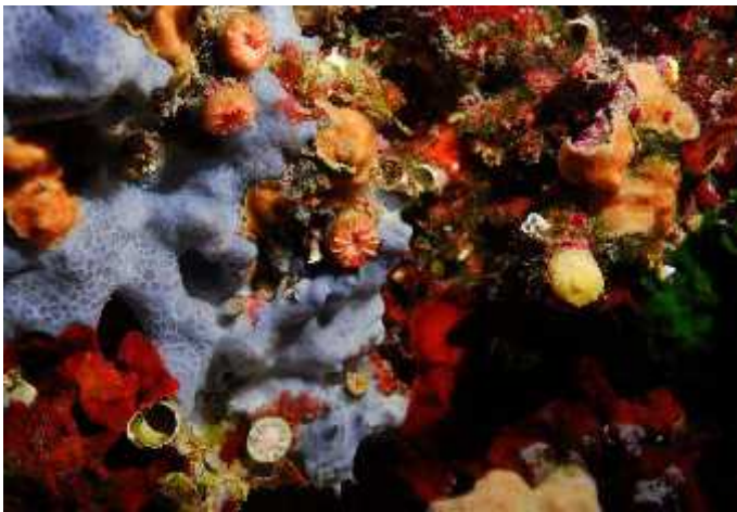
Slika 9. Nekroza tkiva kod kamenih koralja Leptopsammia pruvoti i Caryophyllia inornata