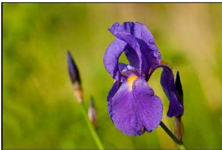
Slika 2. Ilirska perunika ( Iris illyrica )

( http://www.ajo.si/galleries/perunika_20090517/ilirskaperunika.jpg )