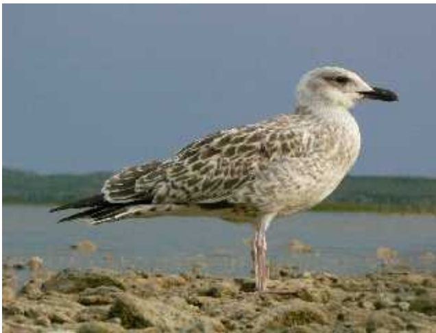
Slika 3. Galeb klaukavac ( Larus michahelis )

Kopnena fauna Kornatskog arhipelaga je vrlo malo proučena. Na simpoziju o Nacionalnom parku "Kornati" održanom 1995. godine u Murteru, od cjelokupne faune otoka prikazan je jedan jedini prilog i to o kornjašima ( Coleoptera ). Iako i u tom radu oslikava se problem neistraženosti kopnene faune. U radu je navedeno kako je prema literaturnim podacima do danas u Kornatima zabilježeno 168 svojiti kornjaša, što je nedvojbeno nedovoljno s obzirom na činjenicu da tih 168 svojiti čine tek 4,4% faune kornjaša za koju je utvrđeno da nastanjuje isto no-jadranske otoke. Pojedini podaci o fauni otoka datiraju davno u prošlost a većina ih je nastala usmenom predajom tako da je njihova vjerodostojnost upitna. Relativno siromašna fauna na kopnu rezultat je oskudnog vegetacijskog pokrivača što je opet posljedica aktivnosti čovjeka na otocima. Fauna je siromašna ne samo po broju vrsta, već i po broju jedinki. U posljednje vrijeme pokrenuli su se pojedini projekti u smislu istraživanja i inventarizacije otočne faune (sove, galebovi, morski vranci, vodozemci, gmazovi, kopneni puževi i ostali).