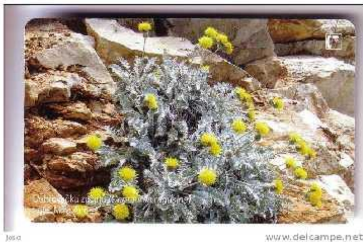
Slika 1. Dubrovačka zečina ( Centaurea ragusina )

Kao značajnije biljne vrste ovog područja svakako treba spomenuti dubrovačku zečinu ( Centaurea ragusina ), bijelu supaljku ( Corydalis acaulis ), pustenasto devesilje ( Seseli tomentosum ), ilirsku peruniku ( Iris illyrica ), uskolisni slak ( Convolvulus lineatus ), drvenastu mlječiku ( Euphorbia dendroides ), te vrste iz porodica kaulunovica ( Orchidaceae ).