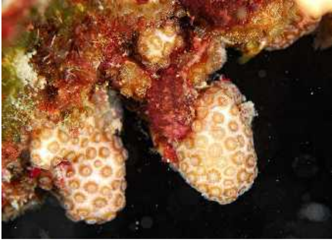
Slika 8. Nekroza tkiva kod kamenog koralja Madracis pharensis