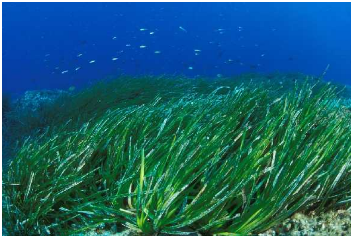
Slika 4. Morska cvjetnica ( Posidonia oceanica )

Bentoska flora Nacionalnog parka Kornati je daleko bolje istraženija te broji 352 svojite, što ini oko 52% od ukupnog broja zabilježenih bentoskih svojiti u Jadranu (682 svojite) i 3 vrste morskih cvjetnica. Prevladavaju svojite iz odjeljka crvenih algi ( Rhodophyta ) s 225 svojiti, zatim slijede svojite iz odjeljka sme ih algi ( Phaeophyta ) s 75 svojiti i iz odjeljka zelenih algi ( Chlorophyta ) s 52 svojite. Iz odnosa crvenih i sme ih algi utvr eno je da bentoska flora ima umjereno suptropski zna aj. Od flornih elemenata u istražennoj flori bentoskih algi, najbolje su zastupljeni atlantski elementi s 123 svojite, zatim mediteranski s 96 svojiti, te kozmopolitski i subkozmpolitski elementi s 60 svojiti. Do sada je odre eno 13 jadranskih endema, što ini 3,6% od ukupno do sada odre enih bentoskih algi u Kornatima. Oko otot i a Purara, posebno zašti ene zone podmorja, odre eno je 228 svojiti bentoskih alga, što ini 64% ukupno do sada odre enih bentoskih alga i nacionalnom parku. Prema podacima iz bioloških istraživanja floralne biocenoze morskog dana su u vrlo dobrom stanju.