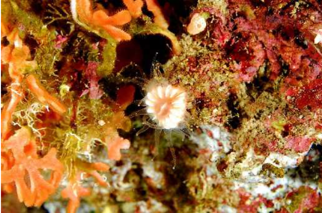
Slika 5. Kameni koralj ( Caryophyllia smithii )

mnogo etinaša ( Polychaeta ), ljuskara ( Ostracoda ), rakova ( Copepoda-Harpacticoida ) i rakušaca ( Amphipoda ).