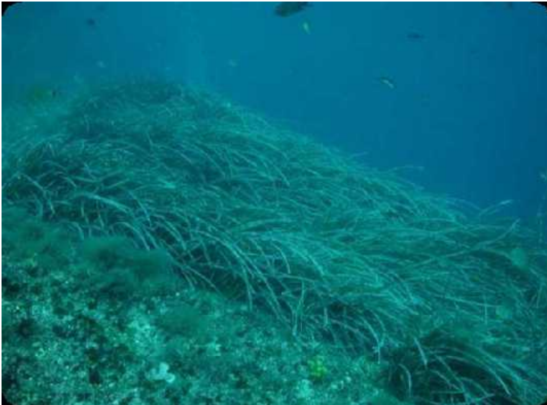
Slika 6. Morska cvjetnica ( Posidonia oceanica )

lovi ribu u Kornatskom arhipelagu, no problem u načinu lova, odnosno lovljenu pomoću dinamita. Takvim načinom lova uništava se podvodna biocenoza, osobito biocenoza morske cvjetnice Posidonia oceanica .