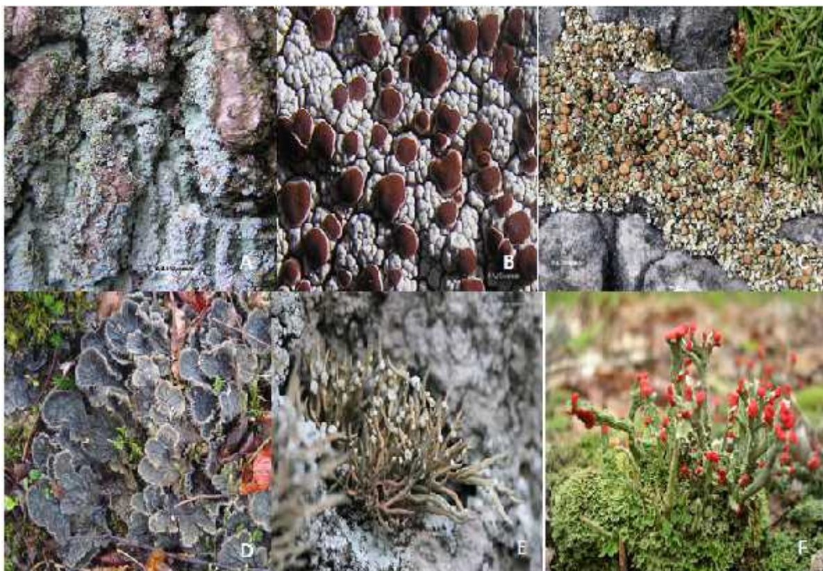
Slika 2. Podjela lišajeva prema tipu steljke. A-leprozni lišaj, Lepraria incana ; B-korasti lišaj, Ophiopharma ventosa ; C- skvamulozni lišaj, Squamarina cartilaginea ; D- listasti lišaj, Peltigera membranacea ; E- grmasti lišaj, Rocella phycopsis ; F-sastavljeni lišaj, Cladonia cristatella

Zbog mnogih sekundarnih metabolita šarolikih aktivnosti, lišajevi imaju veliku praktičnu primjenu. Zbog antiviralnih i antibakterijskih svojstava nekih njihovih sekundarnih metabolita, koriste ih se u farmaceutskoj industriji. Primjerice, polisaharidi vrste Umbilicaria esculenta pokazuju inhibitorско djelovanje na replikaciju virusa HIV-a u laboratorijskim uvjetima. (Slika 3.) Komercijalno najpoznatija vrsta je Cetraria islandica koja se koristi u proizvodnji sirupa protiv kašlja. (Slika 4.) Zbog jakih pigmentata, koriste se za bojanje tkanina. Neke se vrste koriste za izradu parfema, a neke za prehranu. Takva široka primjena esto dovodi do smanjivanja veličine populacije na nekom području. (Nash, 2008.)