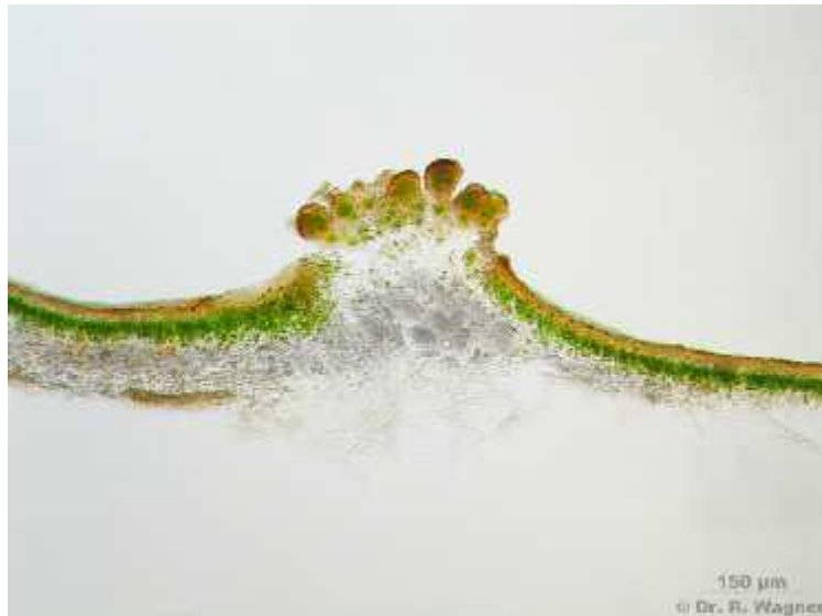
Slika 8. Soralijske vrste Lobaria pulmonaria .

Vegetativni način razmnožavanja pogodniji je zbog toga što su u vegetativnim sporama prisutni i mikobionti i fotobionti, pa je veća vjerojatnost uspješnog razvoja novog talusa. No, vegetativne spore puno su teže od spolnih pa je njihovo rasprostranjivanje ograničeno na manje udaljenosti. Kao posljedica toga, genotipovi određene populacije postaju uniformni na nekom području.