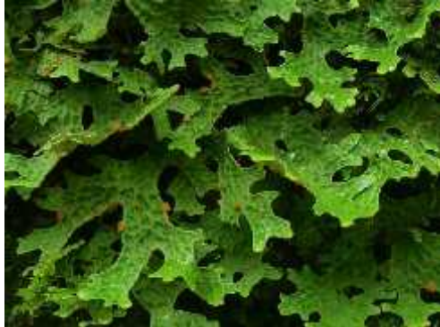
Slika 9. Lobaria pulmonaria

udaljenosti, ono se odvija i spolnim i nespolnim sporama. (Wagner i sur.,2005.) Raste u planinskim područjima umjerenih zona, a česta je u švicarskim šumama na planinama jurske starosti.