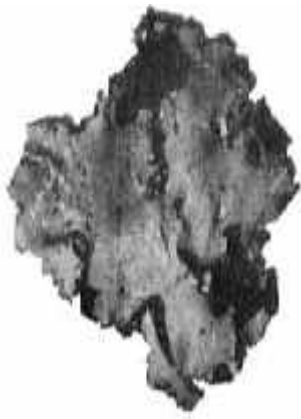
Slika 3. Umbilicaria esculenta