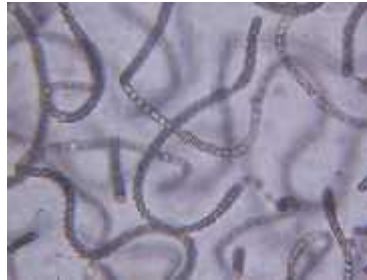
Slika 5. Cijanobakterije iz roda Nostoc

Rodovi zelenih algi Trebouxia i Trentepohlia (fikobionti) te rodovi cijanobakterija Nostoc i rjeđe Gleocapsa (cijanobionti), najčešće su fotobionti u lišajevima. Većina je algi u lišajevima u odjeljku zelenih algi, koje dijele mnoge stanične karakteristike i pigmentaciju (na primjer: klorofil a i b) s kopnenim biljkama. (Nash, 2008.)