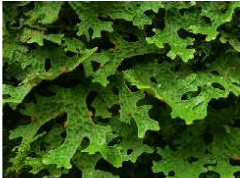
Slika 9. Lobaria pulmonaria

udaljenosti, ono se odvija i spolnim i nespolnim sporama. (Wagner i sur.,2005.) Raste u planinskim područjima umjerenih zona, a česta je u švicarskim šumama na planinama jurske starosti.