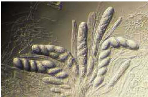
Slika 6. Askospore roda Pertusaria

Spore mikobionta u lišaju smještene su u askusima koji se nalaze u himeniju. Himenij je sloj tkiva u himenoforu rasplodnog tjelešca (askokarpa ili bazidiokarpa). (Slika 6.) Rasplodna tjelešca lišaja najčešće su apoteciji i periteciji kod lišaja koji mikobiont pripada razredu Ascomycetes , te bazidiokarp kod lišaja s mikobiontom iz razreda Basidiomycetes . (Slika 7.) U svakom postojeci askusu nalaze se 4 haploidne jezgre koje se podijele najčešće još jednom tako da u konačnici svaki askus sadrži po 8 jezgara. Oko askusa nalaze se sterilne izdužene nitaste hife koje se zovu parafize. One imaju dvostruku ulogu. Prva uloga je izlučivanje mukoze, a druga je sinteza pigmenta u vršnim stanicama. Kako askospore sazrijevaju, tako se u rasplodnom tjelešcu nakupljanjem vode u mukozi povećava pritisak na askuse. Kada askospore dovoljno sazriju a pritisak mukoze na askuse postane dovoljno velik, askusi pucaju oslobađajući zrele askospore. Diploidizacija askospora u lišajevima događa se samooplodnjom ili stranooplodnjom.