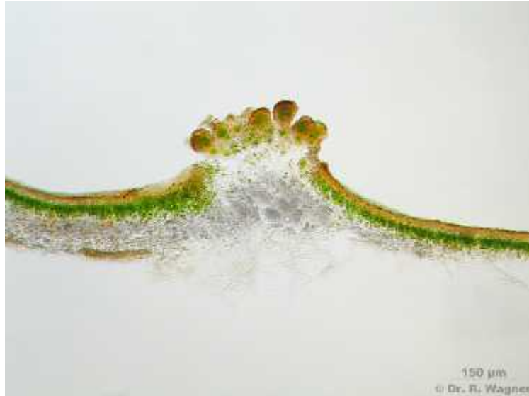
Slika 8. Sorolij vrste Lobaria pulmonaria .

Vegetativni na in razmnožavanja pogodniji je zbog toga što su u vegetativnim sporama prisutni i mikobionti i fotobionti, pa je veća vjerojatnost uspješnog razvoja novog talusa. No, vegetativne spore puno su teže od spolnih pa je njihovo rasprostranjivanje ograničeno na manje udaljenosti. Kao posljedica toga, genotipovi određene populacije postaju uniformni na nekom području.