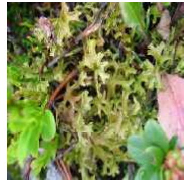
Slika 4. Cetraria islandica