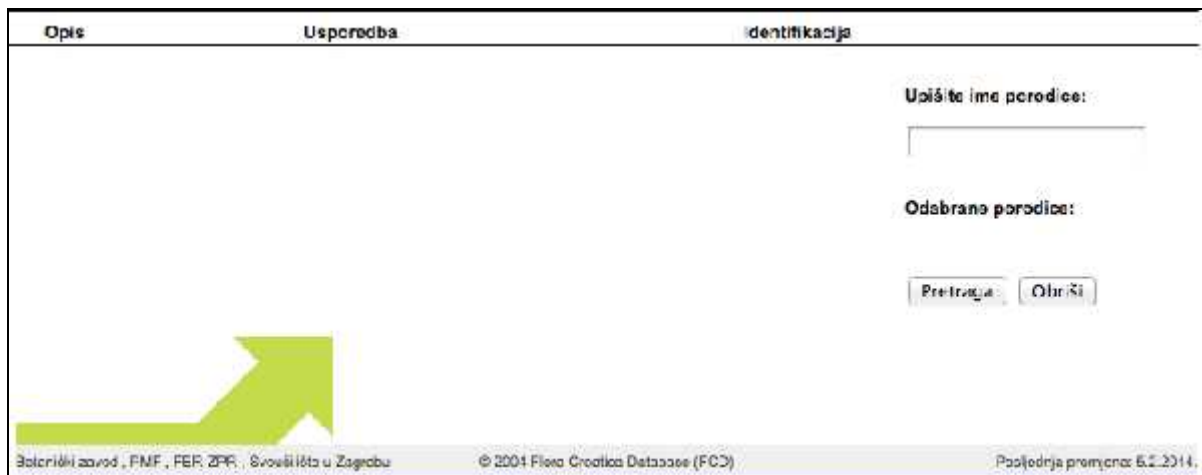
Slika 2. - Slike modula Porodice

Otvorivši modul Porodice u bazi podataka Flora Croatica nude nam se tri opcije pretraživanja, a to su opis, usporedba i identifikacija. Slike modula porodice prikazano je na Slici 2.