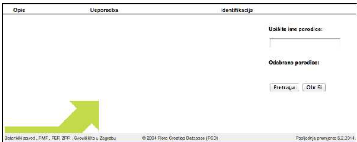
Slika 2. - Slike modula Porodice

Otvorivši modul Porodice u bazi podataka Flora Croatica nude nam se tri opcije pretraživanja, a to su opis, usporedba i identifikacija. Slike modula porodice prikazano je na Slici 2.