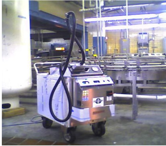
Slika 4. Oprema za fizikalno uklanjanje biofilma u prehrambenoj industriji ( http://www.cleaning-with-steam.com/remove-and-kill-biofilms-in-food-plants.html )

Bolje razumijevanje formiranja bakterijskih biofilмова, jednako kao i njihova detekcija, kontrola i uklanjanje sa površina proizvodnih pogona, potrebno je kako bi se u prehrambenoj industriji osigurala proizvodnja mikrobiološki sigurne hrane (Myszka i Czaczyk, 2011.).