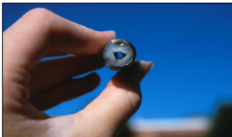
Slika 3. Formiranje biofilma u cjevovodu ( http://biofilmbook.hypertextbookshop.com/public_version )

Površinski sustav za distribuciju pitke vode može biti pod negativnim utjecajem vanjskih izvora putem otvorenih rezervoara i oštećenja na provodnim sustavima uslijed novogradnje. Daljnje širenje biofilma ovisi o materijalu od kojih je izrađen sustav za pitku vodu, temperaturi okoline i otpornosti na dezinfekcijska sredstva (vodikov peroksid, klor i kloramini) koja se koriste za sprječavanje njihova širenja.