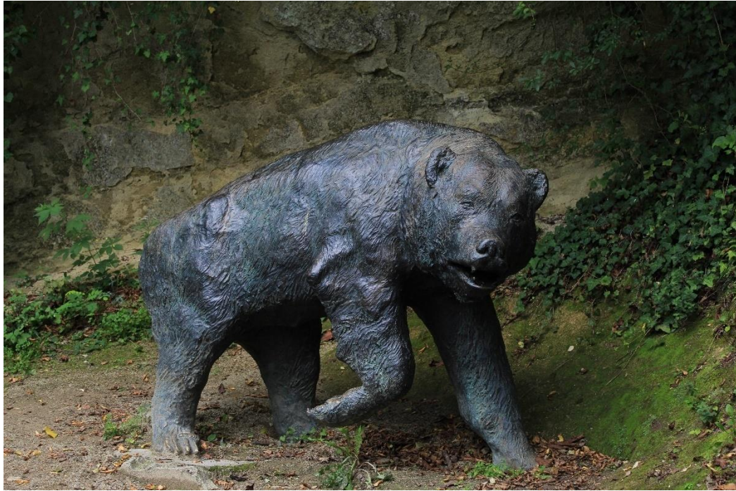
Slika 5. Špiljski medvjed