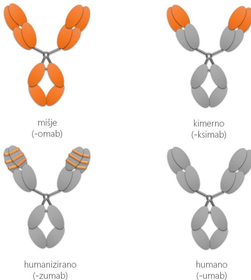
Slika 3. Vrste monoklonskih protutijela ovisno o podrijetlu.

Prvotna monoklonska protutijela bila su mišjeg podrijetla, a kasnije su dobivena kimerna, humanizirana i humana (Slika 3.) (Buss i sur. 2012).