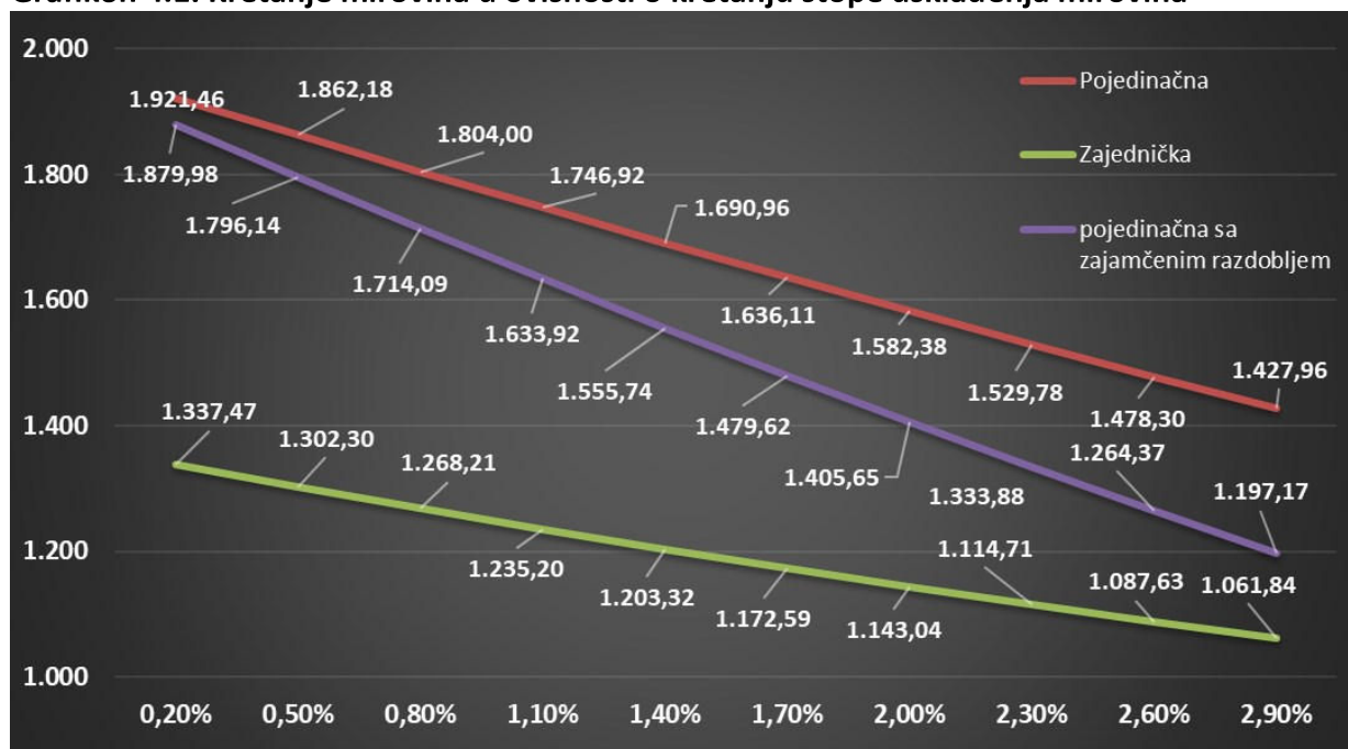
Grafikon 4.1. Kretanje mirovina u ovisnosti o kretanju stope usklađenja mirovina

Nadalje u nastavku je dan grafički prikaz kretanja mirovina u ovisnosti o kretanju stope usklađenja mirovina.