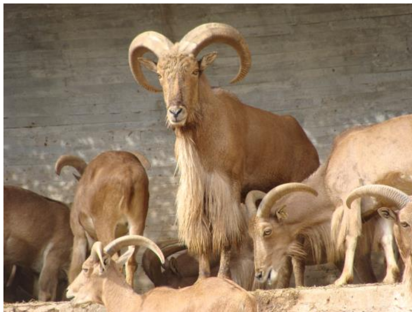
Slika 4. Ammotragus lervia

skakača ( Ammotragus lervia , Slika 4 ) u Sjedinjene Američke Države i Španjolsku, došlo je do spontanog širenja nakon bijega vrsta iz ograđenog rezervata radi lošeg stanja i propadanja ograda te se zatim vrsta nevjerojatno brzo proširila u prirodi (Cassinello i sur. 2004; Gray 1985). Način unosa u Hrvatsku je namjerno ilegalno puštanje 2002. godine (Gančević i sur. 2015; Šprem i sur. 2015).