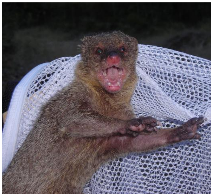
Slika 2. Herpestes javanicus

Potkategorija Biološka kontrola se odnosi na proces puštanja strane vrste s invazivnim potencijalom radi kontrole populacije jedne ili više vrsta koje obitavaju određenom području. Općenito, izvođenje biološke kontrole uključuje puštanje prirodnog neprijatelja organizma čija se populacija želi održavati stabilnom ili smanjiti. Uvođenje stranih vrsta najčešće se provodi u kontroli nametnika u poljoprivredi i šumarstvu (IUCN 2017). Prvi poznati primjer namjernog unosa strane invazivne vrste u Hrvatsku je mali indijski mungos ( Herpestes javanicus , Slika 2 ). Unesen je 1910. godine na otok Mljet u svrhu biološke kontrole zmija, a potom i na nekoliko drugih otoka (Korčula, Hvar, Čiovo, Škrda, Kobrava) i poluotok Pelješac. Populacije na jadranskim otocima potječu od sedam mužjaka i četiri ženke (Tvrčković i Kryštufek 1990). Osim što svugdje gdje je unesen uzrokuje izniman pad populacija gmazova i vodozemaca (Barun i sur. 2010), mali indijski mungos je prenositelj bjesnoće, leptospiroze i mnogih drugih bolesti (Berentsen i sur. 2015; Blanton i sur. 2006; Everard i Everard 1992).