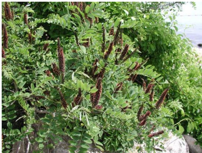
Slika 3. Amorpha fruticosa

Osim za kontrolu drugih vrsta, strane se vrste također unose radi: sprječavanja erozije, stabilizacije pješčanih dina, zaštite od vjetra ili kao barijere poput živica i ograda (IUCN 2017). S obzirom na to da imaju stabilizirajući učinak na okoliš, potkategorija Stabilizacija i barijere obuhvaća te namjerno unesene vrste. Grmasta amorfa ( Amorpha fruticosa , Slika 3 ) unesena je u Europu za izradu živica, smirivanje erozije i kao medonosna biljka (Kozuharova i sur. 2017). Prvi dokumentirani navodi za Hrvatsku potječu iz sredine 20. stoljeća iako je vjerojatno prisutna i ranije (Nikolić i sur. 2014). Često kolonizira staništa visoke vrijednosti, riječna obalna područja, poplavna područja, vlažne livade, šikare i šume. Uspješno mijenja strukturu biljnih zajednica povećavajući rizik od nastanjivanja drugim invazivnim vrstama alternativajući sukcesijske nizove i mikrobnu ekologiju tla tvorbom gotovo monokulturnih sklopova (CABI 2019).