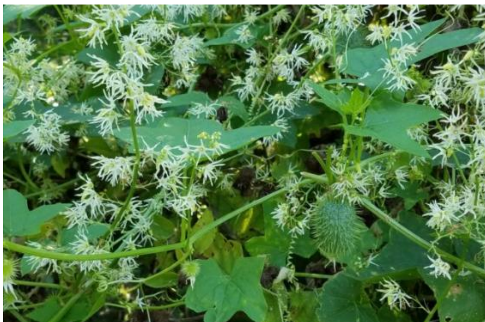
Slika 5. Echinocystis lobata

egzotičnije, to su atraktivnije. Problem u tome što su često egzotične vrste određenoj publici ujedno i strane za to podneblje. Uljna bučica ( Echinocystis lobata , Slika 5 ) namjerno je unesena u Europu kao ukrasna i ljekovita biljka u nekoliko botaničkih vrtova. Već se početkom 20. stoljeća smatra naturaliziranom na području srednje Europe (Nikolić i sur. 2014). U Hrvatskoj je prvi put zabilježena sredinom 20. stoljeća (Devidé 1956) nakon čega se brzo širi relativno teškim i malobrojnim sjemenka primarno barohornom disperzijom na male udaljenosti, dok je moguće širenje i na veće udaljenosti hidrohoriom (Klotz 2007). Također je nedavno zabilježena i zoohorija glodavcima (Dylewski i sur. 2018). Kao brzorastuća penjačica gustim sklopom može u potpunosti prekriti nositelja (Vačić 2005).