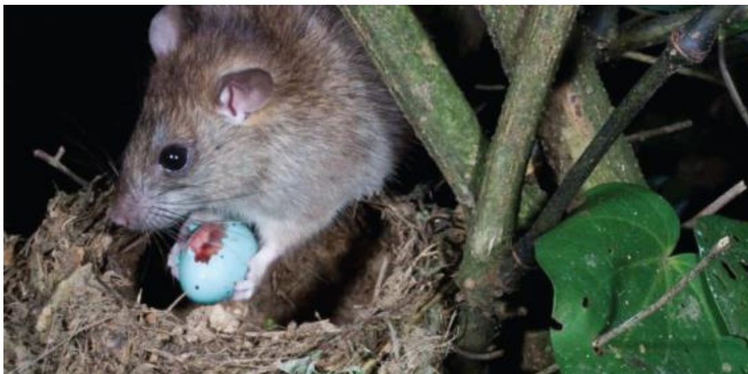
Slika 9. Rattus rattus

Osim ribolovnom opremom, slijepi putnici mogu biti i u kontejnerima za rasuti teret koji se prevoze brodovima, vlakovima, avionima i kamionima (potkategorija Kontejneri za rasuti teret ). Vrsta unesena na sve kontinente kao posljedica puta unosa velikim preookeanskim brodovima je kućni štakor ( Rattus rattus , Slika 9 ). Vrsta obitava u naseljima i prijenosnik je bolesti kao što je bubonska kuga. Također, može biti domaćin brojnim vrstama unutarnjih i vanjskih parazita (Desquesnes i sur. 2002; Mafiana i sur. 1997). Kućni štakor uzrokovao je ili pridonio izumiranju mnogih vrsta divljih životinja uključujući ptice, male sisavce, gmazove, beskralježnjake i biljke, osobito na otocima. Hrani se brojnim vrstama biljaka i životinja, primjerice puževima, kukcima, paucima te plodovima raznih biljaka (Innes 1980). Povezuje se s drastičnim smanjenjem brojnosti populacija ptica na otocima (Purger i sur. 2015; Grant i sur. 1981; Feare 1979; Atkinson 1977), primarno radi hranjenja jajima i mladima (Innes i sur. 1999).