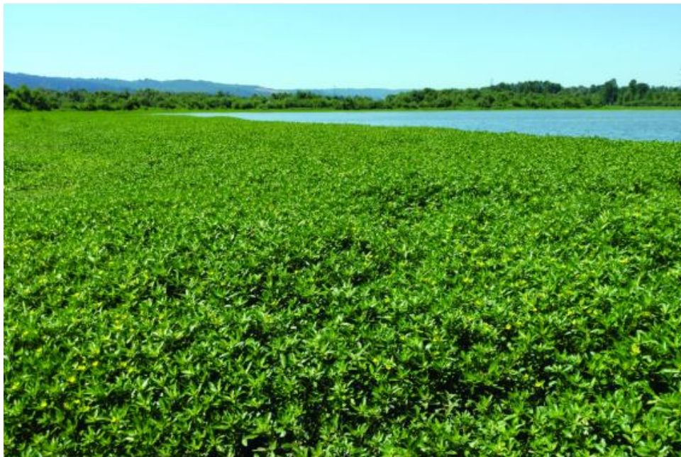
Slika 8. Ludwigia peploides

rasadnicima i Internet prodaji (Robert i sur. 2013). Uz prikladne uvjete raste izuzetno brzo (udvostručuje biomasu u 15-20 dana) pa ubrzano zamjenjuje sve ostale makrofite sve do nastanka monokulture pa razgradnjom obilne biomase dovodi do manjka kisika u vodama (EPPO 2011; Dandelot i sur. 2005). Preostale strane vrste biljaka također unesene iz dekorativnih razloga, a nisu hortikulturene, pripadaju potkategoriji Ukrasne namjene .