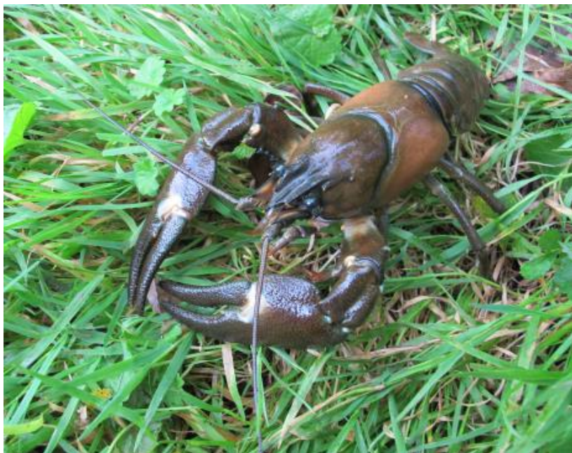
Slika 11. Pacifastacus leniusculus

Neizbježno, pojedine jedinice pobjegle su u okolne vodotoke i uspostavile populacije u prirodnim vodnim tijelima te se od prvog unosa, vrsta širi spontano (CABI 2019; Johnsen i Taugbøl 2010). U Hrvatskoj je prvi put zabilježen 2008. u rijekama Dravi i Muri gdje se spontano proširio iz Slovenije, a trenutno je prisutan u uzvodnom toku rijeke Drave te u rijekama Muri i Korani (Maguire i sur. 2018; Hudina i sur. 2017; Hudina i sur. 2009). Signalni rak ima vrlo negativan utjecaj na autohtone vrste na nekoliko načina: kompeticijom, predacijom i prijenosom bolesti. Znatno je kompetitivniji od autohtonih vrsta riječnih rakova, primarno za hranu i sklonište te je također u konkurenciji za hranu s autohtonim ribljim vrstama. Osim toga, hrani se širokim spektrom vodenih organizama i mijenja strukturu zajednica smanjujući količinu makrofita te mnogih vrsta makrozoobentosa. Najveći problem za autohtone vrste rakova predstavlja upravo prijenos bolesti, tj. signalni rak je djelomično otporan prijenosnik račje kuge koja je smrtonosna za autohtone riječne rakove i redovno vodi njihovom nestanku (CABI 2019; Johnsen i Taugbøl 2010).