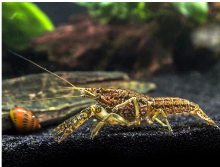
Slika 6. Procambarus virginalis

flore prisutne u terarijima pripada potkategoriji Ukrasne namjene iste kategorije čiji opis tek slijedi. Primjeri unosa invazivnih stranih vrsta kao kućnih ljubimaca su mramorni rak i crvenouha kornjača. Mramorni rak ( Procambarus virginalis , Slika 6 ) se primarno širi kroz trgovinu akvarijskim organizmima. Ima izrazito visok potencijal disperzije koji je primarno rezultat partenogeneze, tj. samo je jedna ženka dovoljna za potencijalno osnivanje nove populacije. Njegov brz rast, rano dosezanje spolne zrelosti, visok fekunditet i sposobnost kompeticije s autohtonim vrstama rakova omogućavaju mu puno brži rast populacije u odnosu na druge vrste invazivnih, a pogotovo autohtonih rakova (CABI 2019). Vrsta je prvi put zabilježena u Hrvatskoj na lokalitetu kraj Koprivnice 2014. godine (Samardžić i sur. 2014). Slično, crvenouha kornjača ( Trachemys scripta , Slika 7 ) se također prodaje kao akvarijska vrsta te se smatra najprodavanijom kornjačom na svijetu. U trgovinama se kupuje kao mlada, malena jedinka koja u nekoliko godina može dostići dužinu i do 30 cm te time često postaje prezahtjevna za držanje. Posljedica toga je da ih ljudi puštaju u prirodu, a to obično budu izolirana jezera u gradovima (CABI 2019). Smatra se da je većina populacija u Hrvatskoj uspostavljena upravo na ovaj način (Jelić i Jelić 2015).