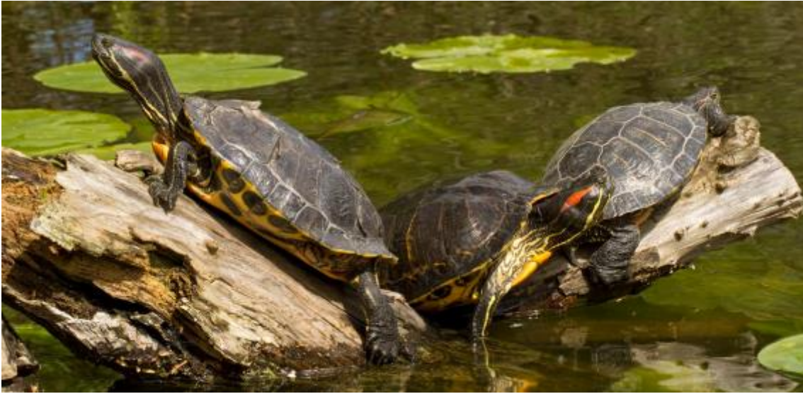
Slika 7. Trachemys scripta

Bijeg stranih vrsta kopnenih životinja koje su držane kao izvor hrane, radi različitih resursa (npr. vuna, mlijeko) ili kao radne životinje pripada potkategoriji Domaće životinje . Osim samog bijega, potkategoriji pripada i puštanje stoke u prirodu za koju se vlasnik više ne može ili ne želi brinuti – analogno namjernom puštanju iz potkategorije Kućni ljubimci.