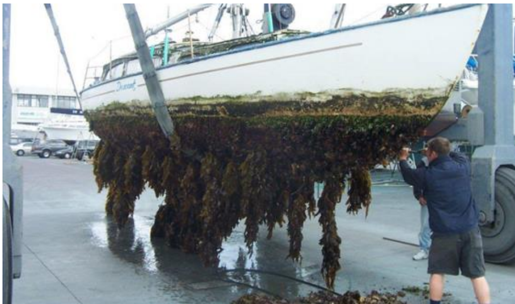
Slika 10. Potkategorija Obraštaj trupa brodova i čamaca

Kao što kategorije Puštanje i Bijeg imaju otvorene potkategorije za rjeđe i specifične puteve unosa, tako i kategorija Slijepi putnici ima potkategoriju Drugi slijepi putnici koja analogno obuhvaća puteve koji ne mogu biti svrstani ni u jednu od prethodnih kategorija.