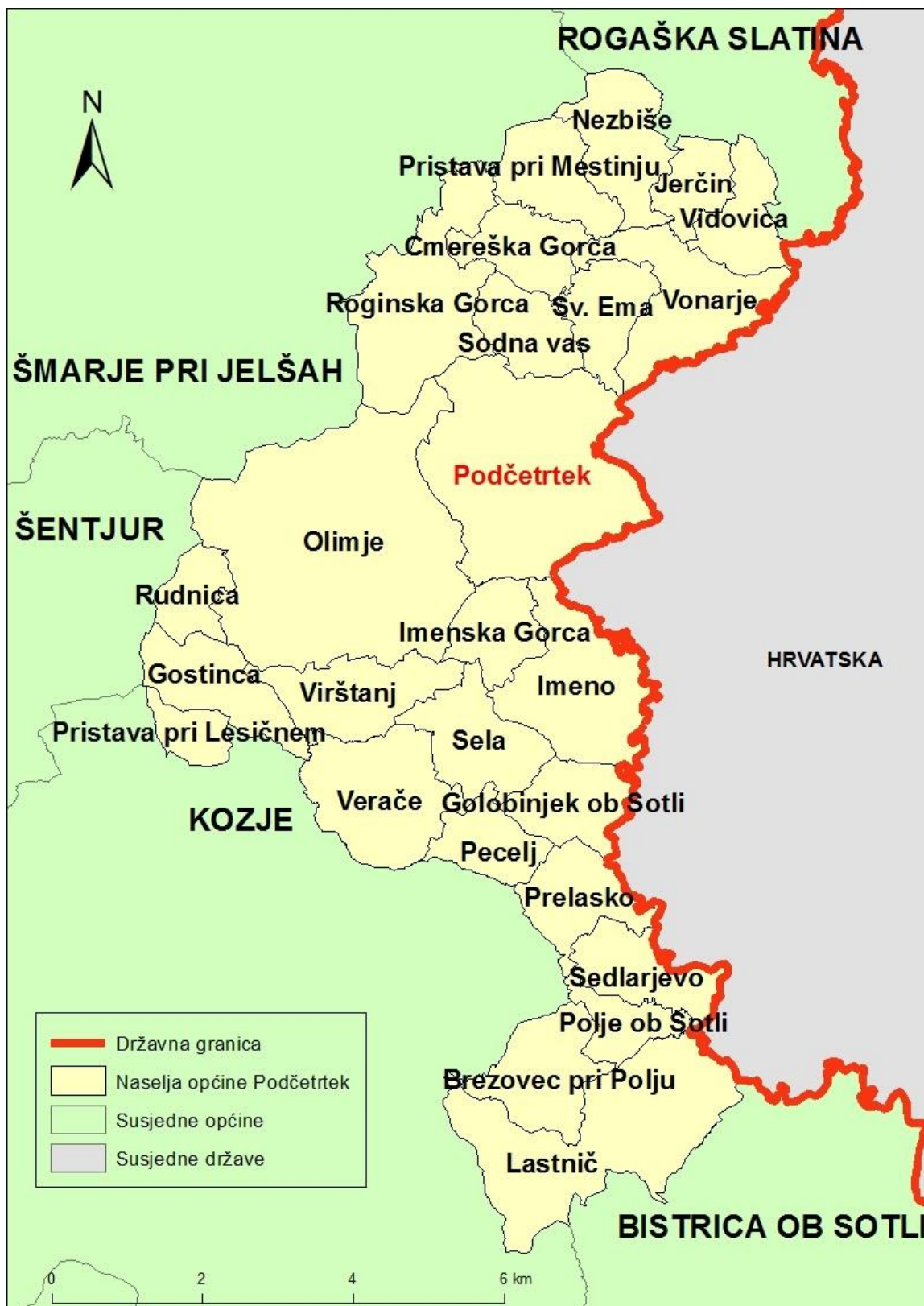
Sl. 2. Naselja Općine Podčetrtek i susjedne općine