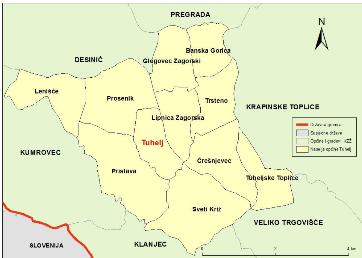
Sl. 1. Naselja Općine Tuhelj i susjedne općine