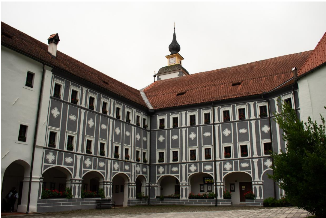
Sl. 17. Dvorište samostana Olimje, Olimje