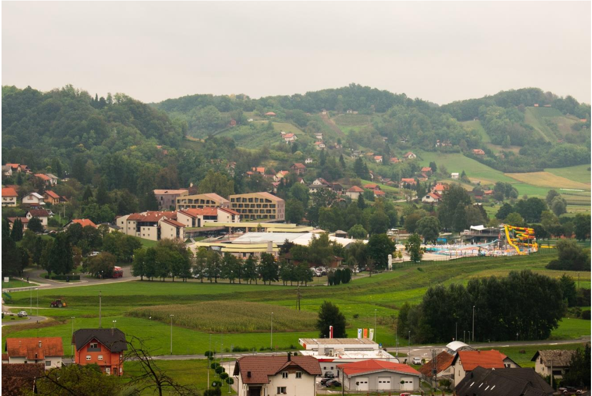
Sl. 4. Kompleks „Terme Tuhelj“