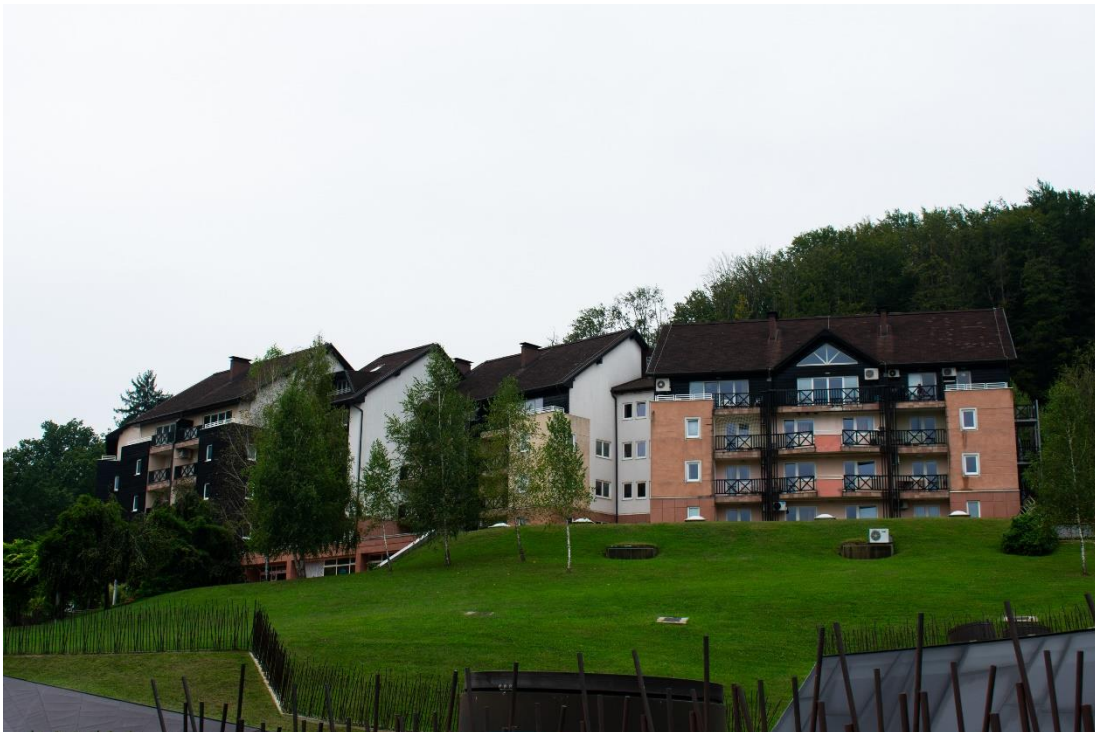
Sl. 8. Aparthotel „Rosa“, „Terme Olimia“