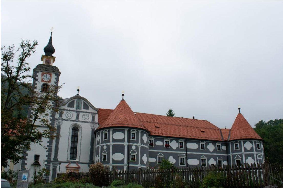
Sl.16. Samostan Olimje, Olimje