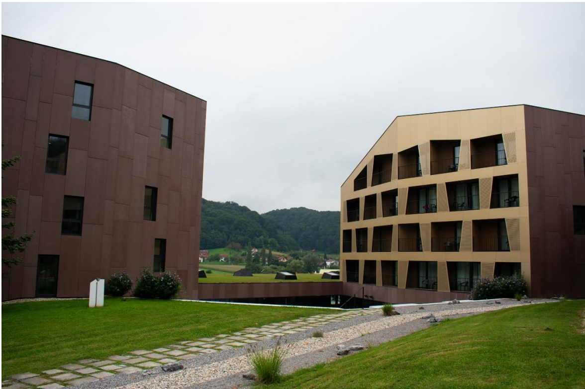
Sl. 6. Hotel „Well“, „Terme Tuhelj“

„Terme Tuhelj“ imaju raznovrsnu smještajnu ponudu koja se sastoji od hotela, hostela i kampa, ali smještajna ponuda „Termi Olimia“ koja se se sastoji od 2 hotela, aparthotela, apartmanskog naselja i kampa je mnogo razvijenija i prema raznovrsnosti i prema samom kapacitetu. Dio smještajnih objekata „Termi Tuhelj“ i „Termi Olimia“ prikazan je na slikama 6, 7 i 8.