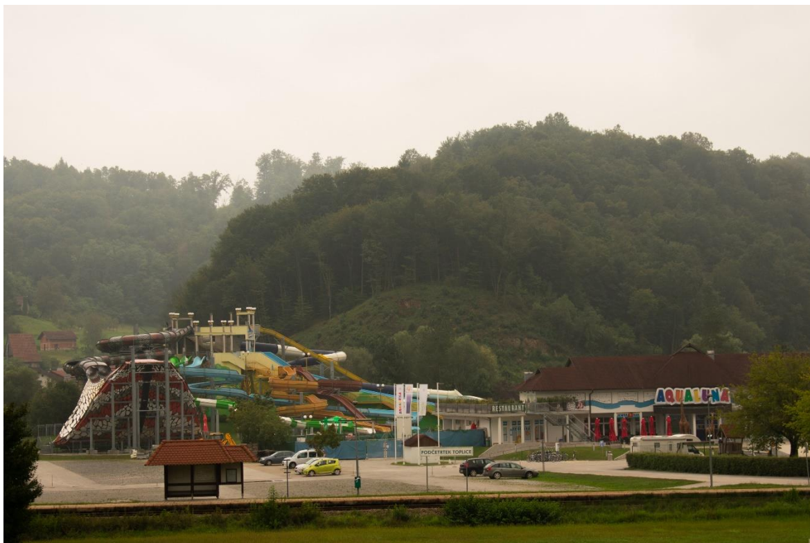
Sl. 10. Termalni park „Aqualuna“, „Terme Olimia“

Osnovicu kupališno-zabavnih sadržaja „Terme Olimia“ čini „Aqualuna“ s 3 000 m 2 vodenih površina. „Aqualuna“ je prikazana na slici 10. Termalni park je u potpunosti ispunjen termalnom vodom. Sastoji se od bazena za opuštanje koji nudi masažu, gejzire i vodeni slap, bazena s valovima, bazena za slijetanje s 9 tobogana, a dio za djecu naziva se „Aqua Jungle“. Tobogani su namijenjeni svim uzrastima, postoje oni za djecu, ali i oni za odrasle željne adrenalina. Ponudu čini ukupno 14 tobogana i vodenih staza. Dio kupališno-zabavnih sadržaja čini i ponuda Family wellness „Termalija“. „Termalija“ ima dio koji se zove „Oaza bazena“ i obuhvaća 2 000 m 2 vodenih površina raspoređenih u nekoliko bazena. Veliki bazen temperature 30 do 32 °C je djelomično unutarnji, a djelomično vanjski te sadrži masaže, rimske kupke, gejzire i slapove. Bazen „Aqua“ pod šatorom temperature 28 do 30 °C nudi vodene mlaznice, zatvoreni tobogan, a osim njega tu su i 2 dječja bazena (unutarnji i vanjski) temperature 32 do 36 °C te 3 whirpoola s temperaturom vode 34 do 36 °C (33).