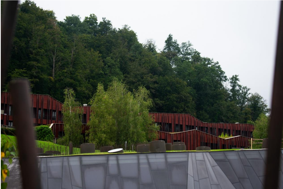
Sl. 7. Hotel „Sotelia“, „Terme Olimia“