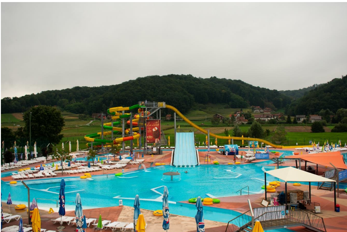
Sl. 9. „Vodeni planet“, „Terme Tuhelj“

Nakon usporedbe ponude smještaja analizirana je ponuda kupališno-zabavnih sadržaja. Ponuda kupališno-zabavnih sadržaja odnosi se na bazene i s njima povezane atrakcije, primjerice tobogane. Glavninu kupališno-zabavne ponude „Terme Tuhelj“ čini „Vodeni planet“. „Vodeni planet“ obuhvaća 8 unutarnjih i vanjskih bazena ispunjenih termalnom vodom ukupne vodene površine veće od 5 000 m 2 . Vanjsko kupalište sastoji se od bazena s valovima, dječjeg bazena s 4 tobogana i vodenim topovima, bazena za najmlađe uzraste s vodenim igračkama, relaksacijskog bazena s gežirima, vodenim tornjevima i podvodnom masažom. Ponuda vanjskog kupališta uključuje i tobogan s 5 traka za spuštanje, 2 adrenalinska tobogana te tobogan „Kamikazu“. Bazeni su povezani kanalom dužine 250 m koji ima 2 lagune i podvodne masaže. Vanjski dio „Vodenog planeta“ s ponudom za najmlađe zove se „Tuhi land“, a obuhvaća 2 zatvorena tobogana, 2 otvorena tobogana te prskalice i slične sadržaje zanimljive najmlađim uzrastima. Unutarnji dio sastoji se od olimpijskog bazena dužine 25 m, zatvorenog tobogana, dječjeg bazena s toboganom i terapijskog bazena, jacuzzi s masažom, wellness bazen s vodenim slapovima, masažama i gežirima. Osim „Vodenog planeta“ kupališno-zabavnu ponudu čine i dva stara bazena na samom izvoru termalne vode (34). „Vodeni planet“ prikazan je na slici 9.