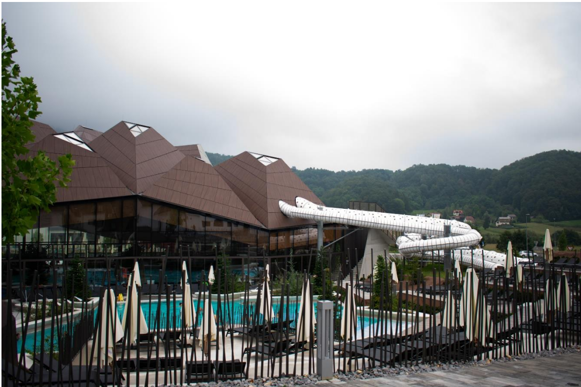
Sl. 11. Family wellness „Termalija“, „Terme Olimia“

masaže, a tretmani njegu lica, njegu tijela, anticelulitne tretmane, pedikuru i manikuru. Centar uključuje i hamam. Wellness i spa ponudu ima i hotel „Sotelia“ kroz vlastiti centar „Spa Armonia“. Ponuda uključuje kućne masaže (armonia, olimia, vitae), masažu stopala te različite kozmetičke tretmane. Uz sve nabrojeno, „Terme Olimia“ nude i selfness programe. Selfness je noviji koncept wellnessa , njegova svojevrsna nadogradnja, a podrazumijeva rad na sebi, odnosno težnju za poboljšavanjem samog sebe (33).