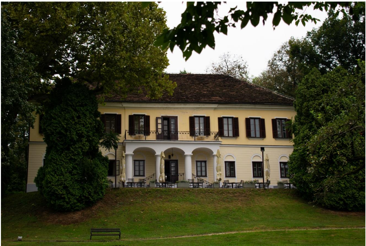
Sl. 3. Dvorac Mihanović, Tuheljske Toplice

slici 4. Nakon privatizacije vidljiva su konstantna ulaganja u poboljšanje i proširivanje ponude. Sportska dvorana uređena je 2008. godine, 2009. godine uređen je kamp, a 2010. godine Mihanovićev perivoj. Značajna investicija ostvarena je 2012. godine kada je proširen wellness , izgrađen novi kongresni centar, preuređen postojeći hotel i izgrađen novi hotel „Well“ s 4 zvjezdice. Godine 2015. obnovljen je hostel „Vila“ te je rekonstruiran mural Ede Murtića (34). Nakon privatizacije i navedenih ulaganja u ponudu „Terme Tuhelj“ postaju najsnažnije topličko središte Hrvatskog zagorja, ali i jedno od glavnih turističkih središta Kontinentalne Hrvatske.