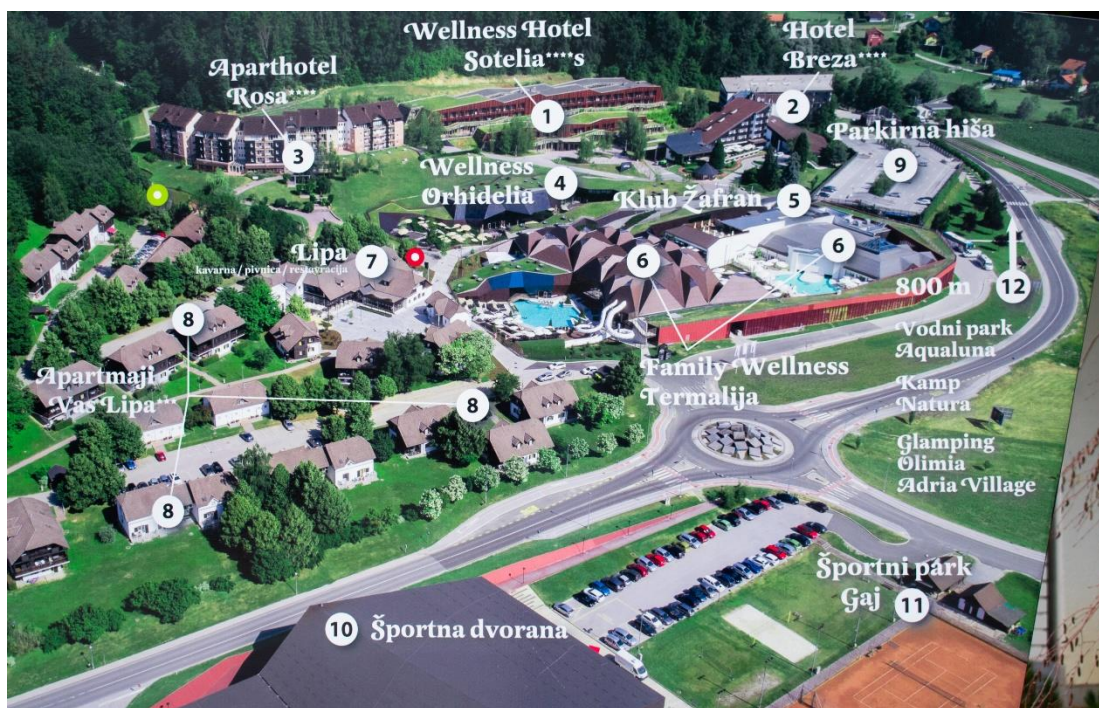
Sl. 5. Prikaz dijela kompleksa „Terme Olimia“

Međutim, brzi rast ostavio je i ekološke posljedice. Izvor Harina Zlaka kapaciteta 3,7 l/s i temperature 33 °C koji se nalazi uz rijeku Sutlu na hrvatskoj strani presušio je nakon što su 1970-ih napravljene bušotine na slovenskoj strani u svrhu korištenja vode za potrebe toplica (Borović i Marković, 2014). Ekološke implikacije upravljanja vodnim bogatstvima u tom razdoblju nisu bila u središtu pažnje, a pitanje prekogranične suradnje nije postojalo jer su u tom razdoblju Slovenija i Hrvatska bile u sastavu iste države. Danas je situacija drugačija te su okolišna pitanja, pa tako i održivo korištenje vodnih resursa, jedna od ključnih pitanja čovječanstva. Budući da vodonosni slojevi mogu prelaziti državne granice, potrebno je zajednički regulirati njihovo korištenje, a Borović i Marković (2014) kao primjer dobre prakse navode takav sporazum između Slovenije i Mađarske te smatraju da bi se i Hrvatska trebala uključiti u taj sporazum, a sve s ciljem očuvanja količine, kemijskog sastava i temperature vode u zajedničkim vodonosnim slojevima.