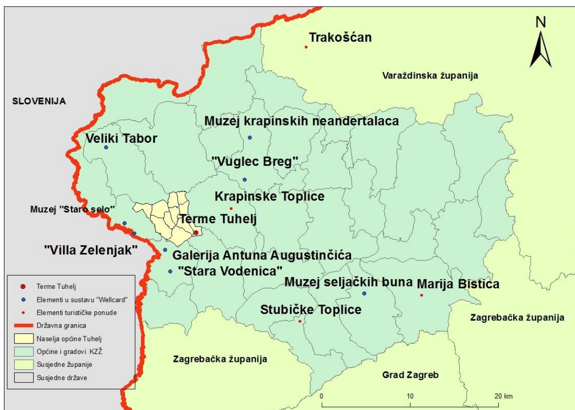
Sl. 14. Turistički sadržaji u okolini „Terma Tuhelj“ 2019. godine

Črešnjevec, Tuhelja, Prosenika do najviše točke Dugnjevca pa preko Pristave i Tuhlja natrag do Tuheljskih Toplica. Pješačka ruta „Dubrovčan-Ravnice-Velika Erpenja-Tuheljske Toplice“ traje 2 i pol sata, a ishodište joj je restoran „Zelengaj“, ruta „Okolicom Tuheljskih Toplica“ je kružna, a očekivano trajanje je 3 sata. Kružna ruta „Dvorac Mihanović-Črešnjevec-„Terme Tuhelj““ prolazi kroz vinogradarsko područje. Posljednja ruta također započinje i završava u „Termama Tuhelj“, a prolazi kroz Rakovec, Sveti Križ i Črešnjevec. Na spomenutim stazama se uglavnom mogu vidjeti sakralni objekti okolice, uz određeni broj vinograda (34). Turistički sadržaji iz okolice koje na svojim internetskim stranicama predstavljaju „Terme Tuhelj“ prikazani su na slici 14. Posebno su označeni sadržaji u sklopu sustava „Wellcard“.