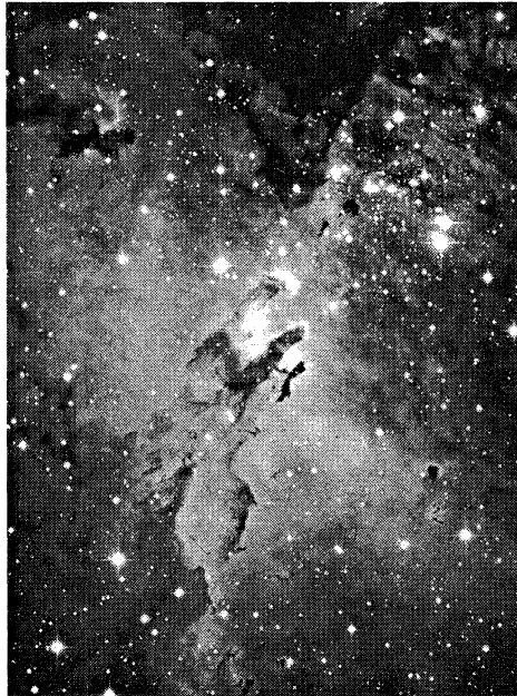
Slika 1. Emisijska maglica M16 (NGC 6611). Maglica je primjer galaktičkog HII područja, što znači da se radi o području ioniziranog vodika (otuda karakteristična crvena boja takvih maglica). Maglica svijetli zahvaljujući energiji koju dobiva od ultraljubičastih fotona vrućih masivnih zvijezda koje su nastale od njezine tvari prije dva milijuna godina. Na slici se vidi manji skup takvih vrućih O i B zvijezda u gornjem desnom dijelu maglice. Velik broj ‘crvenih’ zvijezda samo je naizgled takve boje, ustvari one su ‘pocrvenjele’ zbog apsorpcije njihovog zračenja na česticama prašine u maglici koja ih okružuje. U središnjem dijelu maglice vidi se nekoliko traka koje su zbog svojeg izgleda dobile naziv ‘slonovske surle’. (Snimak s 4-m Mayallovog teleskopa Kitt Peak National Observatory.)

Pogled na zvjezdano nebo može nas zavarati. Naizgled se ništa ne događa – zvijezde, točkasti treperavi izvori svjetla nepromjenjivo zrače iz noći u noć, i tako iz godine u godinu. Međutim, sve se zvijezde vremenom mijenjaju, ali promjene se događaju postepeno a vremenske skale daleko nadmašuju vremensku skalu na koju je čovjek navikao. U nekom je smislu razvoj zvijezda ciklički proces. Zvijezde nastaju iz plina i prašine koji postoji u prostoru između zvijezda, i naziva se međuzvjezdana sredina (MZS). Tijekom razvoja zvijezde, ovisno o njezinoj masi, dio tvari bit će vraćen u MZS, bilo zvjezdanim vjetrovima, bilo eksplozivnim pojavama. Sljedeće generacije zvijezda će nastati iz te “prerađene” tvari. Da bismo razumjeli razvoj zvijezda, moramo također proučavati prirodu MZS.