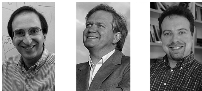
Slika 1. Dobitnici Nobelove nagrade iz fizike za 2011. godinu, Saul Perlmutter (lijevo), Brian P. Schmidt (u sredini) i Adam G. Riess (desno). Perlmutter (r. 1959. god.) je profesor astrofizike na University of California u Berkeleyu. Schmidt (r. 1967. god.) profesor je na Australian National University u Weston Creeku, a Riess (r. 1969. god.) je profesor astronomije i fizike na Johns Hopkins University i Space Telescope Science Institute u Baltimoreu.

Početak i kraj 20. stoljeća u kozmologiji je obilježen velikim otkrićima. Velika pak otkrića u početku najčešće još nemaju objašnjenje. Kada je Vesto Slipher 1913. godine objavio otkriće crvenog pomaka u spektrima spiralnih maglica, niti prava priroda spiralnih maglica još nije bila otkrivena. Na samom kraju stoljeća, a ujedno i milenija, 1998. godine, otkriće ubrzanog širenja Svemira promijenit će kozmološku paradigmu – umjesto gravitacijske sile Svemirom vlada tamna energija čije je porijeklo, unatoč intenzivnim istraživanjima proteklih desetak godina, još uvijek nepoznato.