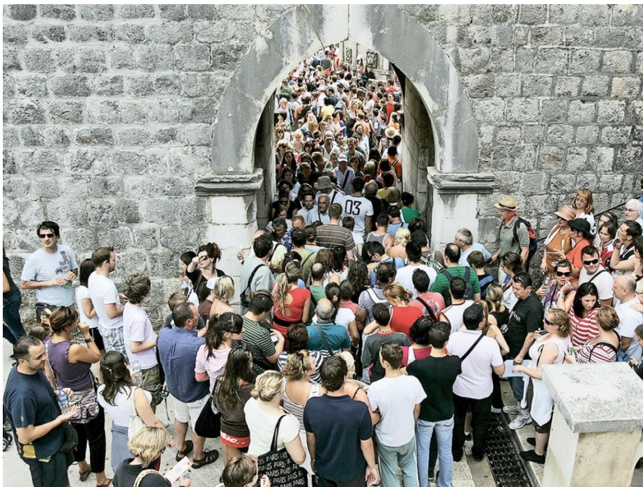
Sl.4. Turističke gužve na ulazu u staru jezgru grada Dubrovnika

kapacitetima ostvareno je 4 058 436 noćenja. Tradicionalno najviše turista dolazi iz Velike Britanije, a slijede turisti iz SAD-a i Njemačke. U 2018. godini 10% manje hrvatskih građana je posjetilo Dubrovnik. Gledano sa ekonomskog aspekta, stacionarni gosti troše 170 eura dnevno što je više u odnosu na druge destinacije u Hrvatskoj, dok posjetitelji s kruzera troše 59 eura (Dulist, 2019). Veliki problem za Dubrovnik jesu dnevne gužve koje su povećane i iznose i do 10 000 turista dnevno, a sve zbog velikog broja putnika koji dolaze s kruzera. Koliki problem su kruzeri stvarali Dubrovniku govori i činjenica da ga je UNESCO htio proglasiti ugroženom kulturnom baštinom. Stručnjaci iz UNESCO-a ograničili su broj dnevnih turista u gradskoj jezgri na 8 000, dok je gradska uprava taj broj još prepolovila (Jutarnji.hr, 2018). Također, takve mjere bi ponudile dugoročnu zaštitu toga područja iako bi nakratko ugrozile lokalno gospodarstvo i ekonomsku dobit. Ono što također izaziva neugodu je utjecaj te iste masovne posjećenosti na život i fizionomiju grada unutar same gradske jezgre. U povijesnoj jezgri Dubrovnika trenutno živi 1557 stanovnika, a trećina pripada starijoj populaciji i to katastrofalno demografsko stanje dovodi u pitanje opstanak Dubrovnika pod zaštitom UNESCO-a (Dubrovački vjesnik, 2017).