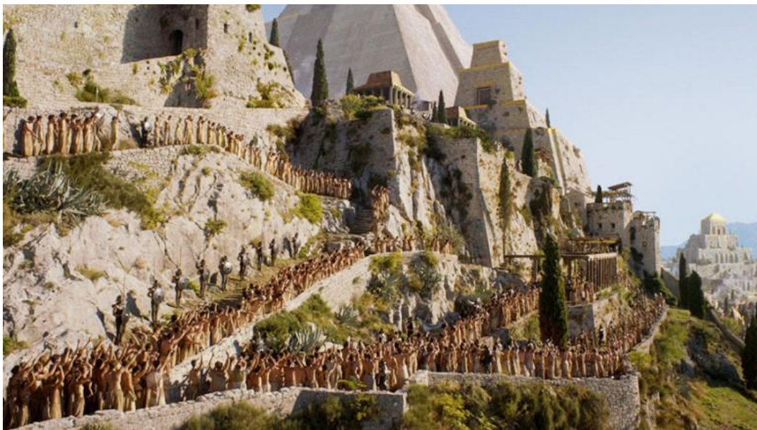
Sl.5. Snimanje serije "Igra prijestolja" na Klisu

izrazito atraktivnom obalnom smještaju, Split i okolica imaju mogućnost za razvoj različitih filmskih lokacija zbog čega često nosi nadimak "filmičan grad" (Slobodna Dalmacija, 2008). Lokacije u blizini Splita koje su poslužile za snimanje serije jesu: podrumske Dioklecijanove palače u samom centru grada koji su poslužili kao Zmajska tamnica, srednjovjekovna tvrđava Klis (sl. 5.) koja je poslužila kao mitski grad Mereen te predivni riječni kanjoni rijeke Žrnovnice, Kaštela te zaleđe parka prirode Biokovo novije su lokacije na kojima se snimala ova popularna serija (HotSpots, 2018).