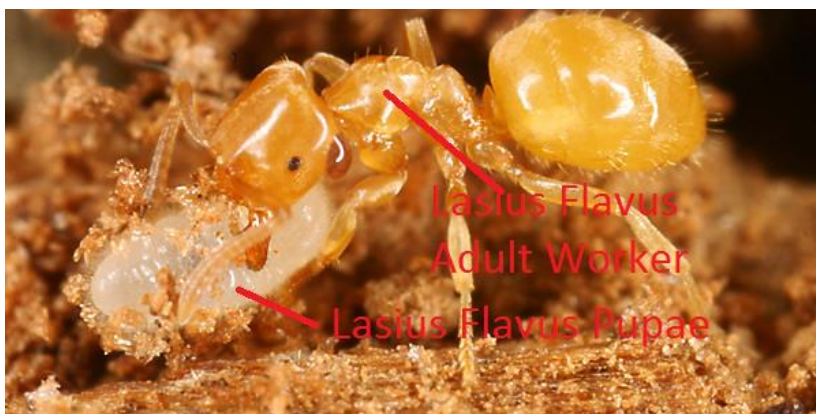
Slika 5. Odrasla jedinka - radnik (adult worker) koji nosi kukuljicu (pupae) vrste Lasius flavus (URL 4)

Osim kasta, razlikuju se i interkaste. To su kaste s vanjskim obilježjima i radnika i kraljice. Jedan od primjera je ergatoidna kraljica. Ergatoidne kraljice nemaju krila ali imaju jako dobro razvijen reproduktivni sustav. Bitno je napomenuti kako su ergatoidne kraljice vrlo rijetke u mravljim kolonijama te se pretpostavlja kako nemaju specifičnu ulogu u zajednici već obavljaju poslove radnika. Interkaste vrste Myrmica rubra imaju reducirane oči poput radnika, ali i reproduktivni sustav poput kraljica. Veličinom su veće od radnika no manje od kraljica. Ovakve interkaste su fenotipski različite od radnika no imaju istu ulogu. Javljaju se također i u vrsta Pristomyrmex punctatus (Smith, 1860) i Technomyrmex albipes (Smith, 1861) (Tribble i Kronauer 2017).