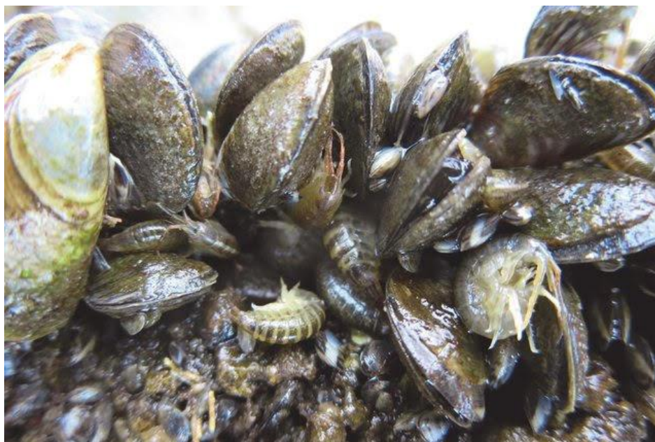
Slika 4. Dreissena rostriformis bugensis i Dikerogammarus villosus (preuzeto iz Meßner i Zettler 2015).

za drugu dolazi do njihovog nakupljanja u sustavima za navodnjavanje, elektranama, vodovodima, uređajima za pročišćavanje vode i slično (Cross i sur. 2011).