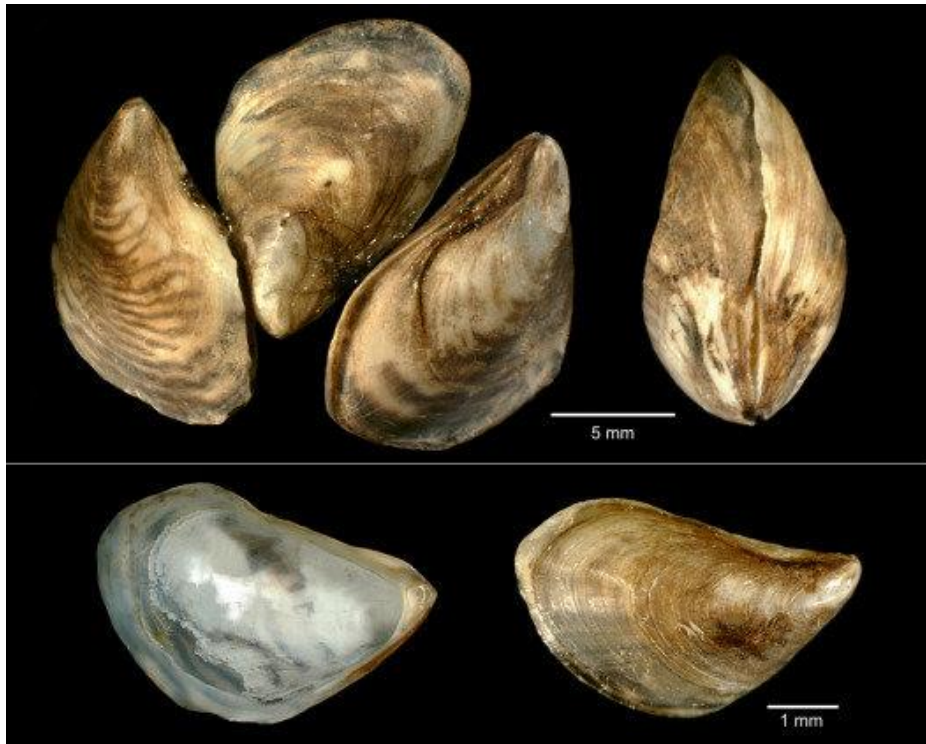
Slika 1. Vanjski izgled ljuštore školjkaša Dreissena rostrifomis bugensis (preuzeto iz Woźniczka i sur. 2016).

Podvrsta D. r. bugensis pripada aktivnim procjeđivačima što znači da samostalno proizvodi struju vode uz pomoć trepetljika na škragama te filtriranjem iz vodenog stupca uzima hranjive čestice (Habdija i sur. 2011). Sastavni izvor hrane čine čestice fitoplanktona, zooplanktona, detritusa i bakterije (Therriault i sur. 2013). U plaštanoj šupljini školjkaša smještene su škrge i stopalo, a plaštana šupljina zatvorena je plaštem koji obavija cijelo tijelo. Na stražnjoj strani plašta nalazi se veliki sifo ili tulajica (Slika 2) (Prié i Fruget 2017). Rod Dreissena pripada nadredu Eulamellibranchia čije škrge imaju brojne i opsežno razvijene tkivne spojeve (Habdija i sur. 2011). Pri različitim temperaturama dolazi do promjene brzine disanja kako bi se smanjila metabolička aktivnost te energija usmjerila na fizički rast (Therriault i sur. 2013).