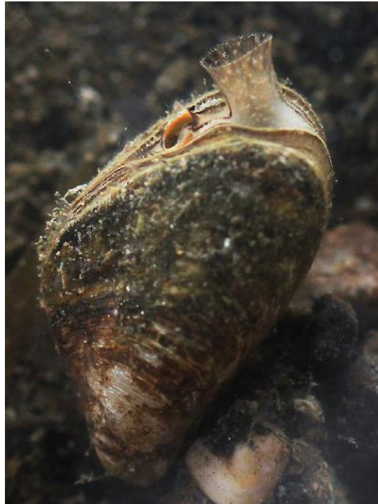
Slika 2. Izgled tulajice školjkaša Dreissena rostriformis bugensis (preuzeto iz Prié i Fruget 2017).