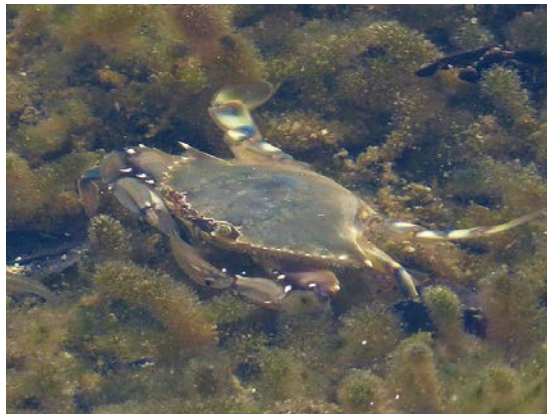
Slika 7: Morski rak Callinectes sapidus

Callinectes sapidus (slika 7), više poznat pod nazivom atlantski plavi rak ili samo plavi rak, vrsta je morskoga raka iz reda Decapoda . Kao i svi pripadnici svojega reda, C. sapidus posjeduje deset nogu koje su raspoređene u pet parova sa svake strane karapaksa. C. sapidus spada u skupinu plivajućih rakova koji se odlikuju time što im je zadnji par nogu preobražen u strukture slične veslima koje im pomažu pri plivanju (CABI 2020). Poput svih rakova, posjeduje čvrst egzoskelet koji se ponajviše sastoji od mineraliziranoga polisaharida hitina. Prednji par nogu je pak preobražen u kliješta ( chelae ), te ne služi za kretanje već za pridržavanje hrane. C. sapidus može se lako prepoznati po karakterističnom obliku i plavkastoj obojenosti po kojoj je vrsta i dobila ime. Vrškovi nogu i kliješta crvenkaste su ili ljubičaste boje. Karapaks je kod ove vrste iznimno širok, te je obično širine od 13 do 20 cm, ali zabilježeni su primjerci koji su imali karapaks širine i do 27 cm. C. sapidus je ekstremno eurihalina vrsta koja uglavnom živi u estuarijima do dubine od 35 metara. Preferira pješćana i muljevita dna. Iako je vrsta eurihalina, rast im ne ovisi toliko o slanoći morske vode koliko o temperaturi: optimalna temperatura je za rast mladih rakova 15°C. C. sapidus je predator i hrani se ponajviše školjkašima i koristi se svojim snažnim kliještima kako bi im otvorio ljušturu, ali mu se prehrana također sastoji i od biljnoga materijala i detritusa.