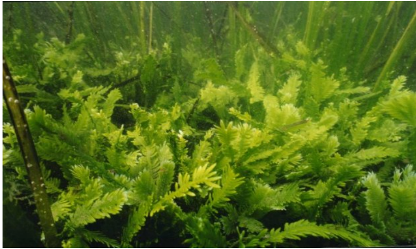
Slika 5: Morska alga Caulerpa taxifolia , preuzeto sa: https://commons.wikimedia.org/wiki/File:CaulerpaTaxifolia.jpg

koja su bogata nutrijentima, rezultirala je formiranjem homogeniziranih mikrostaništa na kojima su autohtone vrste istisnute ili veoma ugrožene.