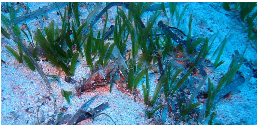
Slika 2: Morska cvjetnica Halophila stipulacea

Gotovo 60 vrsta morskih cvjetnica opisano je u morskim ekosustavima, a od njih samo su četiri vrste autohtone u Mediteranu, među kojima je i endemska vrsta Posidonia oceanica . Vrsta Halophila stipulacea (slika 2, Zenetos 2015) trenutno je jedina zabilježena invazivna vrsta morske trave u Sredozemnom moru (Hoffman 2014). Ta eurihalina vrsta uglavnom obitava na mekanim pješčanim ili muljevitim dnima na kojima formira guste pokrove, što čak može imati i pozitivan utjecaj na okoliš jer pridonosi stabilnosti sedimenta na morskom dnu (Katsanevakis i sur. 2014). Prirodno se može pronaći u tropskim i suptropskim morima Indijskog oceana, Perzijskoga zaljeva i Crvenoga mora. Plojke proizlaze iz nodija rizoma te su eliptičnog oblika, tamnozeleno boje i duljine do 6 cm. Internodiji su duljine između 7 i 50 mm.