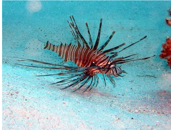
Slika 9: Morska riba Pterois miles