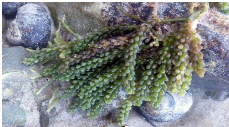
Slika 6: Morska alga Caulerpa cylindracea , preuzeto sa: https://www.gbif.org/occurrence/2813893503