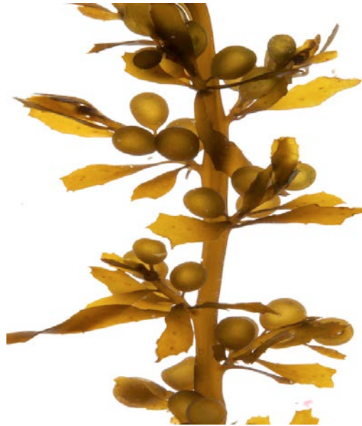
Slika 4: Morska alga Sargassum muticum