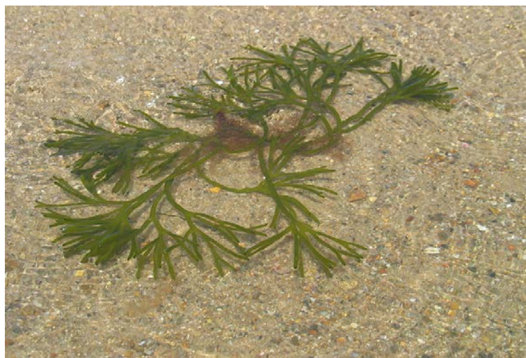
Slika 3: Morska alga Codium fragile

Codium fragile (slika 3, Zenetos 2015), poznata u engleskom govornom području pod kolokvijalnim nazivom mrtvačevi prsti ( dead man's fingers ), vrsta je bentoske morske zelene alge. Prepoznatljiva je po svojoj tamnozelenoj boji i zamjetnoj duljini; ta vrsta alge može doseći duljinu od jednoga metra. Površinu talusa prekrivaju zavijeni filamenti. Opisano je šest podvrsta te vrste, a za tri se smatra da su invazivne. Može se razmnožavati nespolno fragmentacijom. To je proces pri kojemu se odrasla jedinka dijeli na više fragmenata od kojih će se svaki razviti u zasebnu jedinku. C. fragile također se može razmnožavati partenogenetskim gametama koje imaju sposobnost razvitka u odrasli organizam bez oplodnje. Tijekom hladnijih perioda godine razmnožavanje se uglavnom odvija fragmentacijom zbog nižih temperatura koje uzrokuju kontrakciju i segmentaciju talusa.