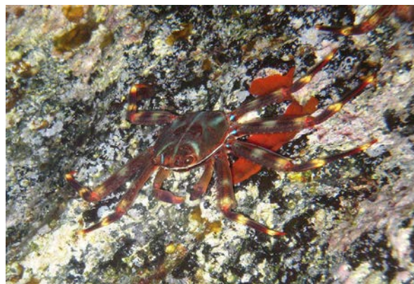
Slika 8: Morski rak Percnon gibbesi

Kao i C. sapidus , Percnon gibbesi (slika 8, Zenetos 2015) vrsta je raka iz reda Decapoda te stoga ima slične karakteristike kao i prethodna vrsta, ali za razliku od nje P. gibbesi nije plivajući rak pa nema preobraženi zadnji par nogu. Karapaks te vrste raka tanak je i diskoidan. P. gibbesi relativno je malena vrsta raka kojoj karapaks rijetko prelazi duljinu od tri centimetra, ali noge su dugačke u odnosu na veličinu tijela (Zenetos 2015). Primarno je smeđe boje koja služi za kamuflažu na stijenkama na kojima ovaj rak živi, a na zglobovima nogu nalaze se žućkasti krugovi. P. gibbesi hrani se oportunistički, a prehrana mu se pretežno sastoji od raznih vrsta algi na kamenitim infralitoralnim obalama.