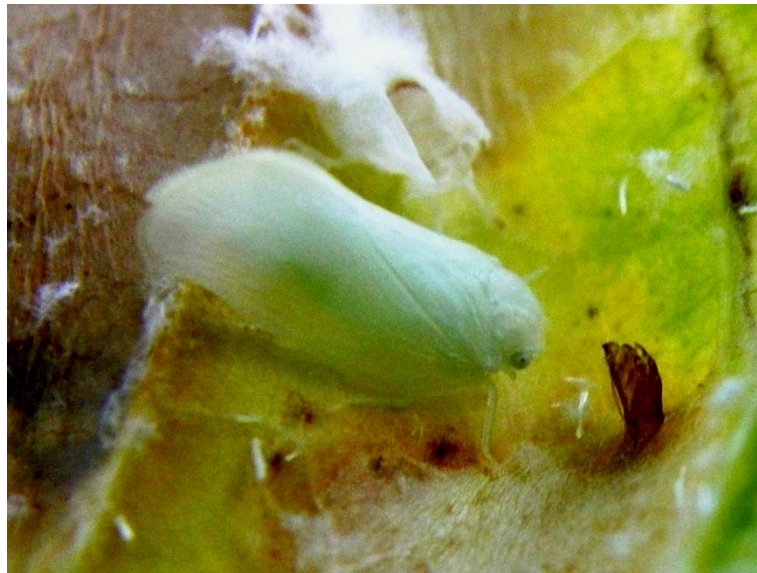
Slika 14 Mladi imago medećeg cvrčka

Medeći cvrčak siše na listu i stabljici biljke domaćina zbog čega biljka slabije raste. Mednu rosu koju cvrčak izlučuje mogu nastaniti biljke čađavice i time smanjiti asimilacijsku površinu (Gotlin Čuljak i sur. 2007). Vrsta je izrazito polifagna te ju nalazimo na agrumima, vinovoj lozi, ukrasnom drvenastom bilju i šumskom drveću (Matošević i Pernek 2011).