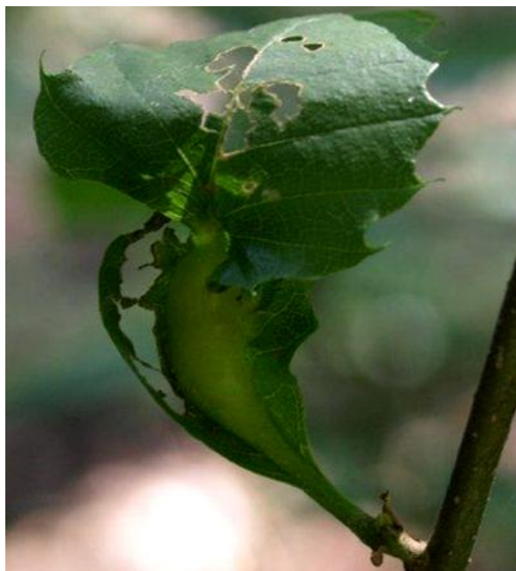
Slika 15 Šiška kestenove ose šiškariće na listu kestena

Domaćini ove vrste su japanski kesten ( Castanea crenatata Siebold & Zucc), američki kesten ( Castanea dentata (Marsh.) Borgh), kineski kesten ( Castanea mollissima Blume) i europski pitomi kesten (EPPO 2005) koji je ujedno i jedina vrsta domaćin u Hrvatskoj (Matošević i sur. 2010).