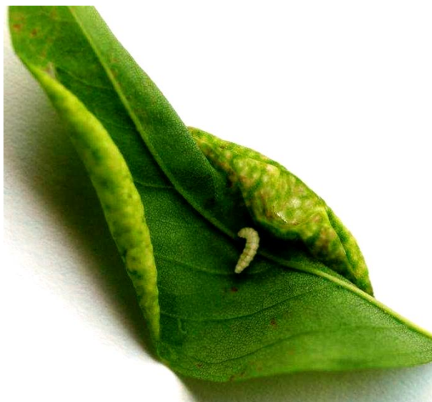
Slika 11 Šiške i ličinka bagremove muhe šiškariće na palistiću bagrema

Ličinke konzumacijom lista uzrokuju zadebljanje listova i njihovo uvijanje. Veći broj šiški može uzrokovati smanjenje asimilacijske površine i njegovo prerano otpadanje što utječe na vitalnost i estetski izgled bagrema. Iako se u Europi smatra invazivnim kukcem štetnost joj se razlikuje od zemlje do zemlje. Tako se u Mađarskoj smatra opasnim štetnikom, dok je u Hrvatskoj opasna jedino u smislu narušavanja estetske vrijednosti bagrema u urbanim područjima (Pernek i Matošević 2009).