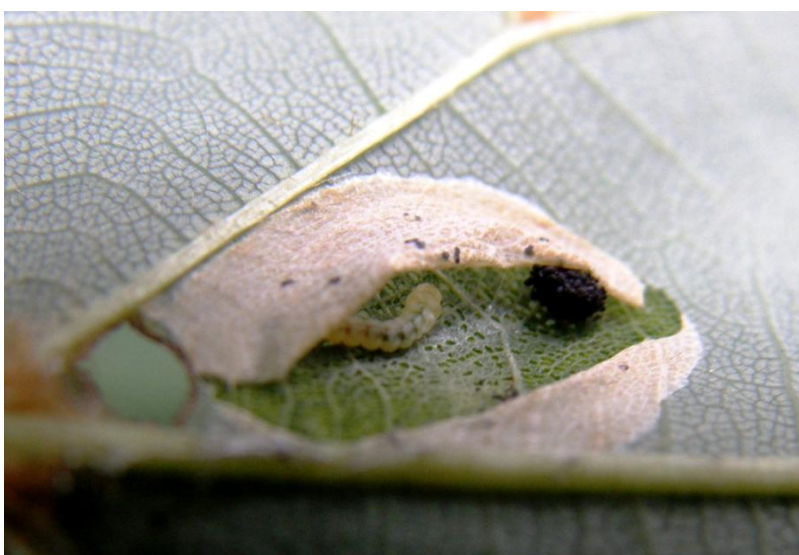
Slika 9 Mina s gusjenicom lipinog moljca minera

Lipin moljac miner vrsta je lisnog минера iz porodice Gracillariidae, potporodice Lithocolletinae opisana na otoku Hokaidu u Japanu, ali je poslije nađena i na drugim otocima Japana, u Koreji i istočnom dijelu Kine. Domaćini su joj vrste iz roda Tilia . U Europi su to uglavnom sitnolisna lipa, velelisna lipa ( T. platyphyllos Scop.) i T. x euchlora .