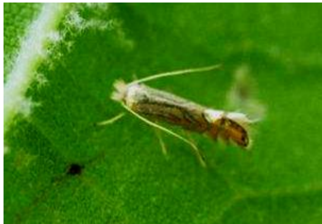
Slika 2 Imago plataninog moljca minera

Platanin moljac miner (Slika 2), vrsta je lisnog минера iz porodice Gracillariidae autohtona za područje Balkana i zapadne Azije. Područje prirodnog rasprostranjenja ove vrste poklapa se s rasprostranjenjem primarne biljke domaćina azijske platane ( Platanus orientalis L.). Pretpostavlja se da je širenje ove vrste Europom započelo sedamdesetih godina 20. stoljeća. U Europi su joj domaćini vrste roda Platanus , uglavnom Platanus x hybrida Brot. koja se često sadi u urbanim područjima (Šefrová 2001a).