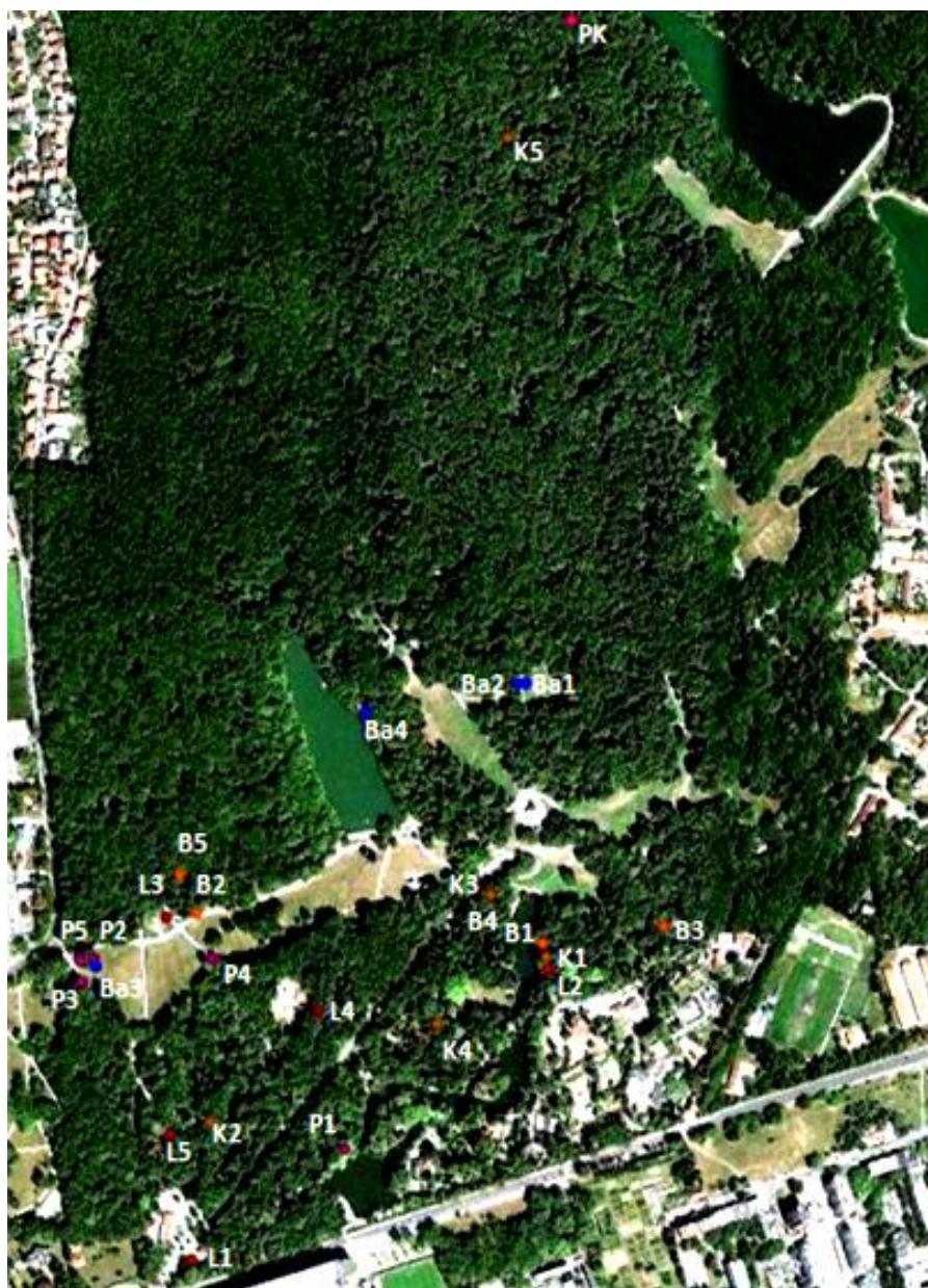
Slika 1 Smještaj praćenih lokacija na području parka Maksimir (GOOGLE EARTH 2012)

Istraživanje faune stranih biljojednih kukaca na drvenastom bilju provedeno je na području parka Maksimir. Kako su ove vrste kukaca pretežito monofagne nije bilo bitno ujednačeno pokriti cijelo područje parka pa sam lokalitete na kojima sam pratila vrste odabrala slučajno, unutar vrsta domaćina. Na karti (Slika 1) je prikazan smještaj pojedinih lokacija koje su pobliže opisane u tablici (Tablica 2).