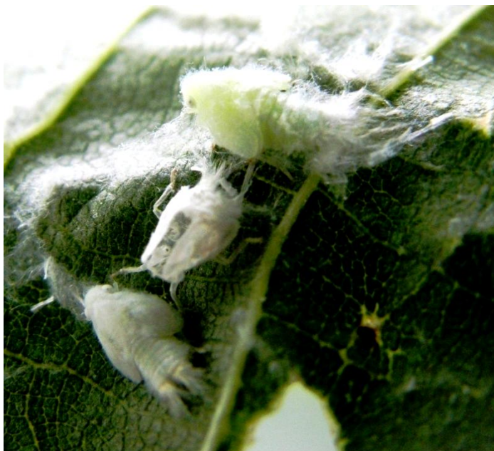
Slika 13 Ličinke medećeg cvrčka

Vrsta ima jednu generaciju godišnje, a prezimljuje u stadiju jajašaca u pupovima ili pukotinama na kori drveća ili čokota. U drugoj polovici svibnja se pojavljuju ličinke koje imaju pet razvojnih stadija. Ličinke (Slika 13) se hrane u vršnom dijelu bilja, a odrasle jedinice (Slika 14) se pojavljuju u srpnju. Pare se noću i polažu oko 60 oplođenih jaja. Odrasle jedinice grupiraju se na biljci u kolone (Gotlin Čuljak i sur. 2007).