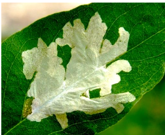
Slika 11 Mina ličinke bagremovog moljca minera na listu bagrema

Bagremov moljac miner vrsta je lisnog минера koja se hrani na bagremu i autohtona je za područje Sjeverne Amerike. U Europi je prvi put zabilježena u Italiji 1970. godine, a do danas je nađena u Italiji, Sloveniji, Hrvatskoj, Austriji, Slovačkoj, Mađarskoj i Rumunjskoj (Melika i sur. 2004). Na području današnje Hrvatske je zabilježen 1983. godine u blizini Zagreba (Maceljski i Igrc 1983).