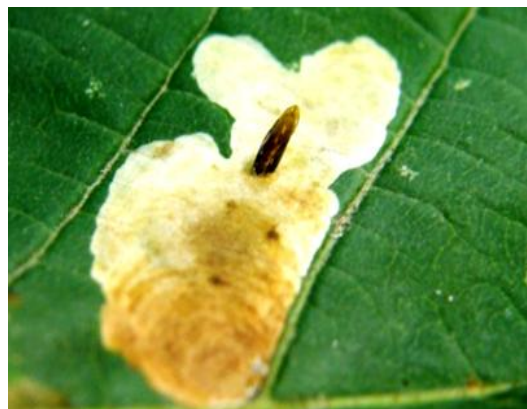
Slika 7 Kukuljica kestenovog moljca minera

Broj generacija tijekom jedne vegetacijske sezone se razlikuje ovisno o dijelu Europe. Može razviti tri, četiri pa i pet generacija godišnje. U Hrvatskoj vrsta razvija četiri, a rjeđe tri generacije godišnje (Mešić i sur. 2010). Životni ciklus vrste isti je bez obzira na broj generacija. Kestenov moljac miner prezimljava u stadiju kukuljice. Iz kukuljica se u proljeće razvijaju odrasli leptiri. Ženke nakon kopulacije odlažu jaja na listove biljke domaćina divljeg kestena. Gusjenica (Slika 6) ima šest stadija i hrani se palisadnim parenhimom (Šefrová 2001 b) stvarajući tako gornjopovršinske mine na lišću kestena (Matošević 2007 a). Nakon što se gusjenica zakukulji (Slika 7) razvoj jedne generacije je završen. Odrasli leptiri prve generacije pojavljuju se od druge polovine travnja do početka srpnja, leptiri druge generacije od prve polovine lipnja do prve polovine srpnja, leptiri treće generacije od druge polovine srpnja do kraja