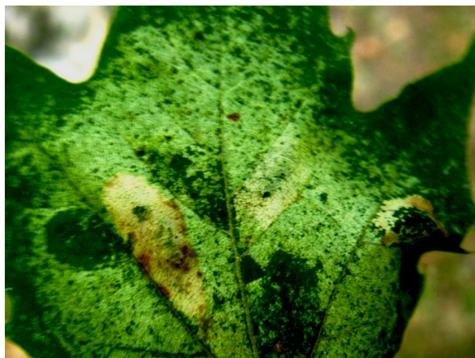
Slika 5 Kloroze uzrokovane napadom platanine mrežaste stjenice na listu platane

Nakon parenja ženke polažu jajašca duž provodnih žila s donje strane listova platane, jedan ili više parova po listu. Jedna ženka može položiti nekoliko stotina jajašaca. Postoji pet ličinačkih stadija, a jedan životni ciklus traje od 43 do 45 dana. Postoji više generacija godišnje, a stjenice prezimljuju u odraslom stadiju ispod kore drveća ili u pukotinama (Wade 1917). Rasprostranjuju se uglavnom zračnim strujama i ljudskom aktivnošću na veće udaljenosti (Maceljki 1986).