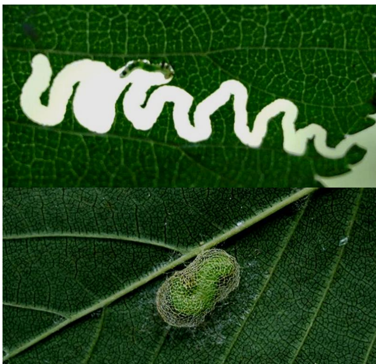
Slika 8 Ličinka brijestove ose listarice i karakteristični cik cak tragovi na listu (gore) i ličinka u kokonu (dolje)

Brijestova osa listarica vrsta je autohtona za područje Japana gdje je i prvi put opisana. U Europi je prvi put zabilježena 2003. godine u Mađarskoj i Poljskoj, a nakon toga i u Austriji, Slovačkoj, Rumunjskoj i Ukrajini (Blank i sur. 2010), Srbiji, Moldaviji i Italiji (Zandigiacomo i sur. 2011), a 2011. je nađena i u Hrvatskoj (Matošević 2012). Monofagna je vrsta koja se hrani lišćem brijesta. U Europi su joj biljke domaćini uglavnom gorski brijest, poljski brijest, sibirski brijest ( Ulmus pumila L.) i turkestarski brijest ( Ulmus pumila L. var. arborea Litv.), dok su to u Japanu Ulmus japonica (Rehder) Sarg. i sibirski brijest (Blank i sur. 2010).