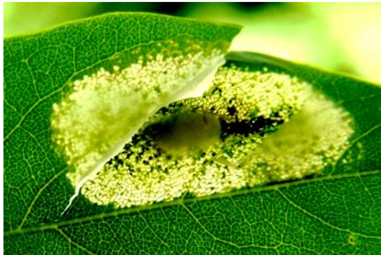
Slika 10 Mina moljca vrećastih mina bagrema s kokonom

Moljac vrećastih mina bagrema vrsta je porijeklom iz Sjeverne Amerike, isto kao i njena biljka domaćin, bagrem. U Europi je prvi put zabilježena Švicarskoj 1983. godine, a do danas je zabilježena u Italiji, Francuskoj, Njemačkoj, Nizozemskoj, Poljskoj, Češkoj, Slovačkoj, Austriji, Mađarskoj (Šefrová 2001 c), u Bosni i Hercegovini 1999. (Dimić i sur. 2000), a u Hrvatskoj 2001. godine (Maceljski i Mešić 2001). Vrsta je u Europu unesena u minama na lišću sadnica bagrema ili putem sjemena bagrema. Sjeme bagrema skuplja se zajedno s česticama tla i može biti kontaminirano kukuljicama štetnika. U Europi se širi letom pomoću vjetra (Maceljski i Mešić 2001).