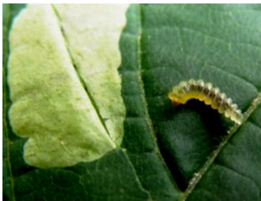
Slika 6 Ličinka kestenovog moljca minera

Kestenov moljac miner jedina je europska vrsta lisnog minera iz roda Cameraria . Prvi put je zabilježena kod Ohridskog jezera u Makedoniji 1984. godine (Simova-Tošić i Filev 1985), a kao novu vrstu opisali su je 1986. godine Deschka i Dimić (1986). Od tada pa do danas vrsta se proširila gotovo po cijeloj Europi, osim većeg dijela sjeverne Europe, Ukrajine i zapadne Rusije (DAISIE 2006). U Hrvatskoj je prvi put zabilježena 1989. godine (Maceljski i Bertić 1995), a danas se smatra najznačajnijim štetnikom gradskog zelenila u Hrvatskoj (Mešić i sur. 2008).