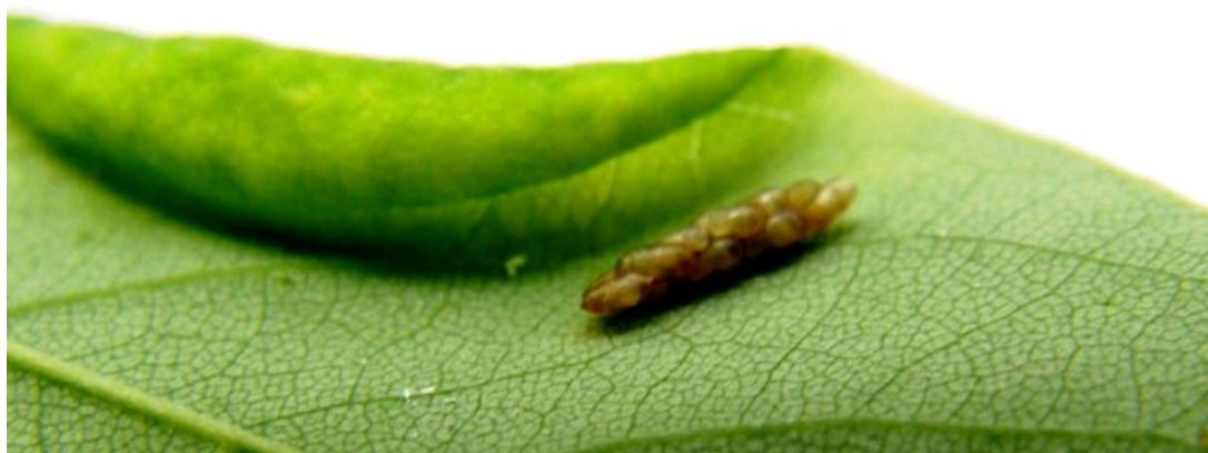
Slika 12 Kukuljica parazitoida Platygaster robiniae

Ličinke konzumacijom lista uzrokuju zadebljanje listova i njihovo uvijanje. Veći broj šiški može uzrokovati smanjenje asimilacijske površine i njegovo prerano otpadanje što utječe na vitalnost i estetski izgled bagrema. Iako se u Europi smatra invazivnim kukcem štetnost joj se razlikuje od zemlje do zemlje. Tako se u Mađarskoj smatra opasnim štetnikom, dok je u Hrvatskoj opasna jedino u smislu narušavanja estetske vrijednosti bagrema u urbanim područjima (Pernek i Matošević 2009).