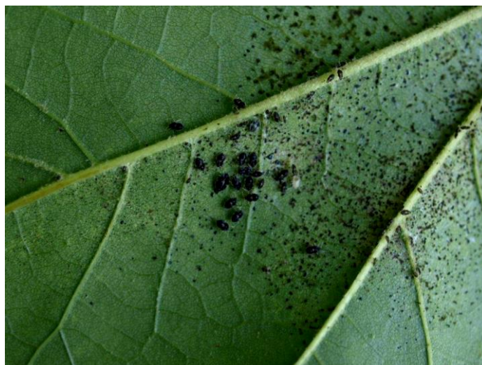
Slika 4 Platanina mrežasta stjenica

Platanina mrežasta stjenica vrsta je stjenice iz reda Hemiptera i porodice Tingidae autohtona za područje Sjeverne Amerike. U Europi je prvi put otkrivena 1964. u blizini Padove nakon čega se proširila većinom zemalja južne i središnje Europe. Hrani se na vrstama roda Platanus , osobito američkoj platani ( Platanus occidentalis L.) sišući biljne sokove iz lista što je vidljivo na listu u obliku bijelih točkica, a može prerasti u veće kloroze (Slika 5) i uzrokovati prerano otpadanje listova, a i smrt drveća ukoliko su napadi dugotrajni i postoje još neki stresni uvjeti kao suše i slično (Halbert i Meeker 1998). Na listu platane se s donje strane mogu naći ličinke i imaga stjenica te crne kuglice izmeta kao što se vidi na (Slika 4). Pretpostavlja se da osim izravne štete može biti vektor prijenosa opasnih gljivičnih oboljenja platana (Maceljski 1986).