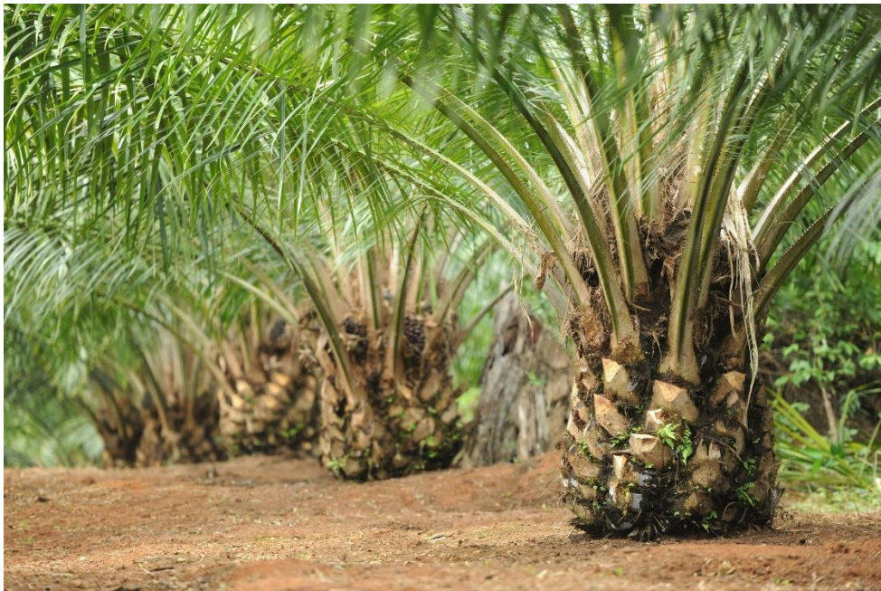
Slika 17. Elaeis guineensis Jacq. (uljana palma)

Afrička uljana palma (slika 17.) je klasična višenamjenska vrsta, za razliku od plantažnih palmi od kojih se uglavnom dobija samo palmino ulje. Industrija uljane palme stvara obilnu količinu raznih vlakana iz listova i debla (Salem i sur., 2020). Vlakna također treba očistiti od masnih i prljavih materijala, a neki od nusproizvoda izolacije vlakana, posebno kolač od palminog zrna i listova uljane palme, koriste se za prehranu goveda, ovaca i koza. Glavna komponenta vlakna je celuloza, ali sadrže i velike količine lignina. Vlakna su vrlo porozna i imaju presjek sličan lakuni, a njihovi promjeri uvelike variraju (Kumar i sur., 2015). Svi ovi čimbenici utječu na mehanička svojstva vlakana kao što je velika žilavost, ali ipak slabija čvrstoća od većine ostalih biljnih vlakana.