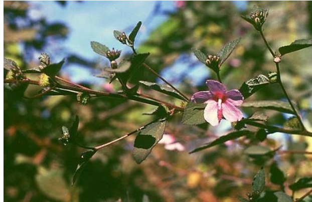
Slika 9. Urena lobata L. (Ceaserweed)

Najbolje uspijeva u vrućoj, vlažnoj klimi, s izravnom sunčevom svjetlošću i bogatim, dobro prorahljenim tlom. Nalazi se samoniklo u tropskim i umjerenim zonama Sjeverne i Južne Amerike te u Aziji, Indoneziji, Filipinima i Africi (Kumar i sur., 2015). Uzgajani usjevi, obično uzgajani kao jednogodišnje kulture, nalaze se uglavnom u slivu Konga i Srednjoj Africi, s manjim sadnjama u Brazilu, Indiji i Madagaskaru. Biljka daje vlakno visoke kvalitete. Stabljike biljaka režu se ručno, iznad drvenaste biljne baze.