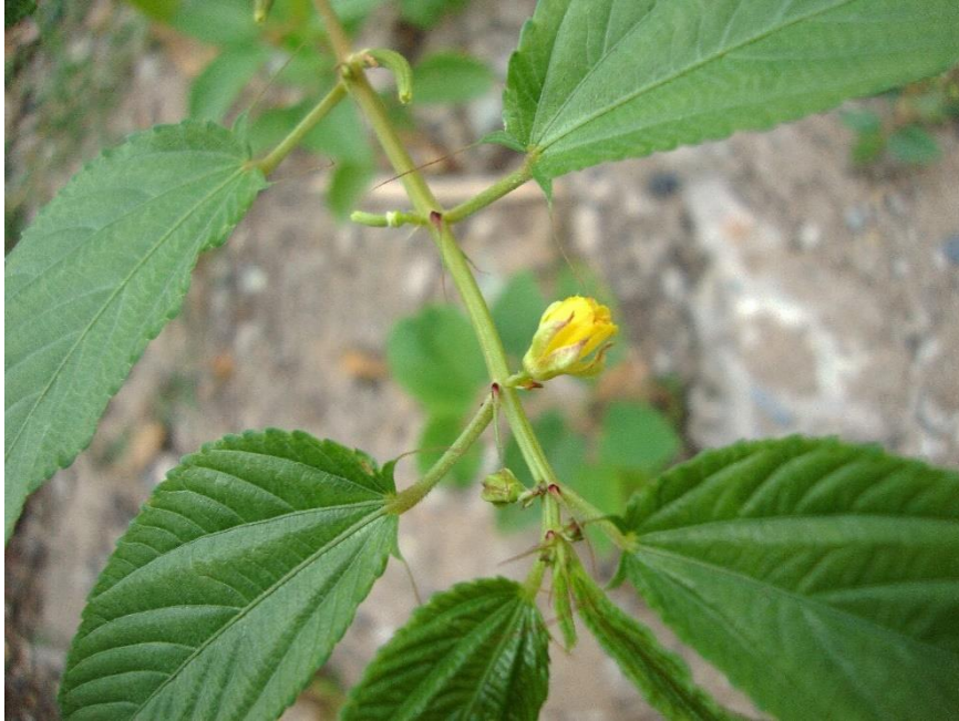
Slika 5. Corchorus capsularis L. (bijela juta)

Jutina svilenkasta tekstura, njena biorazgradivost i otpornost na toplinu i vatru čine je prikladnom za uporabu u raznolikim industrijama za primjerice izradu namještaja, tepiha i ostalih podnih obloga. Sada se jutu sve više doživljava ne samo kao glavno tekstilno vlakno, već i kao sirovinu za netekstilne proizvode (Mohanty i sur., 2005). Vlakna od jute prikladna su kao ojačanje za pregrade, obloge, spuštene stropove i ostali namještaj. Izvedena su opsežna ispitivanja za proizvodnju kompozita od jute / epoksida, jute / poliestera i jute / fenola-formaldehida, kao što su jeftini materijali za stanovanje, silosi za skladištenje žitarica i mali ribarski brodovi (Friedrich i Breuer, 2015).