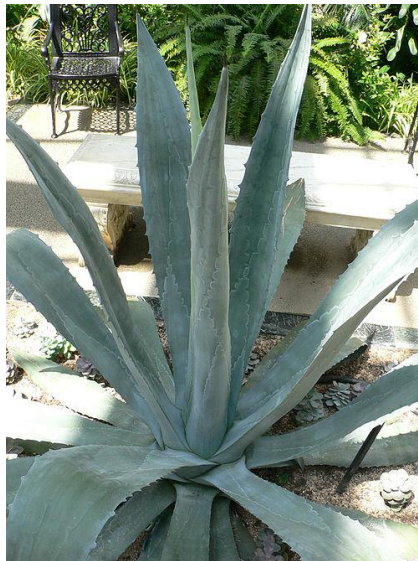
Slika 14. Agave cantala (Haw.) Roxb. ex Salm-Dyck. (kantala)

Kantala ili cantala (slika 14.) je tropska biljka iz porodice Asparagaceae s lišćem u obliku koplja koji izrasta izravno iz peteljke oblikujući gustu rozetu biljka. Debeli sivo-zeleni listovi obrubljeni su oštrim zubima mogu doseći oko 2 metra visine. Biljka je monokarpična, što znači da umire nakon cvatnje, a cvjetovi se nalaze na velikoj stabljici koja može biti viša od 8 metara.