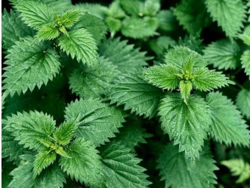
Slika 7. Urtica dioica L. (kopriva)