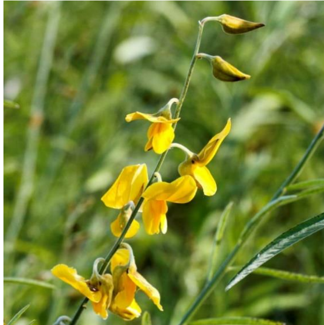
Slika 11. Crotalaria juncea L. (sun)

ulošci (Rana i sur., 2014). U mnogim tropskim zemljama također se uzgaja i kao usjev zelenog gnojiva koji se ore pod gnojidbu tla.