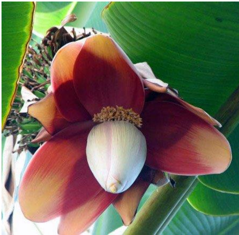
Slika 12. Musa textilis L. (abaka), cvijet

Biljka abaka (obično poznata kao Manila konoplja), srodnica banane, raste do visine od 3 do 4 m. Porijeklom je s Filipina, ali je također nalazimo i u Indoneziji te Srednjoj i Južnoj Americi (Mohanty i sur., 2002). Filipini su najveći svjetski dobavljač vlakana i proizvoda od abake (slika 12.).