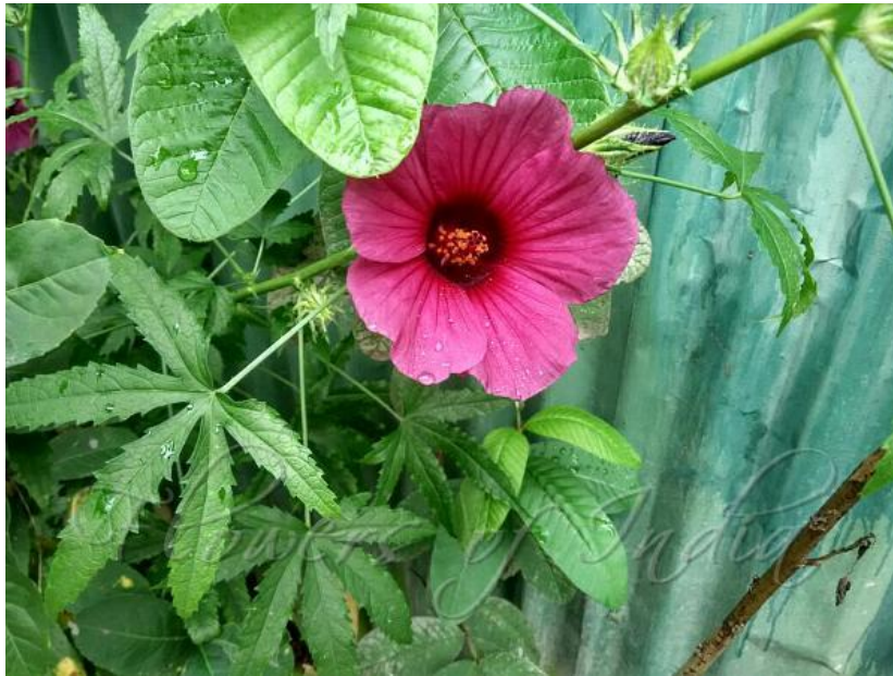
Slika 10. Hibiscus cannabinus L. (kenaf)

teško obraditi. Imaju otpornu čvrstoću sličnu niskokvalitetnoj juti i slaba su samo kad su mokra (Mohanty i sur., 2005).