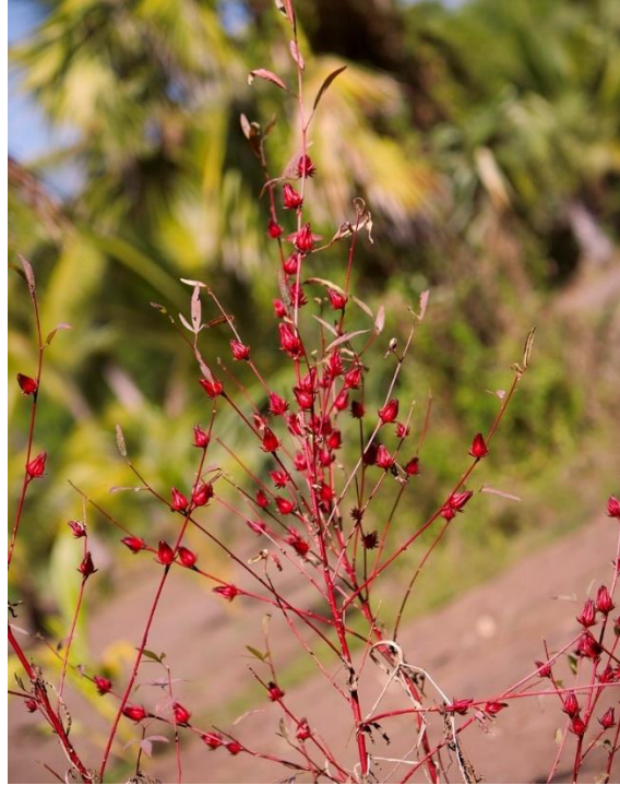
Slika 8. Hibiscus sabdariffa L. (Roselle)

Vlakna Roselle su sjajna, boja je u spektru od kremaste do srebrno bijele i umjereno su izražene. Koristi se, često u kombinaciji s jutom, za pakiranje tkanina i konopa, a glavni proizvođači ovih vlakana su Indija, Java i Filipini.