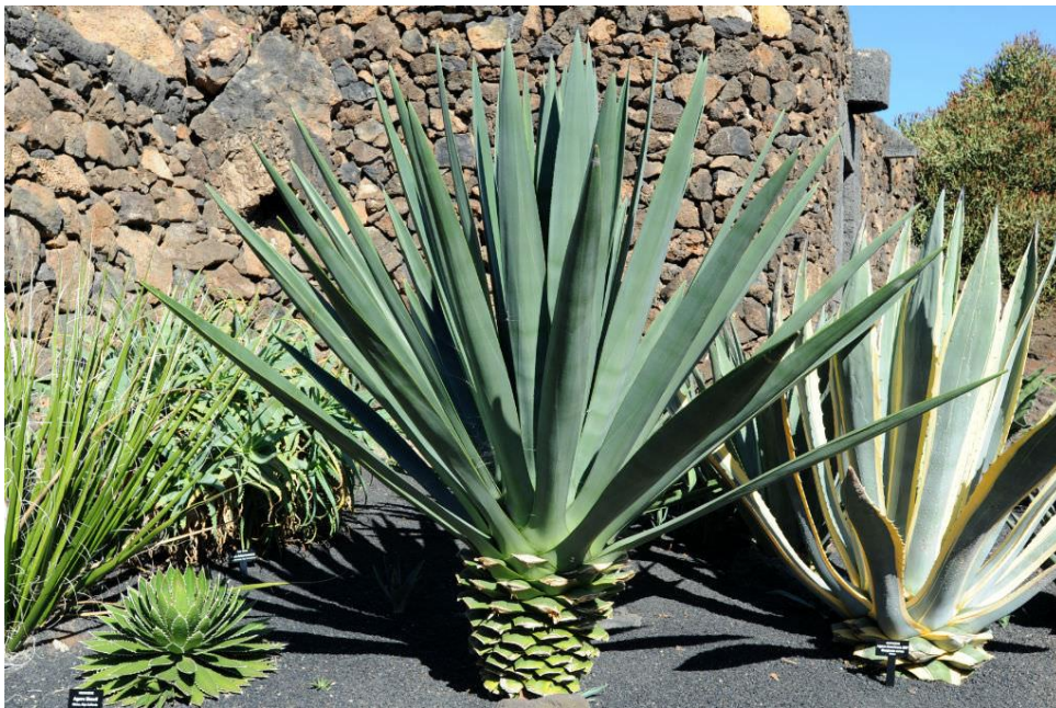
Slika 15. Agave fourcroydes Lem. (heneken)

Heneken ili henequen (slika 15.) bliki je srodnik sisala, a vlakna izolirana iz dugih kopljastih listova sastoje se od približno 60% celuloze, 25% hemiceluloze, 8% lignina i 2% voska (Arsene i sur., 2013). Uobičajeno se koriste u proizvodnji tekstilnih proizvoda, a već su ga Maya indijanci koristili za izradu kanapa, visećih mreža, odjeće i prostirki. Danas je industrija henekena (kao i sisala) koncentrirana u tropskim regijama Afrike, Srednje i Južne Amerike i Azije (posebno Kine) (Mohanty i sur., 2002). Usjevi se zbog vlakana uzgajaju u nekim od najsiromašnijih područja svijeta te je u mnogim slučajevima na tim područjima njihova proizvodnja jedini izvor prihoda i gospodarske aktivnosti. Stoga uzgoj henekena za vlakna može znatno pridonijeti naporima da se smanji siromaštvo i osigura ruralno zapošljavanje.