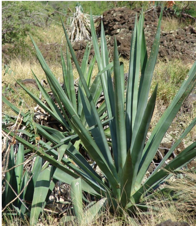
Slika 13. Agave sisalana L. (sisal)

Sisal (slika 13.) je porijeklom iz Meksika i Srednje Amerike, te su njena vlakna izolirana iz listova ondje koristili još i narodi Maye i Azteca za proizvodnju sirovih tkanina. Danas se široko uzgaja u tropskim zemljama Afrike, Zapadne Indije i Dalekog istoka. Biljka naraste do visine od oko 2 metra, a vlakna se ekstrahiraju iz svježeg lišća, zatim se isperu i osuše na suncu (Jarman i sur., 1978). Strojevi uklanjaju tkivo lista drobljenjem, struganjem i pranjem.