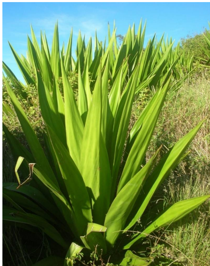
Slika 18 Mauricijska konoplja ( Furcraea foetida (L.) Haw.)

Mauricijska konoplja ( Furcraea foetida (L.) Haw.), portugalska piteira ili francuska aloja, unatoč imenu, nije prava konoplja (Latif i sur., 2019) nit potječe s Mauricijusa. Porijeklom je iz Brazila, gdje je komercijalna proizvodnja vlakana započela oko 1875. godine (Kumar i sur., 2015), na Mauricijus je uvezena krajem 18. stoljeća, a uzgoj je uspostavljen u istočnoj Africi, na Cejlonu (danas Šri Lanka) i na Svetoj Heleni koncem 19. stoljeća. Njena lisna vlakna koriste se za izradu vreća i drugih grubih tkanina, a ponekad se miješaju s drugim biljnim vlaknima kako bi im se poboljšala svojstva. Biljka se na nekim mjestima uzgaja kao ukras.