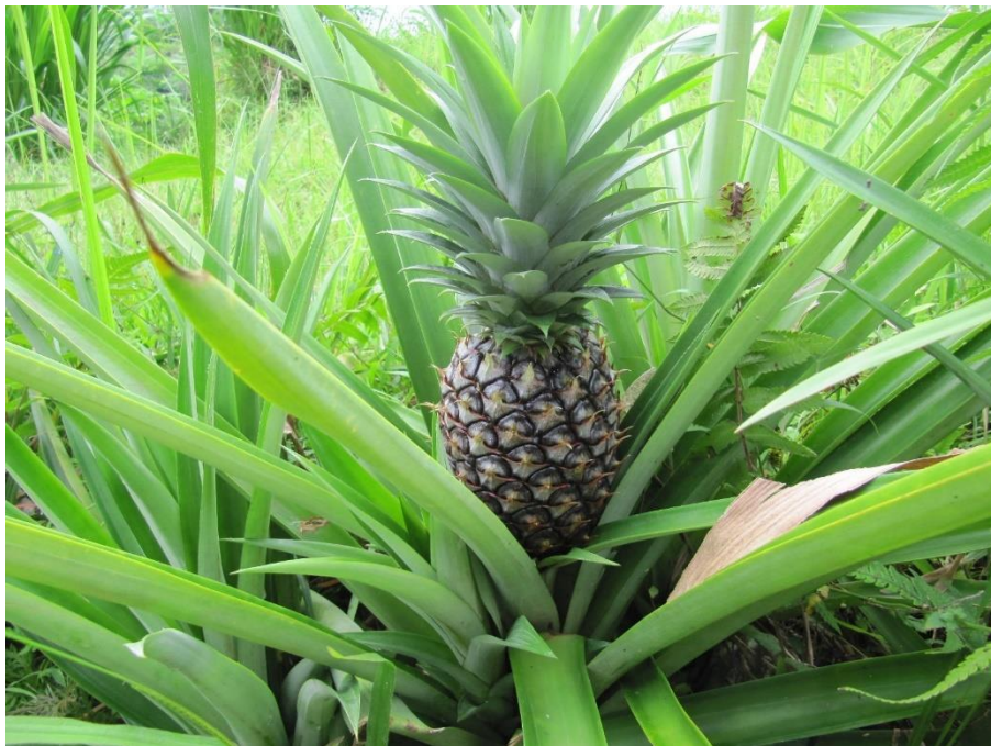
Slika 16. Anannus comosus (L.) Merr s plodom

Ananas se uzgaja u tropskim zemljama obično zbog konzumacije (slika 16.). Usjev ananasa ima vrlo kratku stabljiku koja prvo stvara rozetu od vlaknastih listova. Listovi su dugi oko 90 cm, široki od 5 do 7,5 cm i u obliku mača, tamnozeleno boje, a na rubovima nose bodlje (Arsene i sur., 2013). Od njih se mogu odvojiti jaka, bijela i svilenkasta vlakna. Vlakna ananasa (PALF) dobivaju se iz lišća biljke ananas (Latif i sur., 2019), a zbog nedostatka znanja o njihovoj ekonomskoj upotrebi ova vlakna nedovoljno su industrijski iskorištena. Tradicionalno se PALF koristi za proizvodnju tkanina, tepiha i zavjesa. PALF je višestanično vlakno koje se uglavnom sastoji od celuloze (70 –82%), polisaharida i lignina. Mekinje ananasa su voćni ostaci od pravljenja soka, sadrže puno vitamina A i koriste se u hrani za stoku.