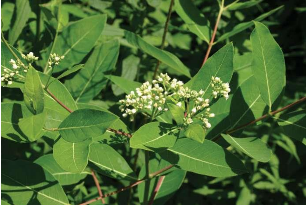
Slika 4. Apocynum cannabinum L. (indijska konoplja)