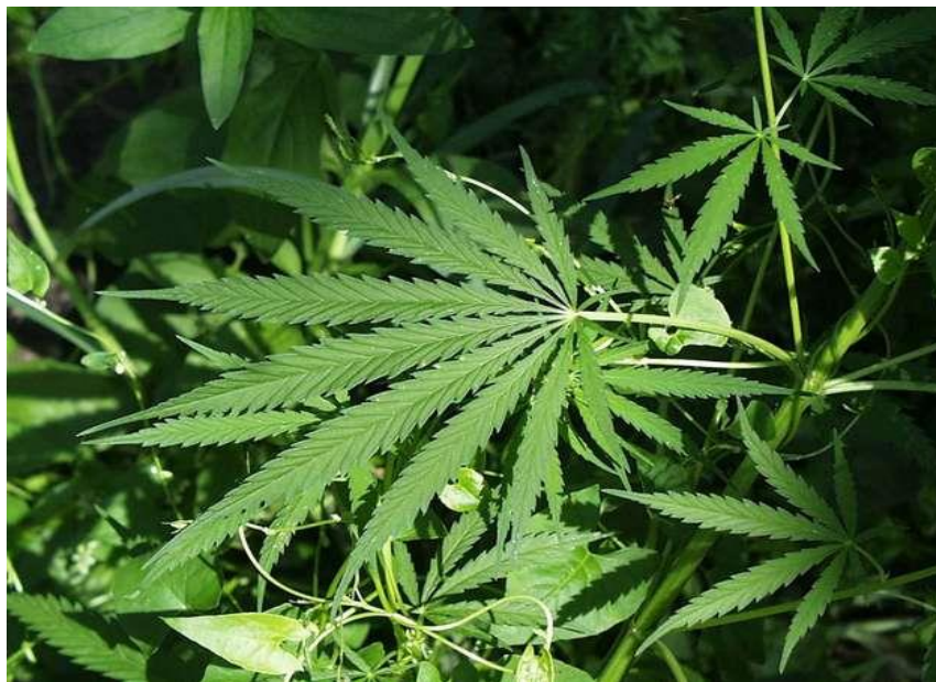
Slika 3. Cannabis sativa L. (uzgojena konoplja)

Uzgojena konoplja (Slika 3.) je još jedna biljka poznata po kvalitetnim vlaknima iako će svima prva asocijacija biti opojni \Delta 9-tetrahidrokanabinol (THC, aditerpen koji sadrži hidroksilnu funkcionalnu skupinu) sadržan u smoli cvjetova. Industrijska konoplja ne može se koristiti kao opojna droga jer gotovo ne proizvodi THC (manje od 1%), dok sorte „marihuane“ proizvode između 3 i 20% THC-a (Mohanty i sur, 2005) te je njihov uzgoj kao i posjedovanje u većini država zabranjeno. Svi kultivari uzgojene konoplje sadrže likova vlakna primjerena za dobivanje tekstila.