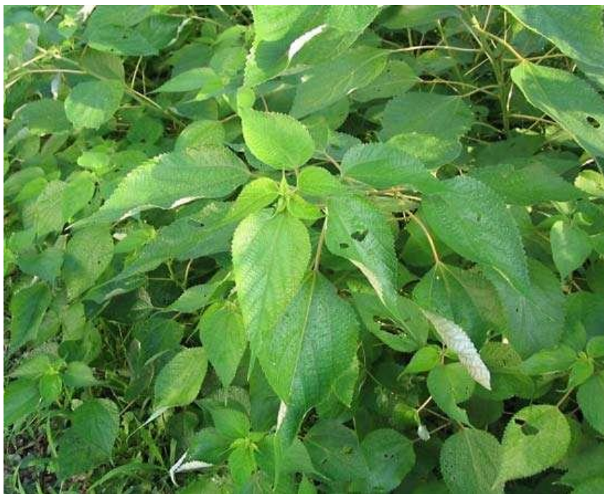
Slika 6. Boehmeria sp. Jacq. (ramija)

Vlakna ramije stoljećima se koriste kao tekstilna vlakna zbog svojih izvrsnih karakteristika. Ramijina vlakna vrlo su fina i poput svile, prirodno bijele boje i visokog sjaj. Ostale prednosti vlakna ramije su dobra otpornost na bakterije, plijesan i napad insekata. Vlakna su stabilna u alkalnim prilikama i ne oštećuju ih blage kiseline (Arsene i sur., 2013). Vlakna imaju izuzetnu čvrstoću koja se čak i lagano povećava kad su mokra. Zbog izvrsnih svojstava vlakana, vlakna ramije imaju veliki potencijal kao ojačavajuća vlakna za polimerne kompozite.