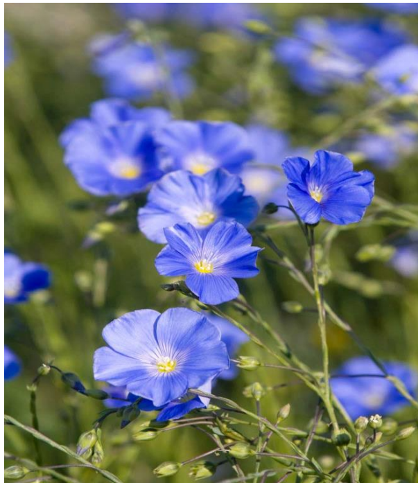
Slika 2. Cvijet lana ( Linum usitatissimum L.)

Lan (Slika. 2) se uzgaja gotovo 10 000 godina, a njegova su vlakna, tj. platno, najstariji poznati tekstil koji datira još iz davnih mezopotamskih vremena, a osim tekstila, tisućljećima je pružao i druge veoma važne proizvode poput ulja, papira i celuloze. Danas se tekstilni lan primarno uzgaja u Europi, Argentini, Indiji, Kini i državama bivšeg Sovjetskog Saveza te najbolje uspijeva u umjerenim predjelima.