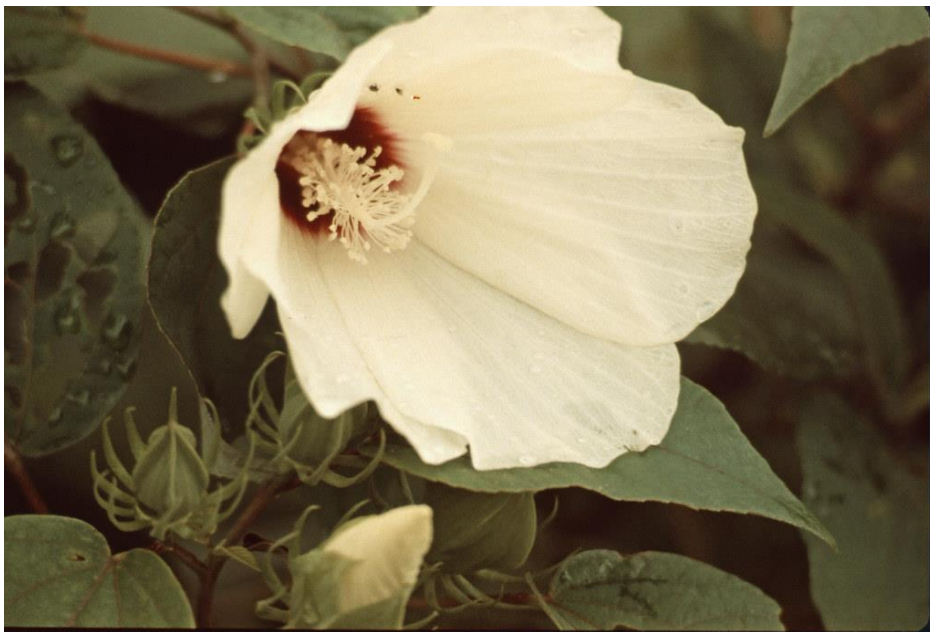
Slika 19 Pamuk (Gossypium spp.)

Pamučna vlakna sastoje se od jednoćelijskih sjemenskih dlačica u zdjelicama biljke pamuk. Plod pamuka pukne kad je zreo, otkrivajući pramen vlakana veličine šake duljine od 25 do 60 mm i promjera koji variraju između 12 i 45 \mu\text{m} . Pamuk je tropskog podrijetla, ali najuspješnije se uzgaja u umjerenj klimi s dobro raspoređenim kišama. Pamučna vlakna rana su društva koristila za proizvodnju tekstila (Arsene i sur., 2013).