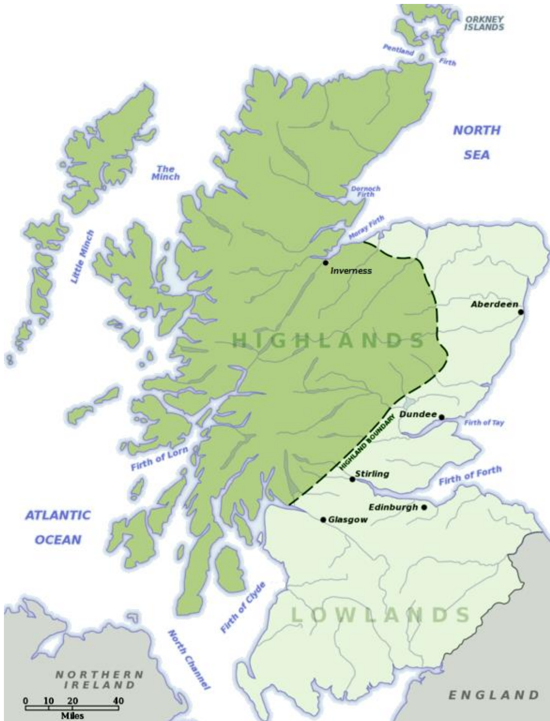
Slika 4. Regionalna podjela Škotske na Highlands i Lowlands