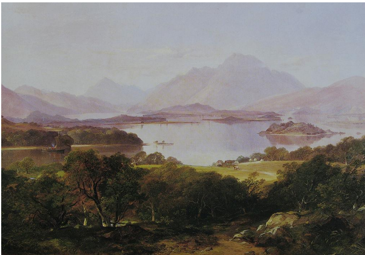
Slika 3. Horatio McCulloch, Loch Lomond, 1861

Highlandizam je snažno utjecao na škotski moderni pogled na sebe na Carskoj izložbi 1938. godine. Izložba, održana u Glasgowu u vrijeme ekonomske depresije, bila je ekspresija nade za budućnost. Škotska se predstavila zajedno s drugim nacijama Carstva kroz dva velika paviljona i, ponajviše u ovom kontekstu, kroz An Clachan , konstruirano Highlands selo. An Clachan je zamišljen kao oličenje škotskog Highlandsa, minijaturna, stroga i divlja Kaledonija i sagrađene slamnate kućice, oslikane pozadine Highlandsa i uvezeni Kelti da potkrijepe izložbu (Withers, 1999). An Clachan se predstavio kao simbol esencijalne Škotske, štoviše, bit: „Highlands selo će potaknuti mnoga sjećanja u svijesti vraćenih prognanika, a drugima će ostaviti neki dojam o stvarnoj staroj Škotskoj, zemlji Kelta, Škotska koja brzo prolazi pred neumoljivim naletom modernosti“ (Withers, 1999 iz An Clachan , 1938). Činjenica da slike Highlands krajolika, tartana i figure Bonnie Prince Charlieja tako snažno djeluju u suvremenim predstavama, sugerira da moderna Škotska nije i ne zanemaruje prošlost Highlandizma , već ga aktivno uključuje kao dio kontradiktornih i imaginarnih geografija (McCrone, 1995).