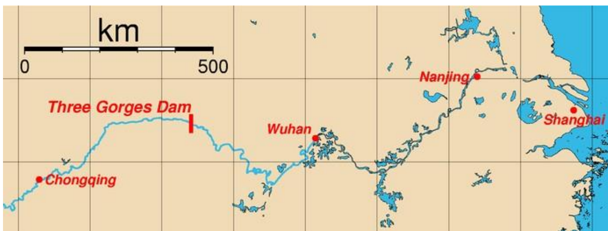
Slika 2. Prikaz smještaja Hidroelektrane Tri klanca i najveći gradovi na rijeci Chang Jiang

najkraći od triju klanaca rijeke Chang Jiang. Tri klanca rijeka je izdubila dok se prebijala preko planinskog ruba velikog kineskog Sečuanskog bazena. Slikoviti klanac Wu dug je 40 km, a njime dominira dvanaest Vilinskih vrhova. Klanac Xiling nekoć je bio najopasniji klanac, s uskim stazama, grebenima, brzacima i virovima. Pedesetih godina 20. stoljeća goleme stijene koje su izvirivale iz sredine riječnog toka uništene su eksplozivom kako bi plovidba rijekom bila sigurnija (Buchanan, 2005). Brana se nalazi neposredno uz klanac Xiling, 38 km uzvodno od brane Gezhouba. Gezhouba je prva brana kojom je pregrađena rijeka Chang Jiang. Brana Gezhouba također je bio eksperiment za buduću izgradnju Projekta Tri klanca. Njezina gradnja započela je 1970. godine, a završila 1988. godine. Godišnje je proizvodila 15,8 milijardi kWh električne energije (Nadilo, 2002).