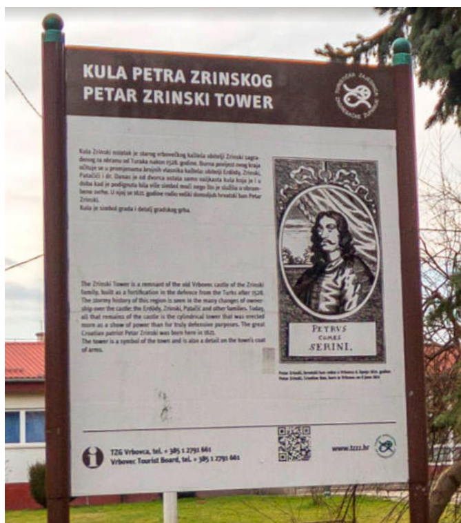
Sl. 3. Prikaz info ploče u centru grada Vrbovca

Ruralni turizam na području Grada Vrbovca slabije je razvijen. Kao dobar pokazatelj razvijenosti ruralnog turizma javljaju se objekti turizma na seljačkim gospodarstvima (u daljnjem tekstu TSOG). U Zagrebačkoj županiji se nalaze 30 TSOG-ova. Svi zajedno u ponudi imaju ukupno 41 krevet te 28 objekata s uslugom hrane, kao i 23 kušaonice vina/rakije. (Institut za turizam, 2016). Na području Vrbovca i bližoj okolici u ovom trenutku se ne nalazi niti jedan TSOG, što je ujedno i pokazatelj kako trenutno ruralni turizam na području Vrbovca nije ni malo razvijen. Prvi bliži TSOG se nalazi u susjednom gradu Sv. Ivan Zelina.