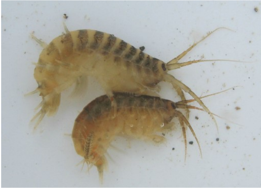
Slika 2: Dvije jedinke Dikerogammarus villosus u parenju (preuzeto iz Tricarico i sur., (2010))

Ženka može istovremeno nositi 50 jaja u komori na trbušnoj strani tijela. Juvenilne jedinke kada izađu iz jajeta morfološki nalikuju odraslima, no mnogo su manjih dimenzija. Spolno su zreli kada dosegnu veličinu od 6 mm, što postižu nakon šestog presvlačenja ( URL 1).