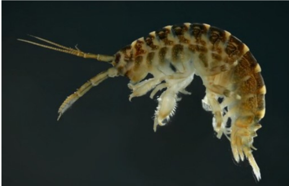
Slika 1: Dikerogammarus villosus (preuzeto iz Rewicz i sur., (2014))

do 30 mm u dužini tijela. S obzirom na godišnje doba razlikuje se stopa rasta, tako je mjesečni rast zimi između 1.3 i 2.9 mm, dok pri višim temperaturama u ljetnih mjeseci mogu narasti od 2 do 2.6 mm mjesečno. Životni vijek im je 2 do 3 godine, a budući da imaju nekoliko generacija godišnje dominiraju brojnošću (URL 1 , URL 2)).