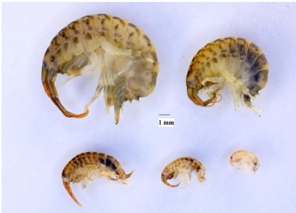
Slika 3: Dikerogammarus villosus u različitim fazama života

Ženka može istovremeno nositi 50 jaja u komori na trbušnoj strani tijela. Juvenilne jedinke kada izađu iz jajeta morfološki nalikuju odraslima, no mnogo su manjih dimenzija. Spolno su zreli kada dosegnu veličinu od 6 mm, što postižu nakon šestog presvlačenja ( URL 1).