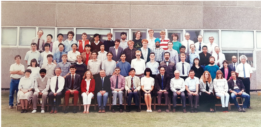
Slika 4. John R. Cooper (u sredini trećeg reda) s kolegama ispred novog laboratorija "Interdisciplinary Research Centre in Superconductivity", Sveučilišta u Cambridgeu, 1992. godine.