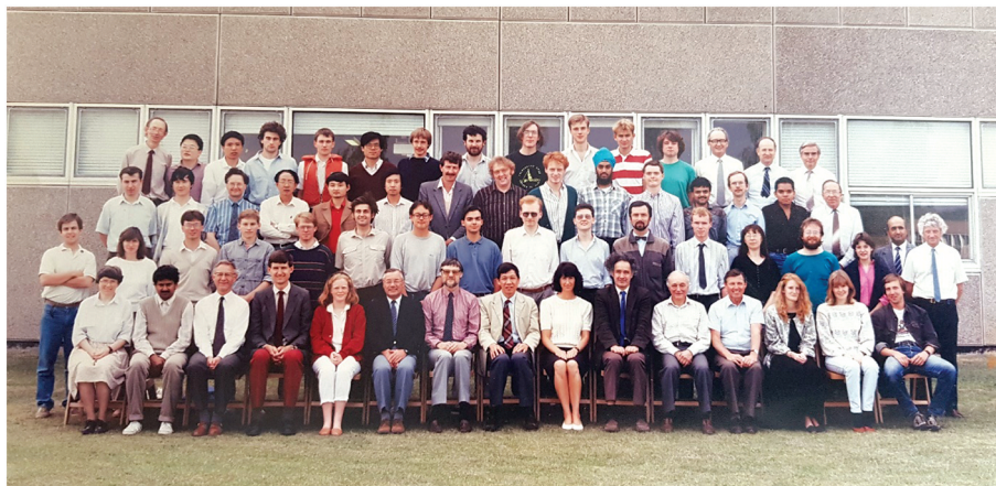
Slika 4. John R. Cooper (u sredini trećeg reda) s kolegama ispred novog laboratorija "Interdisciplinary Research Centre in Superconductivity", Sveučilišta u Cambridgeu, 1992. godine.