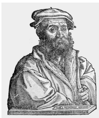
Slika 1.2: Niccolò Tartaglia