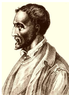
Slika 1.1: Girolamo Cardano

Girolamo (ili Gerolamo) Cardano (slika 1.1) jedan je od najznačajnijih renesansnih matematičara. Po zanimanju je bio liječnik, no gajio je veliki interes prema matematici i astrologiji. Cardano je bio tipična renesansna osoba raznolikih interesa i burnog života [13]. Najpoznatiji je po svom djelu Ars Magna (1545.), koje se bavi algebrom, točnije metodama rješavanja jednadžbi trećeg i četvrtog stupnja [14].