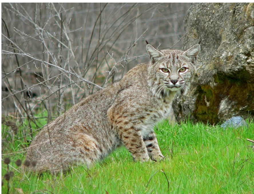
Slika 4. Crveni ris