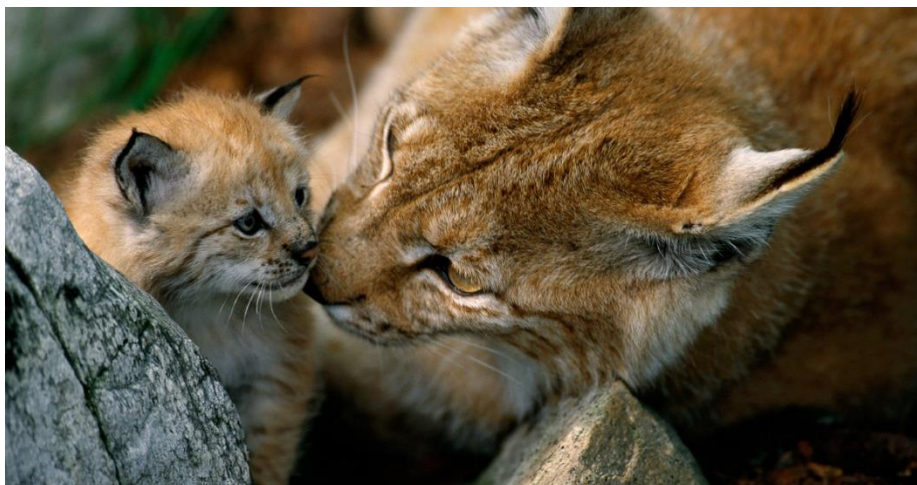
Slika 7. Euroazijski ris i mladunče

kreću u lov. Ženke spolnu zrelost postižu između 10 i 20 mjeseci, a mužjaci s 30 mjeseci. Životni vijek risa je duži u zatočeništvu gdje mogu doživjeti i do 24 godine. U prvoj godini života 50 % risova strada u prirodi. Uspjeh reproduktivnosti je ovisan o dostupnosti plijena i o staništu na kojem se ris trenutno nalazi.