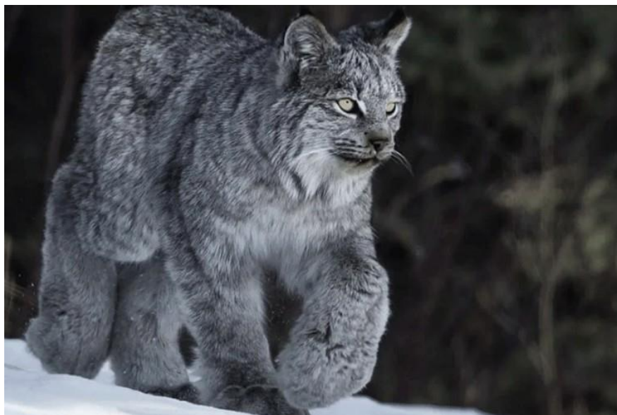
Slika 2. Kanadski ris