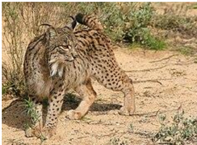
Slika 3. Iberski ris