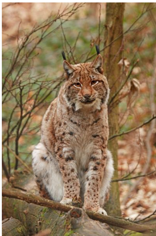
Slika 1. Euroazijski ris