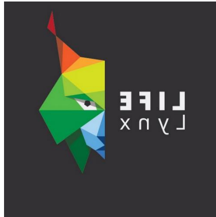
Slika 8. LIFE Lynx

U projektu sudjeluje 11 institucija iz 5 država, a države uključene u projekt su: Hrvatska, Italija, Slovenija, Rumunjska i Slovačka. U Hrvatskoj projekt provode Veleučilište u Karlovcu, Veterinarski fakultet Sveučilišta u Zagrebu i udruga BIOM. (Hunjak, 2021)