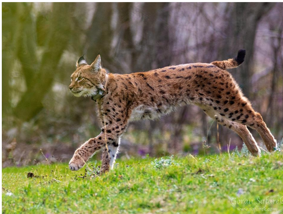
Slika 6. Tijelo euroazijskog risa

Ris ima dobro razvijena osjetila vida, sluha i njuha. Kod euroazijskog risa dobro je razvijen dnevni i noćni vid. Pomoću reflektirajućeg sloja stanica povećava mu se noćni vid za 40% i to mu omogućuje dobar lov pri smanjenoj svjetlosti. Brkovi su osjetljive dlake mačaka koje imaju veliki broj živaca u sebi. Brkovi se nalaze na njušci, obrazima, iznad očiju i na gležnjevima. Risovi imaju dobro zavijen sluh, a posebno su osjetljivi na visoke frekvencije. Uši imaju veliki broj mišića pomoću kojih se mogu zarotirati za 180 stupnjeva. Vjeruje se da čuperci dlaka na ušima risa pomažu u lociranju zvuka. Njuh pomaže u komunikaciji s ostalim jedinkama i u traženju plijena. Risovi imaju Jakobsonov organ koji se nalazi iznad nepca i omogućuje im osjet kemijskih tragova, a to je važno pri parenju.