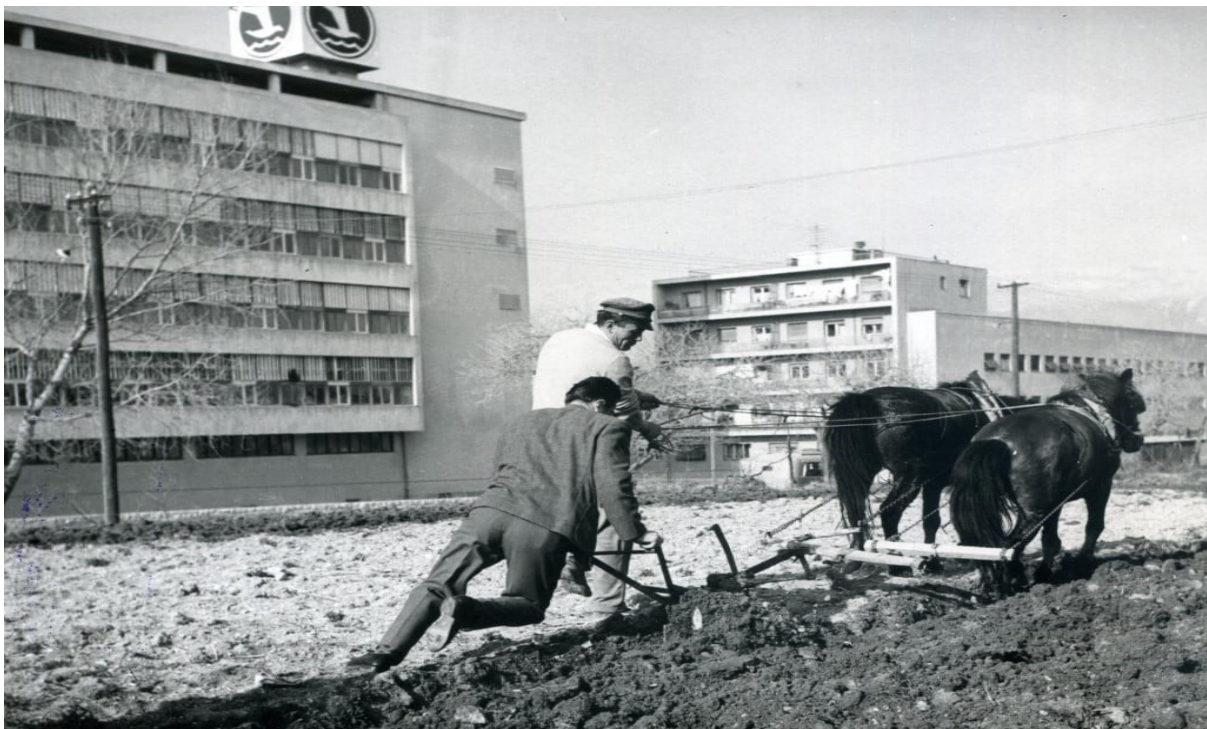
Sl. 3. Doticaj urbanog i ruralnog života u gradu 1960-ih, oranje pored zgrade Jugoplastike

Općenito, stanovništvo koje naseljava grad je pretežito mlado s tendencijom osnivanja obitelji, što je značilo da osim većinske emigracije i rastuća stopa novorođenih ima udio u sveukupnom porastu broja stanovnika. Uzevši u obzir navedeno, početkom šezdesetih Split je već udvostručio svoje stanovništvo za što mu je trebalo manje od 25 godina. U razdoblju najdinamičnijeg razvoja stanovništva Splita (1961.-1971.). Dalmacija je imala prosječnu godišnju stopu rasta stanovništva od 0,92%, a Hrvatska samo 0,62% (Klempić, 2004). U odnosu na ostale makroregije Hrvatske, Splitska u razdoblju od 1971.-1981. bilježi najveći porast gradskog stanovništva, a sam Split ima najveći broj zaposlenih u odnosu na splitsku aglomeraciju (Vresk, 1985). Međutim, takav demografski i gospodarski procvat u punom smislu, zahtijevao je stambeno zbrinjavanje rastućeg stanovništva. S druge strane, tvornice, prometna infrastruktura i poljoprivreda smatraju se kapitalnim investicijama i na njih se usmjeravaju glavna sredstva, što dovodi do velikog nedostatka stanova koji ne uspijeva nadoknaditi niti nacionalizacija privatnih stanova (Slobodna Dalmacija, 2022).