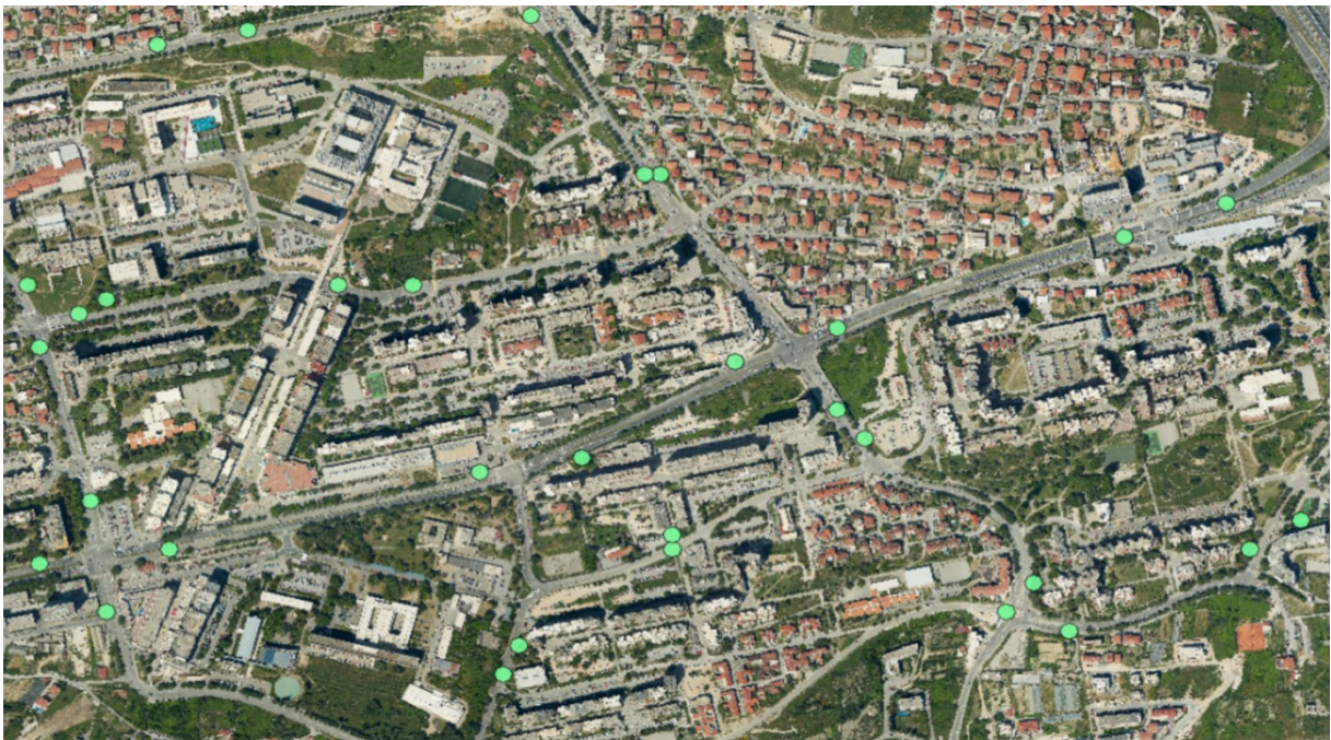
Sl. 8. Građevine javnog prijevoza (autobusne stanice) Splita 3

Na slici sedam, javne garaže označene su točkasto, dok su parkirališta označena poligonima. Urbanisti su kao glavni cilj pri izgradnji garaža izdvajali prohodnost ulica stoga su garaže građene podzemno. Kao i u drugim dijelovima grada problem predstavlja nedostatak parkirnih mjesta bilo u vidu parkirališta, a naročito u vidu garaža. Navedeno je posljedica: velike gustoće naseljenosti na manjoj površini, neadekvatnosti terena te povećanja broja vozila u odnosu na vrijeme izgradnje. Pri planiranju garaža uzeto je u obzir da prosječna obitelj ima jedan automobil te da će široke pješačke zone između ulica biti glavni smjerovi kretanja stanovnika. Današnja situacija je drugačija te skoro pa svaki član obitelji posjeduje automobil. Takvo povećanje u broju napravilo je pritisak na kvartove stoga je izgledno kako će budući postupci morati ići u smjeru izgradnje podzemnih ili nadzemnih garaža te povećanja svijesti o korištenju javnog prijevoza.