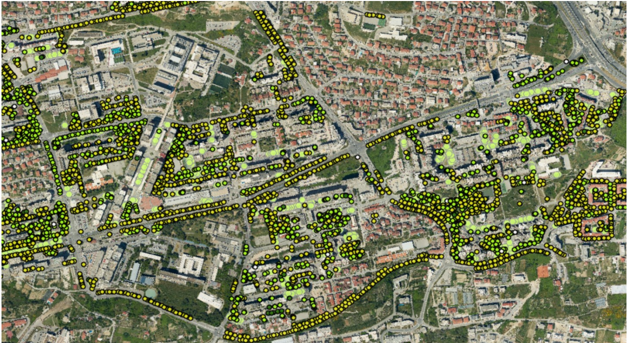
Sl. 5. Gradsko zelenilo Splita 3 – stabla i grmlja

Projekt Splita 3 je osim ranije spomenutih arhitektonskih podviga, izrodio i površine važne funkcionalne namjene što će biti priloženo slikama i objašnjeno u nastavku.