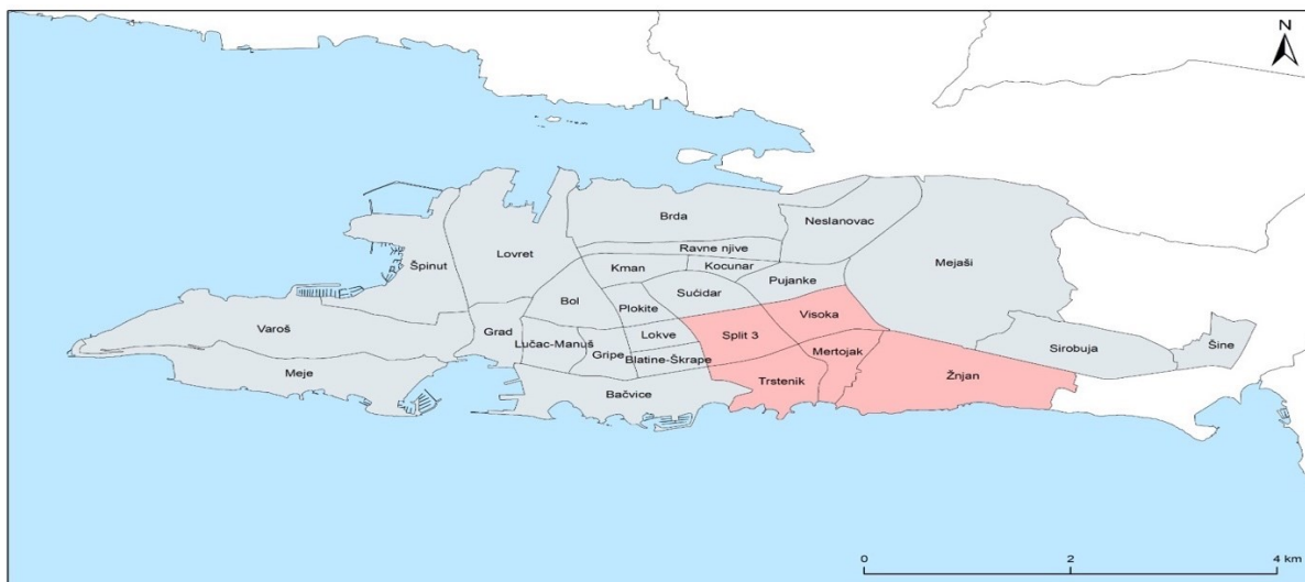
Sl. 2. Prostorni obuhvat urbanističko-arhitektonskog projekta Split 3 prema gradskim kotarima