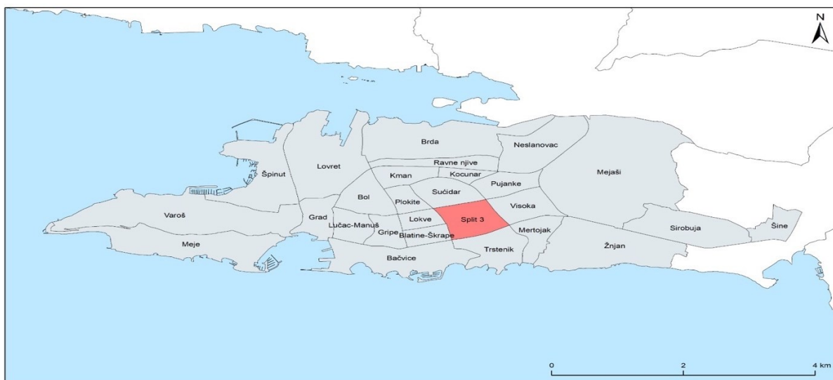
Sl. 1. Prostorni obuhvat Gradskog kotara Split 3 prema gradskim kotarima

Grad Split administrativno je podijeljen na ukupno 27 jedinica koje su poznatije kao gradski kotari. U sklopu gradskih kotara nalazi se i Split 3 te je važno napraviti razliku između kotara Split 3 (sl. 1) i urbanističko-arhitektonskog projekta Split 3 (sl. 2). U radu će se sadržaj referirati na projekt te će koristiti skraćeni naziv Split 3.