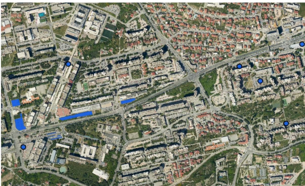
Sl. 7. Javne garaže i parkirališta Splita 3