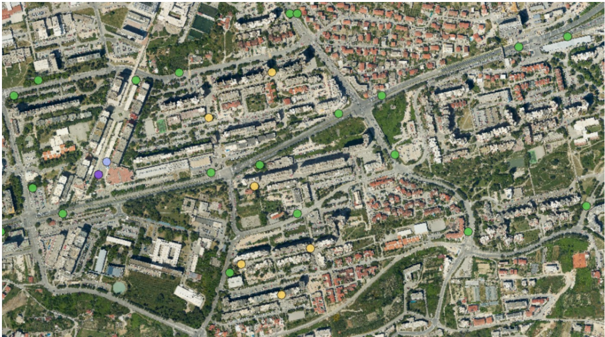
Sl. 9. Građevine javne namjene Splita 3