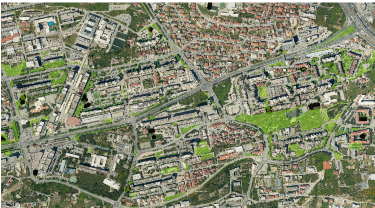
Sl. 6. Gradsko zelenilo Splita 3 - travnjaci i dječja igrališta