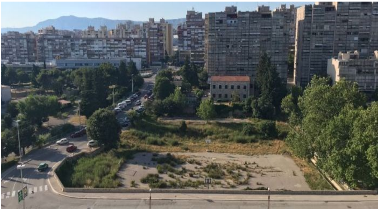
Sl. 11. Zona R1 u gradskom kotaru Trstenik

Vijeće Gradskog kotara Trstenik je jednoglasno podržalo i financiralo izradu idejnog rješenja uređenja kotarskog trga na način gdje bi tu jedinu vlasnički potpuno čistu parcelu oplemenilo s dva mala nogometna igrališta i dva koša koja bi uz pozornicu, platno te urbane klupe bili žila kucavica samog kotara, a s čime bi se umanjio (ne i obustavio) nedostatak sportskog sadržaja (Dalmacija News, 2021). Dakle, na razini jedinice lokalne samouprave te na razini stanovništva zahtjeva se prenamjena površine. Takve intervencije neupitno predstavljaju glavnu povezanost stanovnika i mjesta stanovanja.