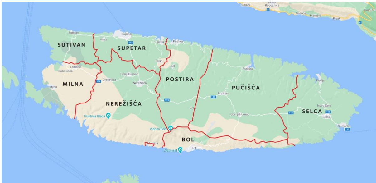
Sl. 2. Općine otoka Brača

jedna od najpopularnijih turističkih destinacija u srcu sezone, što zbog prirodnih ljepota i obale, a što zbog Zlatnog rata koji se u turističkom smislu probio na svjetsku scenu kao turistički fenomen i jedna od najpopularnijih plaža u ovom dijelu Jadrana.