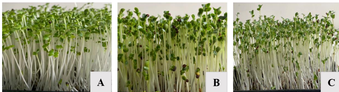
Slika 2. Primjeri mikropovrća roda Brassica : pak choi (A), kelj (B) i brokula (C). Preuzeto i prilagođeno iz Bhaswant i sur. 2023.

Za povrće roda Brassica poznato je da u zreлом stanju sadrži velike količine nutrijenata i fitokemikalija koji im daju boju, aromu i okus (Ebert 2022), ali su i izuzetno korisni za ljudsko zdravlje i prevenciju kroničnih bolesti (de la Fuente i sur. 2019). Mnoga su istraživanja već pokazala da je mikropovrće još bogatiji izvor različitih fitonutrijenata i bioaktivnih spojeva od odraslog povrća (Alloggia i sur. 2023), stoga se mikropovrće roda Brassica (Slika 2) smatra posebno obećavajućim novim oblikom funkcionalne hrane (Pant i sur. 2023).