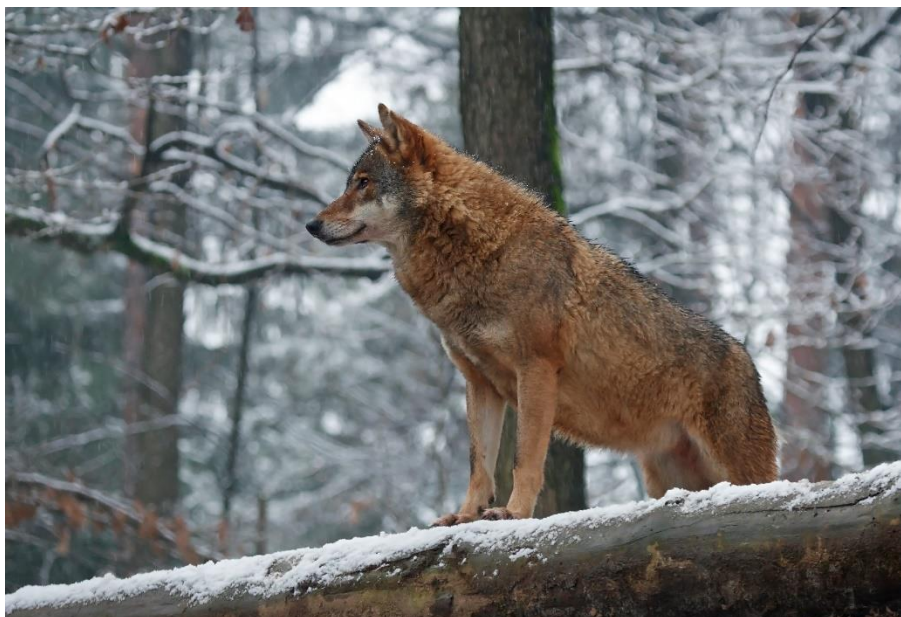
Slika 2. Izgled vuka