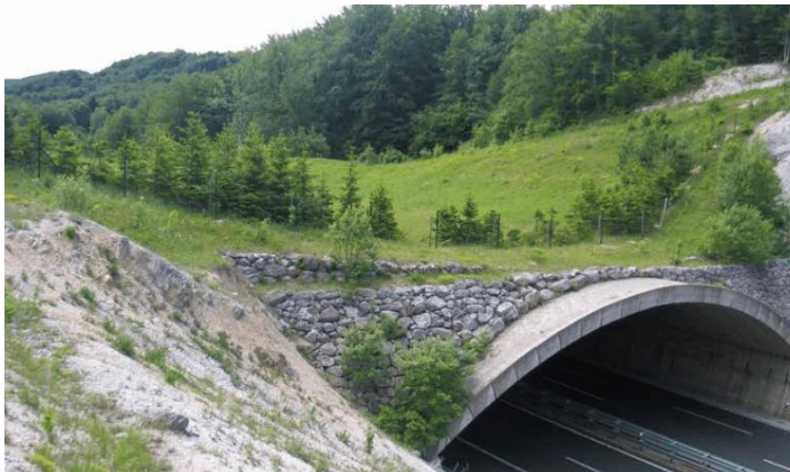
Slika 4. Zeleni most Dedina na autocesti A6 kod Delnica omogućuje siguran prijelaz divljih životinja preko prometnice.