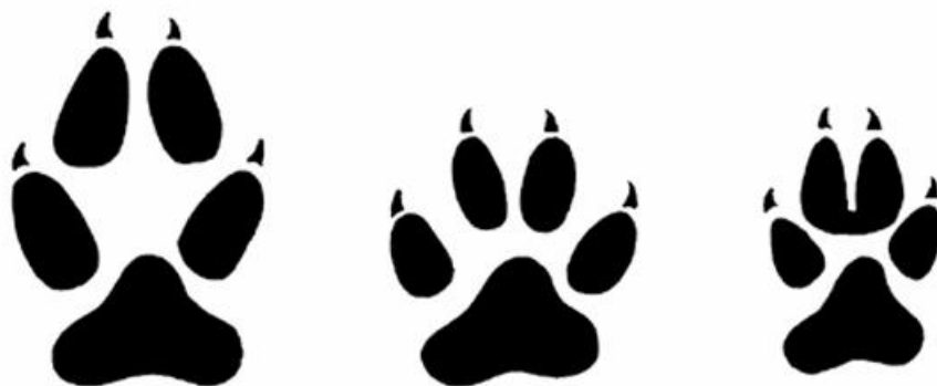
Slika 3. Skica otisaka šapa (s lijeva nadesno) vuka, psa i čaglja. Osim po veličini, vučja šapa razlikuje se od šape čaglja i po jastučićima srednjih prstiju koji kod vuka nisu srasli.

uvijek biti vidljive. Šape vukova vrlo je lako zamijeniti za pseće (Slika 2.), stoga je potrebno obratiti pozornost na trag u cjelini jer vukovi uglavnom hodaju u ravnini, dok psi često mijenjaju smjer kretanja njuškajući predmete u okolini. Također, moguće je naići na otiske čaglja, no oni se, osim po veličini, razlikuju od vučjih i po tome što su jastučići srednjih prstiju srasli zadnjim dijelom (Slika 2.) (Državni zavod za zaštitu prirode, 2010).