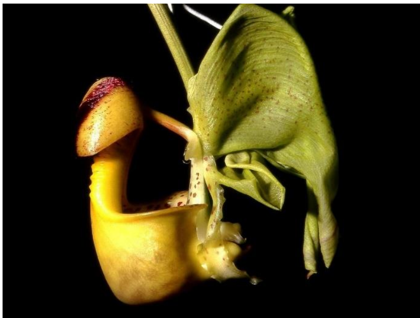
Slika 5. Orhideja iz roda Coryanthes s labelumom preobraženim u vrč ( https://en.wikipedia.org/wiki/Coryanthes_macrantha , 9.9.2024.)