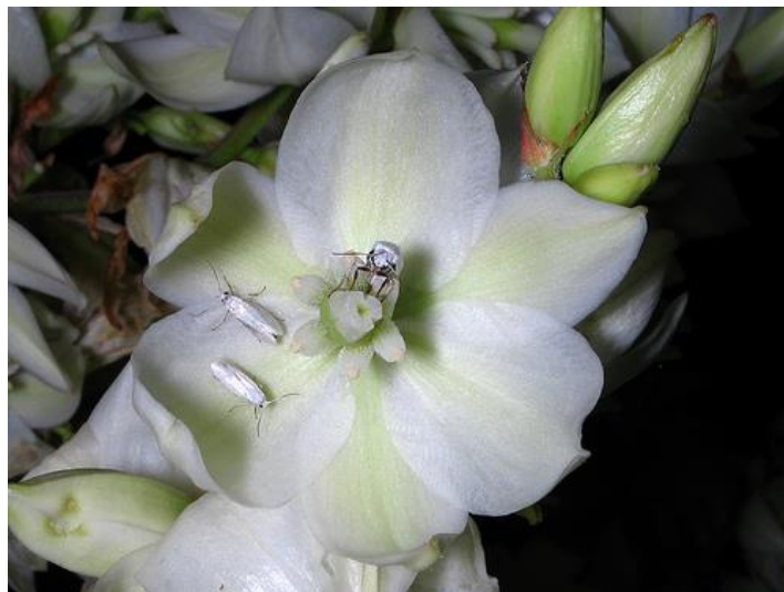
Slika 7. Cvijet vrste unutar roda Yucca oprašivan moljcima iz porodice Prodoxidae ( https://www.fs.usda.gov/wildflowers/pollinators/pollinator-of-the-month/yucca_moths.shtml ,