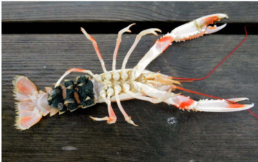
Slika 3. Nephrops norvegicus ženka s jajima

Škamp (Slika 3.) je odličan primjer ove strategije. Ženke se pare jednom godišnje, nedugo nakon presvlačenja, a parenje počinje jedan ciklus presvlačenja prije spolne zrelosti, tako da se maksimizira reproduksijski potencijal čim se razviju jajnici i može doći do oplodnje. Kako bi minimiziralo gubitak jaja tijekom polaganja, ženke se moraju zakopati u mulj s ventralnom stranom okrenutom prema gore, te pleopodima prihvaćaju jaja i drže ih pod abdomenom tijekom inkubacijskog razdoblja (Farmer, 2009). Inkubacijski period ovisi o temperaturi mora, ali u pravilu traje između 6 i 9 mjeseci, tijekom kojih su ženke uglavnom zakopane u mulju, no i dalje izlaze kako bi se hranile, tijekom čega su sklonije rizicima predacije od ne-nosećih (eng. non-berried) ženki (Farmer 1975; Marković i Petović 2016). Tijekom inkubacije, ženke pomno paze na jaja, te odbacuju neoplođena, inficirana ili oštećena jaja, što rezultira gubitkom približno 10% jaja svaki mjesec inkubacije (Mori i sur., 1998). Nakon izlijeganja, ličinke su samostalne, a ženka se može odmah ponovno pariti.