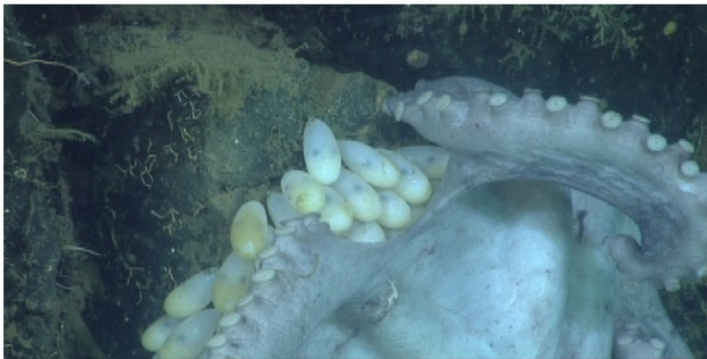
Slika 1. Ženka hobotnice Graneledone boreopacifica leži na jajima

Kao najpoznatije semelparne vrste beskralježnjaka, hobotnice su relativno ekstreman primjer roditeljske skrbi. Budući da ženke imaju samo jedno leglo prije ugibanja, svu energiju i resurse usmjeravaju na čuvanje svog legla. Tijekom parenja mužjak hektokotilom spremi spermatofores u plaštanu šupljinu ženke, gdje ih ona može čuvati do 114 dana. Oplođena jaja nisu spojena samim vezikulima, nego imaju produljeni stalak na vrhu kapsule, što je struktura potrebna za agregaciju jaja. Povezivanjem tih stalaka nastaje struna, koju ženka objesi na strop svojeg brloga i tijekom embriogeneze ih pomno čuva i osigurava protok vode. Tijekom čuvanja uopće se ne hrani, čak i ako joj je hrana ponuđena, a u slučaju ikakvog prilaska jajima postane iznimno agresivna (Joll, 1976). Inkubacijski period varira od vrste do vrste, no i unutar vrste varira ovisno o temperaturi vode. Vrste koje žive u plitkim vodama inkubiraju jaja 1-3 mjeseca, no dubokomorske vrste poput Graneledone boreopacifica (Nesis, 1982) (Slika 1.) mogu inkubirati jaja do 53 mjeseca, što je najduži period inkubacije ijedne poznate vrste (Robinson, 2014). Mlade hobotnice izlegnu se kao paraličinke, sićušne prozirne verzije odrasle hobotnice, a majka ugiba ubrzo nakon što su se sva vijabilna jaja izlegla (Joll, 1976).