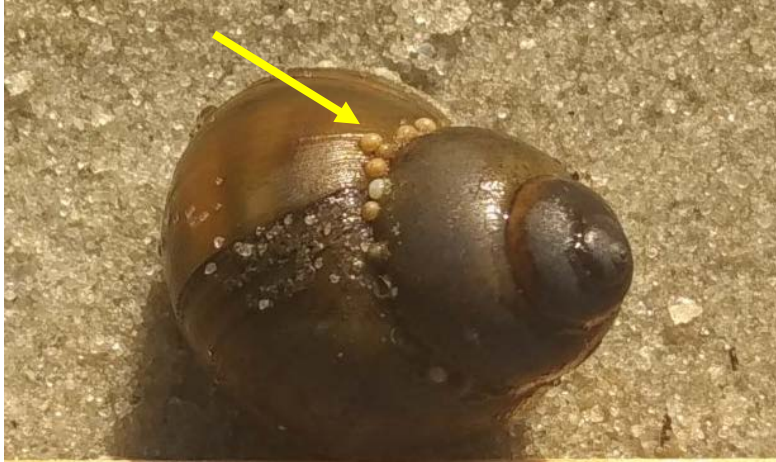
Slika 6. Riječni ogrc s mladima koji su netom izašli iz matične komore

Unutar matične komore, juvenilni ogrci su poredani od najvećeg i najrazvijenijeg do najmanjeg, tako da ogrc koji već ima kućicu i spreman je za samostalni život izlazi prvi (Jakubik, 2012). Ova je strategija povoljna jer ogrci primarno žive u mirnim dijelovima slatkih voda, a mogu se naći i u vrlo brzim vodama tijekom kiša i poplava, tako da ova strategija omogućava mladima veću vjerojatnost preživljavanja nakon disperzije (Jakubik i Augustyniuk, 2002).