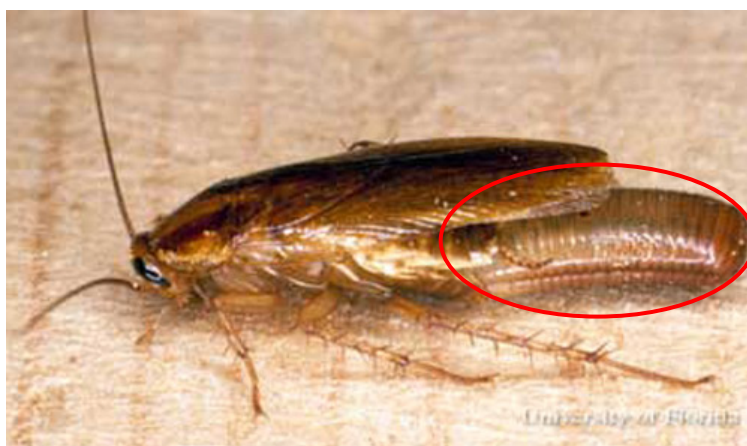
Slika 5. Blatella germanica ženka sa zrelom ootekom (označeno)

Žohari (red: Blattodea) gotovo svih vrsta ulažu neku vrstu roditeljske skrbi prema potomcima. Mogu biti oviparni, ovoviviparni i viviparni, a u nekim se slučajevima oba roditelja brinu o mladima do nekoliko godina (Nalepa i Bell, 1997.) Njemački žohar (Slika 5.) primjer je međukoraka evolucije prave ovoviviparije. Oviparne vrste žohara, čak i one koje nose jaja na svom tijelu, imaju vanjski omot (eng. egg case) oko jaja, zvan ooteka, koji osigurava izmjenu plinova i vode između jaja i okoliša. Ovoviviparne vrste žohara nemaju ooteku oko oplodjenih jaja, nego nose jaja u membranskoj vrećici na tijelu (Roth, 1968). Njemački je žohar rijedak primjer 'lažne' ovoviviparije, gdje ženka izbacila ootekalno kućište iz genitalnog otvora tijekom oplodnje, te ga odmah nakon ponovno uvuče u abdomen i nosi ih tijekom cijelog perioda embriogeneze, kao i ovoviviparne vrste (Nalepa i Bell, 1997).