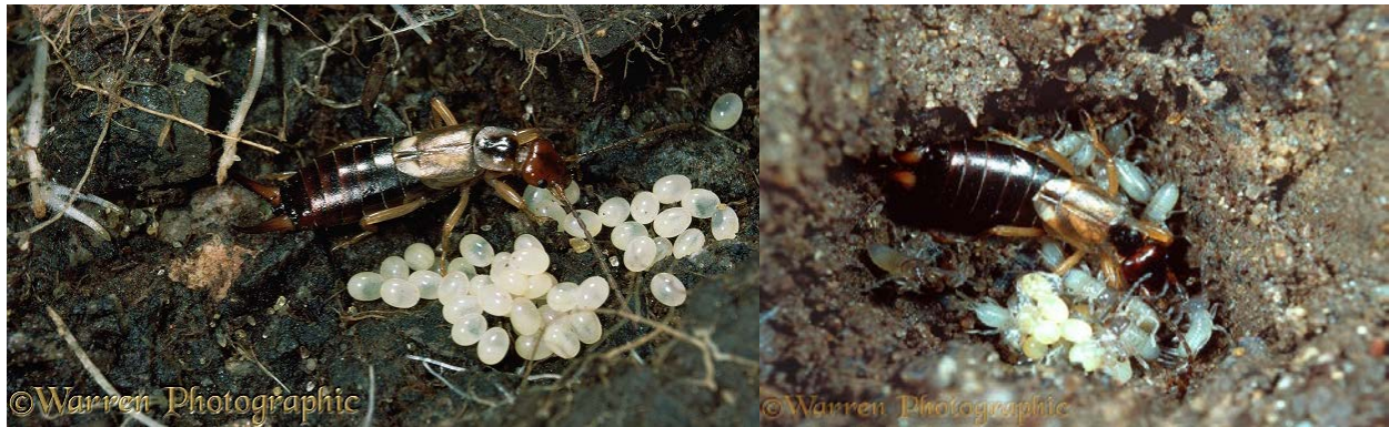
Slika 8. Forficula auriculata ženka sa a) jajima i b) tek izlegnutim nimfama

nakon što se nimfe izlegnu, pazi na njih tijekom 2 stadija (stanja između ciklusa presvlačenja), i nosi im hranu natrag u gnijezdo ili ih hrani regurgitacijom, čime im također prijenosi svoje simbiotske bakterije (Staerkle i Koelliker, 2008). U slučaju smrti majke, ako se jaja još nisu izlegla, nesrodne ženke mogu pokupiti jaja iz nastambe i odnijeti ih u vlastitu nastambu (Lamb, 1976).