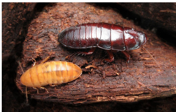
Slika 12. Cryptocercus sp. Odrasla jedinka (desno) i nimfa (lijevo)

Iako nisu striktno semelparni, jedan par žohara će najčešće imati jedno leglo tijekom cijelog života (Nalepa 1988a). Mužjak i ženka se upare čim dosegnu spolnu zrelost, te nakon jedne godine polegnu do četiri ooteke (Nalepa, 1988b). Oba roditelja zajedno brinu za mlade i grade složen brlog koji se sastoji od mnogih tunela i komora. Roditelji čiste jaja, štite jaja i nimfe od grabežljivaca kao i od drugih žohara, hrane mlade trofalaksijom (regurgutatom), te čiste mlade i izmet. Za razliku od većine kukaca, mladi se izlegu altricijalni; slijepi s tankom i blijedom kutikulom, te su potpuno ovisni o roditeljima. Nemaju ni nužne praživotinjske simbioante za razgradnju celuloze, nego ih moraju dobiti od roditelja. Nakon nekoliko presvlačenja, mladi razvijaju oči i sposobni su se samostalno hraniti drvom, no roditelji i dalje brinu za njih, što je vrlo rijetko u ne-eusocijalnih kukaca. Nimfe ostaju s roditeljima čak i preko tri godine. Spolnu zrelost dostižu s 5 do 6 godina, a prije toga napuštaju roditeljski brlog (Nalepa i Bell, 1997). S obzirom na dugi period asocijacije roditelja i mladih, smatra se da su preteča modela eusocijalnosti u termita (Nalepa, 1988b).