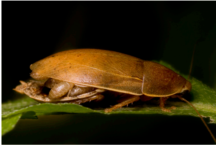
Slika 9. Thorax procellana s nimfama pod elitrama