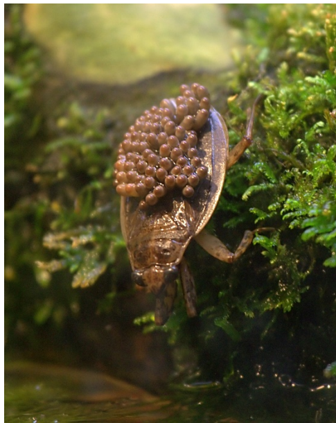
Slika 4. Mužjak Albedus herberti koji nosi jaja

partnera, demonstrirajući strategiju ženskog odabira (eng. female choice) (Motohide i sur., 2007). Mužjaci ipak imaju znatnu kontrolu nad ciklusom parenja, kako bi bili relativno sigurni da su većina oplodjenih jaja njihova (Smith, 1979). Mužjaci nose jaja pričvršćena na leđima (Slika 4.) i tijekom inkubacijskog perioda čuvaju jaja od predatora, brinu se da ostanu vlažna i osiguravaju izmjenu plinova izlaskom na zrak. Tijekom inkubacijskog perioda imaju manje uspjeha u lovu i veći rizik od predacije, no ova vrsta roditeljskog ulaganja je vrlo uspješna, jer se 97% jaja na leđima zdravih mužjaka izlegne, pod uvjetom da ostanu pričvršćena (Smith, 1976). No odmah nakon izlijeganja, nimfe su prepuštene same sebi, podložne predaciji i kanibalizmu od odraslih jedinki i starijih nimfa (Velasco i Millan, 1998).