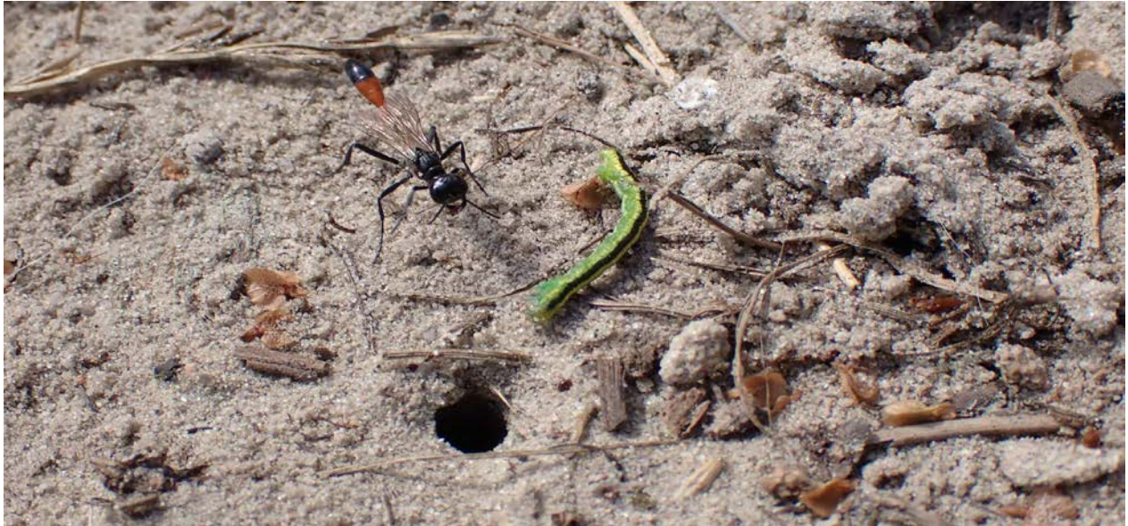
Slika 11. Ammophila pubescens (Curtis, 1836), pred ulaskom u brlog u kojeg stavlja gusjenicu

1998). Zanimljivo, jednako često se uljezi i sami pobrinu za opskrbljivanje hrane, pošto će njihovi potomci umrijeti od gladi ako domaća ženka shvati da jaja nisu njena. U tom slučaju ženke mogu dijeliti brlog, pošto ih manje „košta“ tolerirati drugu ženku nego konstanto zamjenjivati uljezova jaja svojima (Field i sur., 2023). Nakon izlijeganja, majka više nema kontakta sa svojim potomcima, te ide dalje kopati novi brlog.