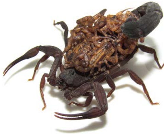
Slika 7. Ženka Tityus fuhrmanni (Kraepelin, 1914) s juvenilnim škorpionima na leđima