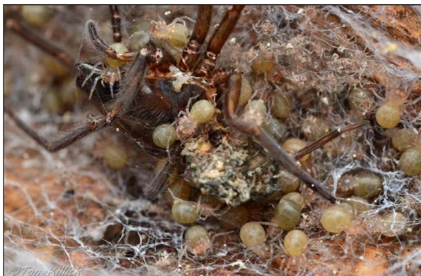
Slika 10. Amaurobius ferox , 2 dana nakon izlijevanja, mladi puci jedu majku