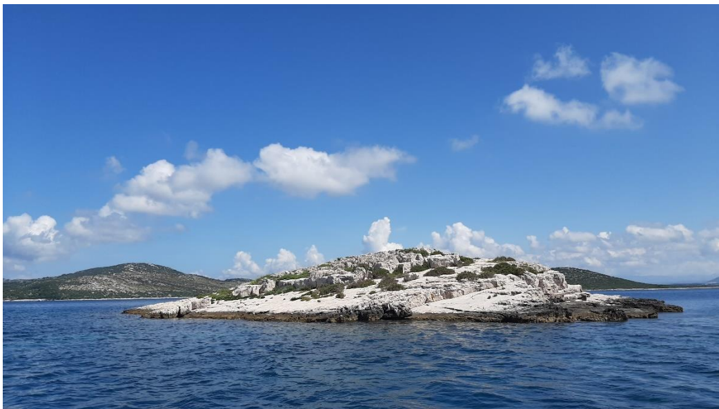
Slika 9. Otočić Ošljak Mali kod Pašmana (autor: Maja Bjelić Laušić)