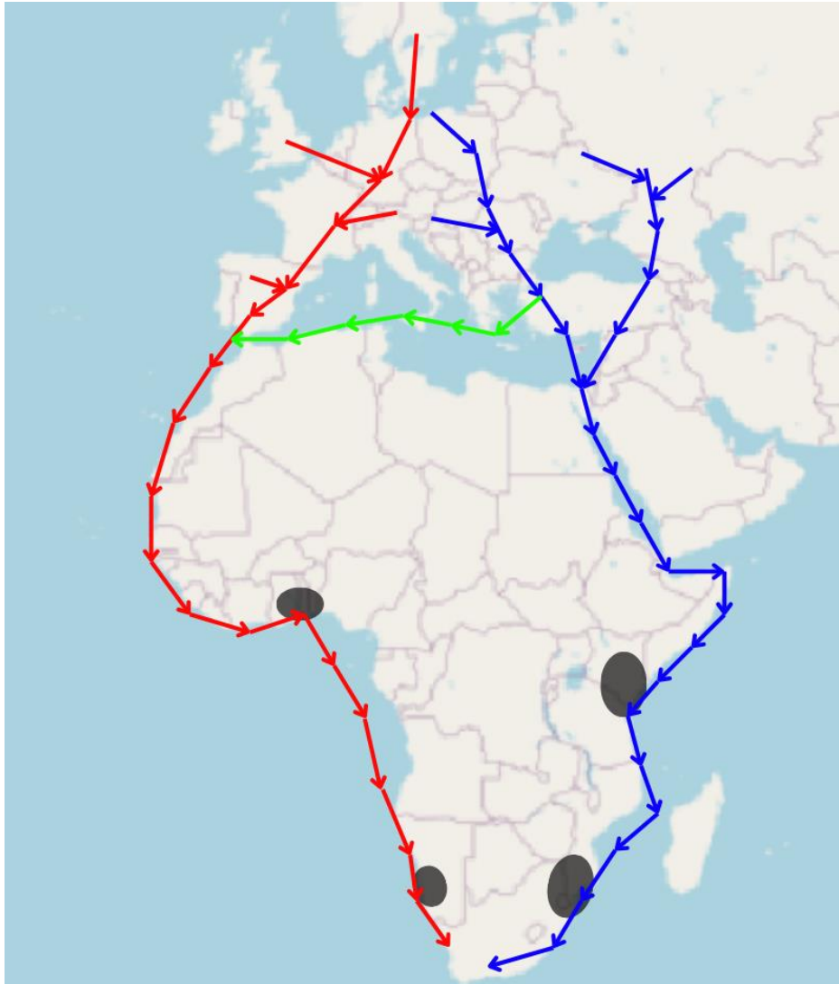
Slika 4. Pojednostavljeni prikaz migracijskih ruta europskih populacija crvenokljune čigre; crvenom bojom označena je migracijska ruta duž zapadnoafričke obale, plavom duž istočnoafričke obale, a zelenom migracijska ruta istočnoeuropskih populacija koje migriraju zajedno sa zapadnoeuropskim; crne elipse prikazuju lokacije zimovališta (izrađeno u programima QGIS 3.34.1 i Microsoft Paint Version 22H2 (Microsoft Corporation 2023), prema: Kralj i sur. 2020; Piro i Schmitz Ornés 2022)