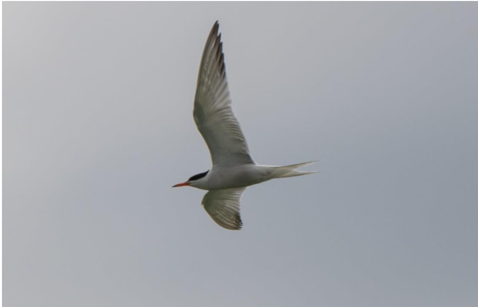
Slika 1. Crvenokljuna čigra (autor: Tomislav Mikić)