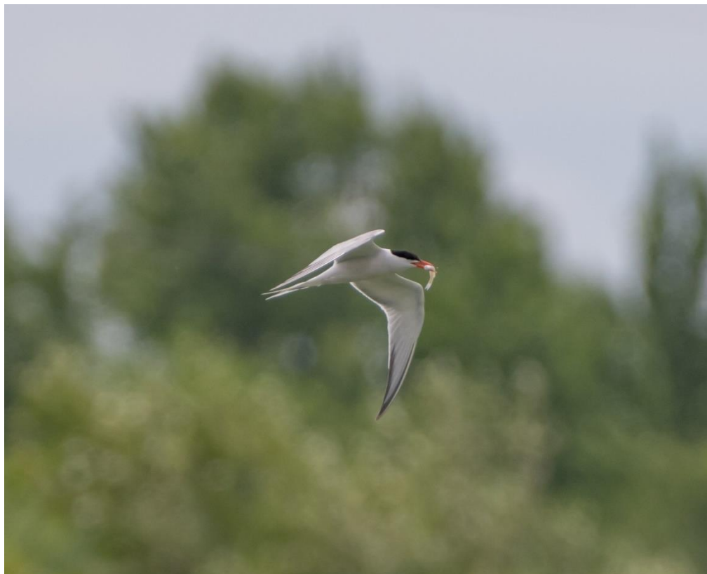
Slika 6. Crvenokljuna čigra s uhvaćenim plijenom

(Militão i sur. 2023). Primjerice, za vrijeme sezone gniježdenja, ženke će hranu tražiti u plićim priobalnim vodama u blizini gnijezda, dok će se mužjaci odvažiti na nešto dalje letove (Militão i sur. 2023). Pri tome će ženka manje vremena izbivati iz kolonije te će moći efikasnije inkubirati jaja, a mužjak će tražiti udaljenija hranilišta radi osiguravanja dodatnih izvora hrane (Militão i sur. 2023).