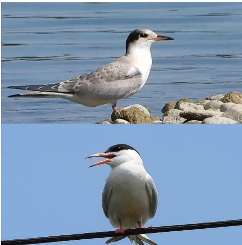
Slika 2. Morfološke karakteristike i razlike između juvenilne (gore) i odrasle jedinke (dolje) crvenokljune čigre (autor: Zlatko Torbašinović)