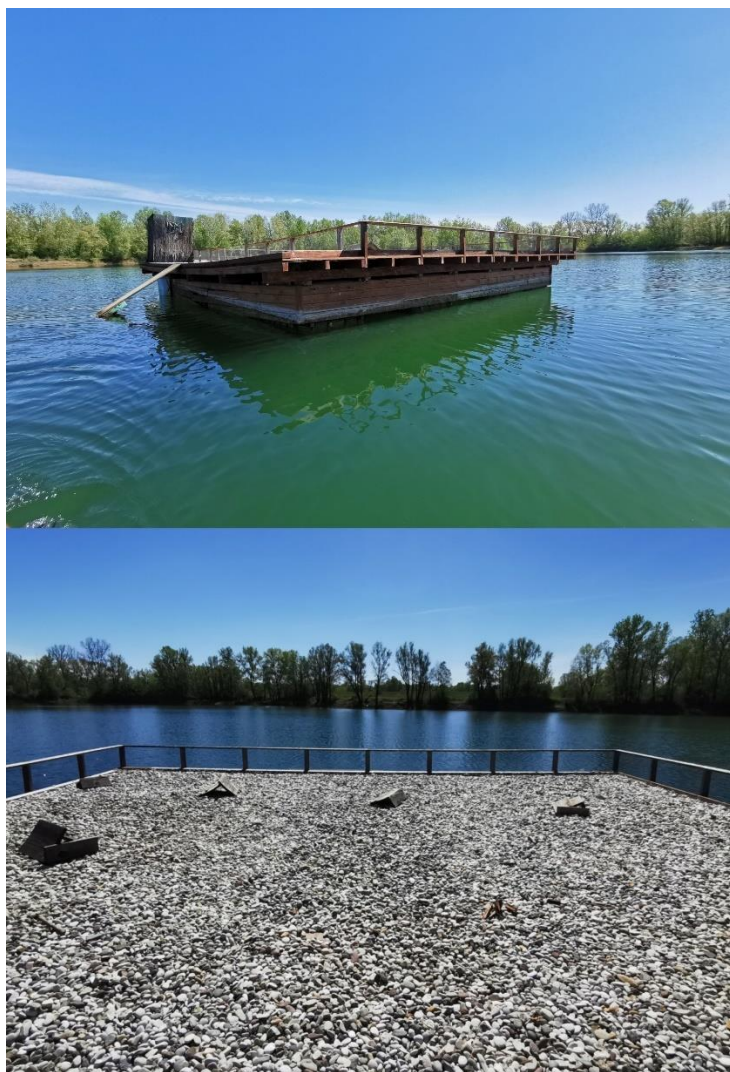
Slika 5. Platforma namijenjena gniježđenju crvenokljunih čigri na jezeru Siromaja 2