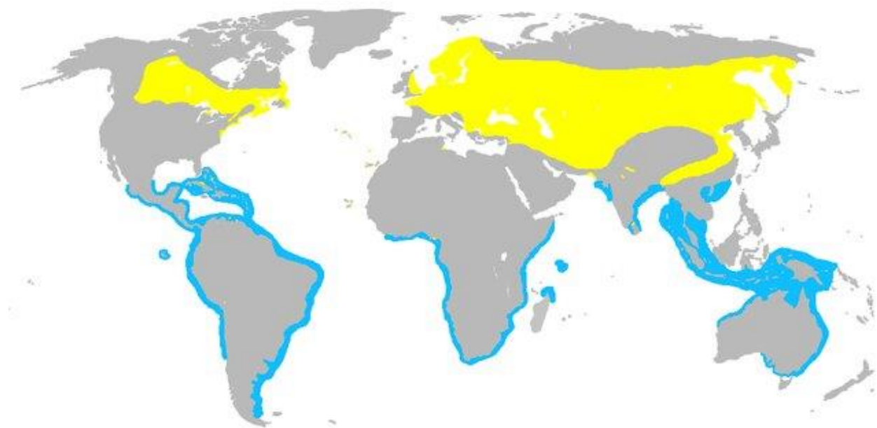
Slika 3. Prikaz globalne rasprostranjenosti crvenokljune čigre; žuta boja označava područja gniježđenja, dok plava označava područja zimovanja (preuzeto iz: Mejías 2017)

obale Afrike, ili prelaze istočno Sredozemlje i Crveno more te u konačnici migriraju duž istočne afričke obale (Slika 4.) (Cramp i Simmons 2006; Kralj i sur. 2020).