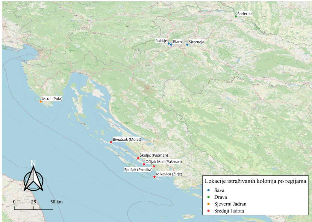
Slika 8. Lokaliteti kolonija u kojima su prikupljene mjere jaja za provedbu istraživanja, pri čemu su pojedinačni lokaliteti pridruženi odgovarajućoj regiji (karta izrađena u programu QGIS 3.34.1 (QGIS Development Team 2023))