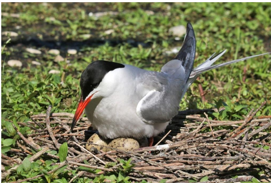
Slika 7. Crvenokljuna čigra u procesu inkubacije