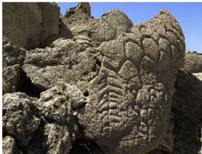
Slika 6. Petroglifi u stijenama oko jezera Winnemucca, Sjedinjene Američke Države (Benson i sur., 2013).

Simboli urezani u stijene oko jezera Winnemucca u Nevadi obuhvaćaju jednostavne linije i složenije oblike koji nalikuju na drveće, cvijeće i lisne žile (Sl. 6). Iako prisutni i na drugim lokalitetima u cijelom svijetu, pa tako i u Sjevernoj Americi, simboli urezani upravo oko jezera Winnemucca ističu se po svojoj veličini, dubini ureza i složenosti.