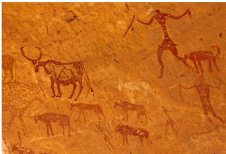
Slika 10. Crteži na zidu špilje masiva Tadrart Acacus, Libija ( http://whc.unesco.org ).

Špilje planinskog lanca Tadrart Acacus sadrže tisuće slika različitih stilova i starosti u rasponu od 12.000 do 100 godina (Sl. 10) ( http://whc.unesco.org ).