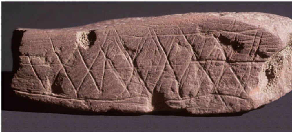
Slika 3. Kamen s urezima iz špilje Blombos, Južnoafrička Republika

Geometrijska ili ikonografska djela smatraju se snažnim dokazima za pojavu apstraktnog razmišljanja. Takvi dokazi brojni su za period od prije 40.000 godina u Starom svijetu i smatraju se pokazateljima moderne ljudske kulture. Međutim, postoje i raniji primjeri djelovanja vođenog apstraktnom misli, poput ugraviranih geometrijskih uzoraka na kamenju pronađenom u špilji Blombos u Južnoafričkoj Republici (Sl. 3)