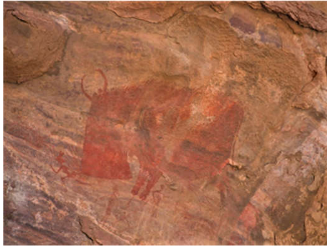
Slika 8. Crtež indijskog lava, bizona i ljudi star 13.000 godina, Bhimbetka, Indija ( www.smithsonianmag.com ).