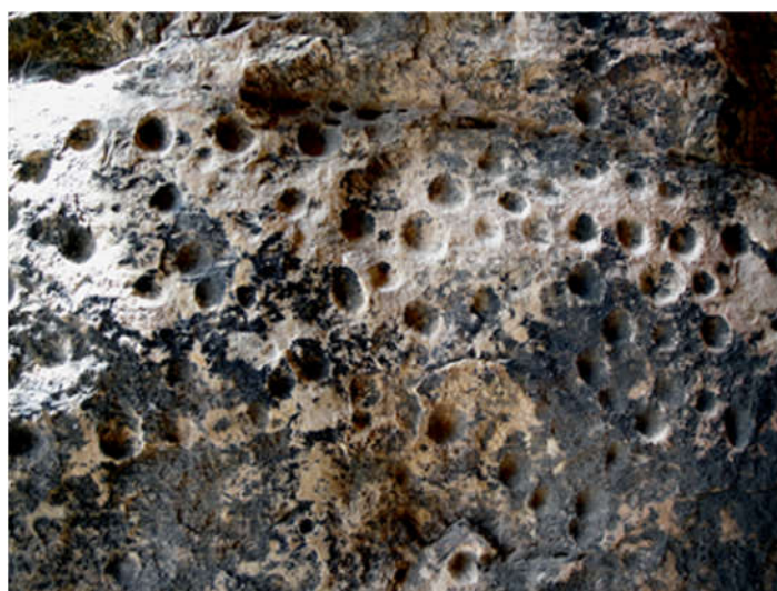
Slika 2. Kupule u špilji Daraki-Chattan, Indija (Kumar i Krishna, 2015).

Funkcija kupula, najbrojnijih petroglifa na svijetu, nije poznata, iako neka etnografska istraživanja pretpostavljaju široki broj potencijalnih namjena, od metode označavanja stijena do korištenja kupula kao litofona i u društvenim igrama. Sigurno je da čak i najstarije identificirane kupule, poput onih u špilji Daraki-Chattan u Indiji (Sl. 2), jasno prikazuju da su njihovi tvorci izrađivali kupule vrlo precizno, vođeni principom ostvarivanja najveće dubine, a najmanjeg promjera (Bednarik, 2008).