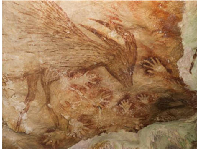
Slika 7. Crteži i otisci ruku na Sulaweziju, Indonezija ( www.news.nationalgeographic.com ).

Nova datiranja pomoću radioaktivnog urana u mineralnim slojevima koji prekrivaju te umjetnine otkrivaju da su neki primjerci otisaka ruku stari najmanje 39.900 godina, dok je dosad najstariji pronađeni crtež na ovom lokalitetu, koji prikazuje babirusu (“svinju-jelena”), star najmanje 35.400 tisuća godina (Aubert i sur., 2014). Ova otkrića dovode u pitanje status slike crvenog diska u španjolskoj špilji El Castillo kao najstarijeg poznatog primjerka špiljske umjetnosti ( www.news.nationalgeographic.com ).