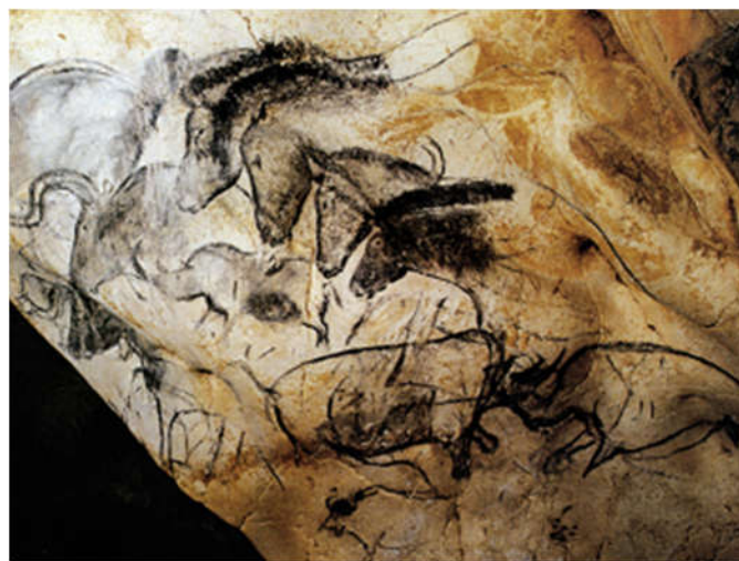
Slika 9. Dio crteža životinja na zidovima špilje Chauvet, Francuska.

Špilja Chauvet sadrži najstarije poznate i najbolje očuvane figurativne crteže na svijetu. Crteži su stari najmanje 30.000 godina, a svoju očuvanost duguju odronu koji je prije oko 20.000 godina zatvorio ulaz špilje pa je lokalitet ostao zatvoren i zaštićen do njegova otkrića 1994. godine. Na špiljskim je zidovima dosad identificirano preko 1000 slika koje prikazuju antropomorfne i životinjske likove (Sl. 9).