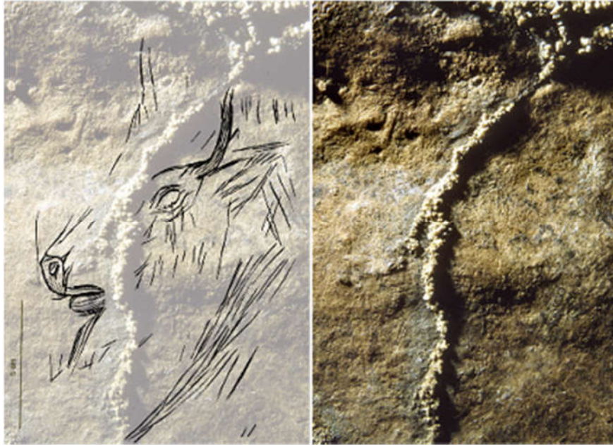
Slika 5. 2D rekonstrukcija petroglifске minijature koja prikazuje glavu bizona (veličina 5 cm), špilja Marsoulas, Francuska (Fritz i sur, 2016).