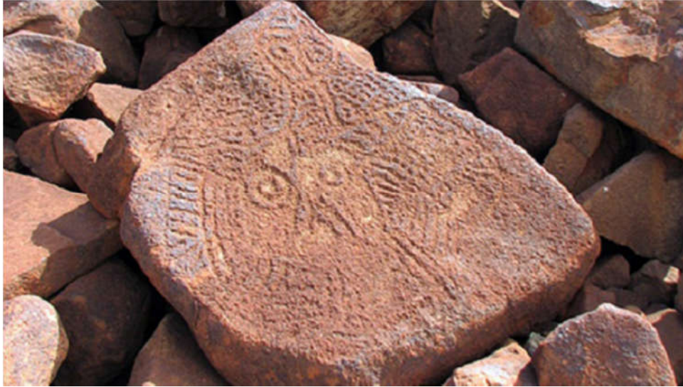
Slika 4. Jedan od najstarijih petroglifa ljudskog lica na svijetu, poluotok Burrup, Australija ( http://www.australiangeographic.com.au ).

tvori koja bi se mogla ispitati. Ipak, na temelju uzoraka nastalih trošenjem stijena, stila i sadržaja petroglifa, kao i arheoloških dokaza o nastanjenosti lokaliteta, procjenjuje se da su ondje pronađeni petroglifi stari i do 30.000 godina ( www.visual-arts-cork.com ).