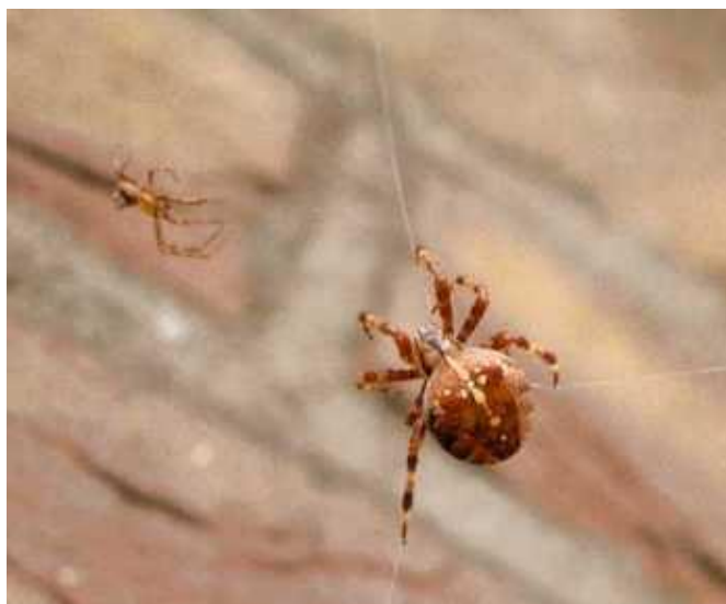
Slika 6. Mužjak A. diadematus prilazi ženki ( http://animals.howstuffworks.com/arachnids/spider8.htm )

Napadi ženki često ne dovode do smrti i kanibaliziranja mužjaka. Seksualni kanibalizam treba promatrati kao dvostruki događaj koji uključuje napad ženke, ali i uspješan čin ubijanja. Izgladnjele ženke djevice A. diadematus napadaju mužjake, ali rijetko završe sa obrokom. Neuspješni napadi prije kopulacije podrazumijevaju potrošnju energije za ženu. Ako ženka kanibalizira mužjaka za hranjive tvari, energetski trošak možda neće biti neutraliziran. Ženka bi trebala pokušati pojesti mužjaka samo kada će dobivene hranjive tvari nakon uspješnog napada donijeti energetski višak. Sličan odnos pronađen je kada se broj parenja uzima u obzir; iako su ženke koje su se prethodno već parile više sklone napadu prije kopulacije, nije bilo vjerojatno da će ubiti partnera. Glad motivira ženu na agresivno ponašanje, a vjerojatnost pojave kanibalizma prije ili poslije kopulacije određuje razlika u veličini partnera. Takvo ponašanje moglo bi se objasniti adaptive foraging hipotezom.