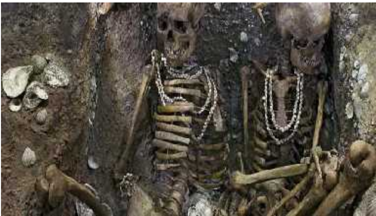
Slika 4. Kosturi dvije žene, Brittany, Francuska

Danas se mnogo znanstvenika slaže da su neandertalci imali neke osobine modernog čovjeka: simboliku, kulturno definiran sustav, možda i jezik te duhovnost. Neandertalci su na tlu današnje Europe opstali više od 150000 godina, dok smo mi kao predstavnici modernih ljudi ovdje tek oko 40000 g, što dokazuje da su se jako dugo uspješno prilagođavali promjenama u klimi i okolišu. U srednjem paleolitu nalazimo tragove upotrebe boja, skupljanje lijepih predmeta, npr. školjki, i grube gravure u predmetima, u gornjem paleolitu bi se već moglo govoriti o umjetnosti neandertalaca. Također je u gornjem paleolitu u 88% slučajeva ustanovljeno postojanje grobnih priloga, dok je u donjem taj postotak iznosio 33%, što ukazuje na potencijalnu duhovnost (slika 4). Postoje i nalazi nakita u šatelperonijenoj kulturi, no ne može se utvrditi jesu li do tog nakita došli razmjenom s već pristiglim modernim ljudima iz Afrike ili su ga sami izrađivali.