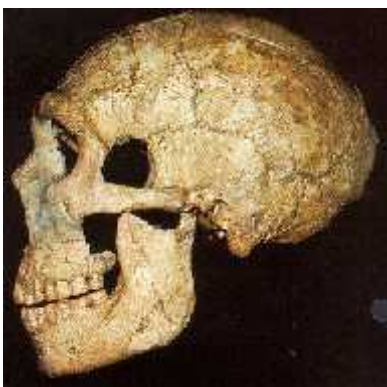
Slika 8. Neandertalska lubanja pronađena u La Ferrassie-u