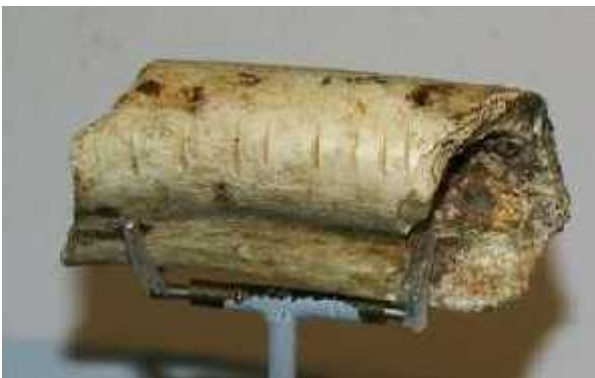
Slika 14. Polomljena neandertalska kost, Musee National de Prehistoire, Les Eyzies, Francuska

Kod rasprave o Neandercima, često se postavlja i pitanje kanibalizma. Na mnogim nalazištima, uključujući i Krapinu, pronađene su polomljene kosti, vjerovatno kako bi se došlo do srži, te polomljene lubanje, kako bi se moglo doći i do mozga (slika 14). To bi mogla biti posljedica geoloških procesa tijekom fosilizacije, a moglo bi i označavati kanibalizam kod neandertalaca. Na kanibalizam upućuje to što su na istim nalazištima neandertalci lomili kosti životinja koje su koristili za jelo. Iako je kanibalizam gotovo potvrđen, upitno je je li on bio uzrokovan stresnim situacijama, kao velikom nestašicom hrane u hladnim razdobljima, ili je bio odraz duhovnosti i imao religijsko značenje. Također je upitno jesu li neandertalci jeli članove svoje zajednice ili su bili žrtva drugih zajednica.