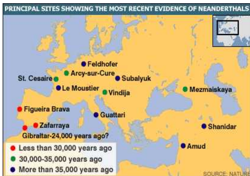
Slika 3. Nalazišta neandertalaca

Dijele se na starije ili predneandertalce i klasične neandertalce. Stariji neandertalci živjeli su u posljednjem interglacijalu, pa se nazivaju i predwürmski neandertalci. Nalazišta sa ostacima njihovih kostiju, kostiju životinja koje su koristili za jelo, te njihovog oruđa pronađeni su u Njemačkoj, Italiji, Slovačkoj, u Hrvatskoj u Krapini, te na još nekoliko lokaliteta. Klasični neandertalci živjeli su u vrijeme posljednje oledbe, pa se nazivaju i würmski neandertalci. Njihova nalazišta nalaze se u Neanderthalu, Francuskoj, Italiji, Bliskom istoku, Španjolskoj, i u Hrvatskoj u špilji Vindija. Bili su crvenokosi, s pjegicama na licu, niži, no i snažniji od današnjeg čovjeka, iste vrste, robusne građe i tijela uvjetovane velikom fizičkom aktivnošću. Njihova kultura naziva se musterijska kultura.