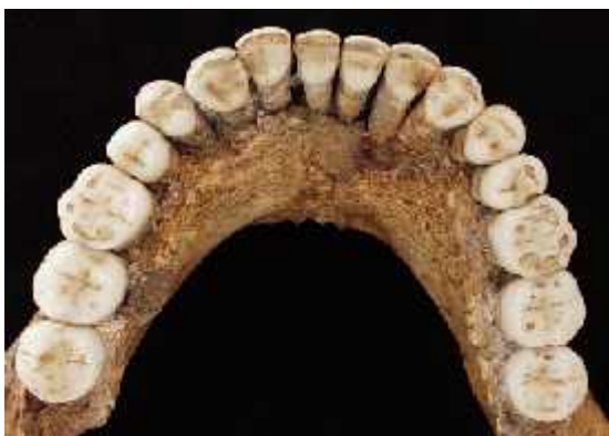
Slika 9. Rekonstrukcija neandertalskih zubiju izložena na Kraljevskom Belgijskom institutu za prirodne znanosti u Bruxellesu.