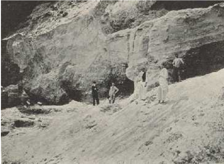
Slika 6. Dragutin Gorjanovi Kramberger na nalazištu na Hušnjakovom

”Der diluviale Mensch von Krapina in Kroatien: ein Beitrag zur Paleoantropologie”, 1906.g, te ”Život i kultura dilivijalnog ovjeka iz Krapine u Hrvatskoj”, 1913.g. Istraživanjem Krapinskog područja novim metodama iskapanja i svojom preciznošću i predanošću u tom radu, Dragutin Gorjanovi Kramberger dao je velik doprinos razumijevanju i poznavanju anatomije i kulture neandertalaca, te započeo znanstveno proučavanje paleolitika u Hrvatskoj.