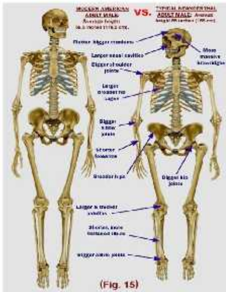
Slika 10. Usporedba anatomske građe neandertalca i modernog čovjeka

Veliki dio osobina neandertalaca naslijeđen je od predaka. Neke su rezultat prilagodbe na okoliš, a neke na način života.