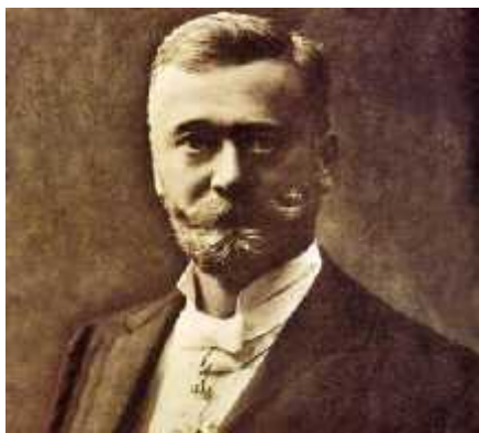
Slika 5. Dragutin Gorjanovi Kramberger

D.G. Kramberger uveo je u iskapanju u Krapini neke nove metode iskopa poput iskapanja po slojevima, i detaljnog bilježenja i skiciranja svakog sloja i fosilnih ostataka pronađenim u njima, što je u ono vrijeme bila novost. Izdvojio je 4 zone: 1. zona sa Castor fiber (dabar), 2. zona sa Homo sapiens (čovjek), 3. zona sa Rhinoceros merckii (nosorog) i 4. zona sa Ursus spelaeus (špiljski medvjed). Na svakom nalazu zabilježio je sloj u kojem je pronađen. Glavni pomoćnik u tom iskapanju koje je trajalo do 1905. godine bio je S. Osterman.