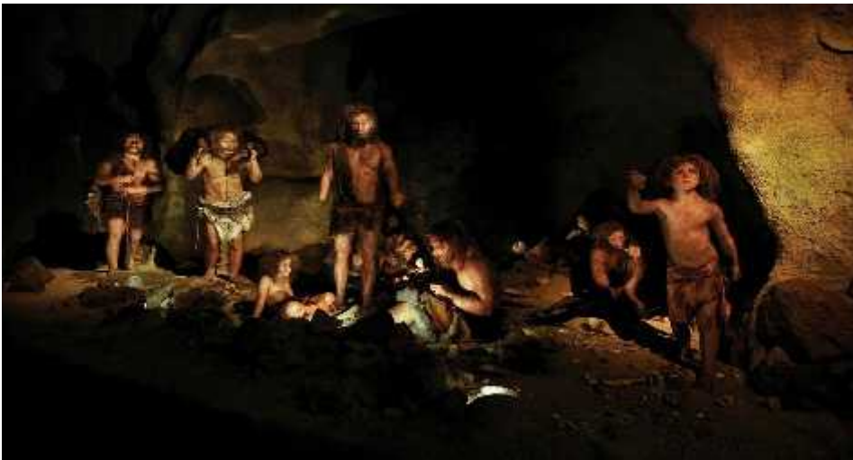
Slika 11. Rekonstrukcija staništa, Muzej krapinskih neandertalaca u Krapini ( www.mkn.hr )