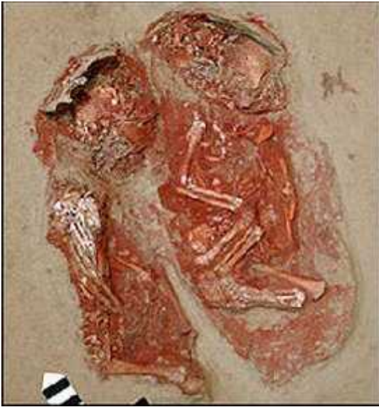
Slika 13. Kostur pokopanog djeteta u položaju u kojem su neandertalci pokapali svoje mrtve, Austrija