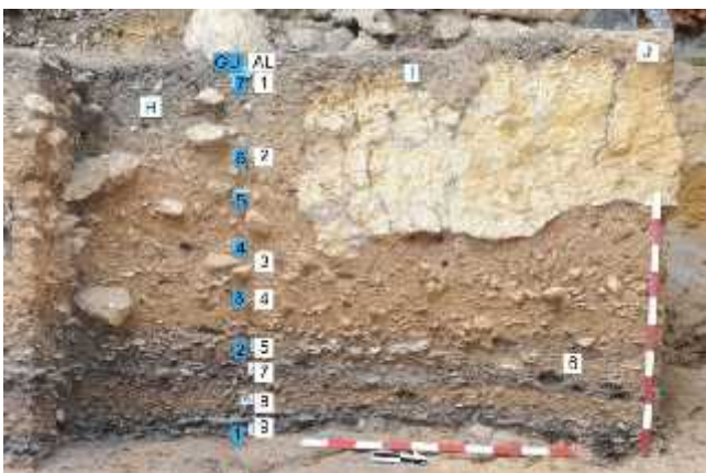
Slika 12. Tamne mrlje oko broja 6 su tragovi pepela prona eni u špilji Roc de Marshal u Francuskoj

Evidencija upotrebe vatre eš a je u srednjem paleolitiku nego u donjem, no još uvijek prili no oskudna (slika12). U špilji Dordogona XVI. U Francuskoj nedvojbeno je dokazana upotreba i kontrola vatre prije 65600-53900 g. Starost je utvr ena metodom termoluminiscencije. Kao gorivu tvar koristili su lišajjeve. Upotreba vatre dokazana je i u Krapini: prona ena su kamenom ome ena ognjišta, a kao gorivu tvar koristili su borovicu ( Juniperus sp ), koju su vjerovatno prije morali sušiti. Vatru su koristili vjerovatno u svrhu ogrijeva, pripreme hrane, u lovu, kao obranu od zvijeri i za svijetlost.