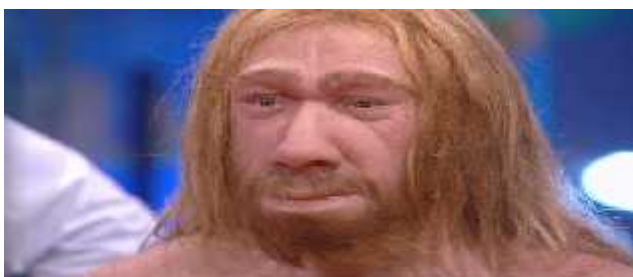
Slika 1. Odrasli neandertalac

Prvu monografiju koja detaljno opisuje anatomiju neandertalca izdao je Dragutin Gorjanovi Kramberger opisujući i nalaze iz Krapine, no ti ostaci su fragmentirani, pa je u javnosti već u popularnost potigla monografija koju je napisao M. Boule opisujući i jedan cjeloviti kostur odraslog muškarca iz La Chapelle-aux-Saints u Francuskoj (slika 2).