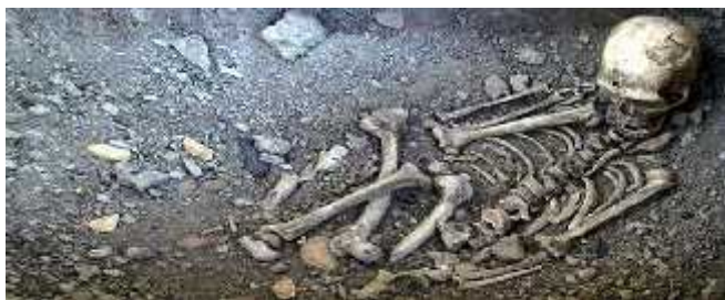
Slika 2. Rekonstrukcija kostura pronađenog u La Chapelle-aux-Saints, izloženo u Muzeju neandertalaca u La Chapelle-aux-Saints-u