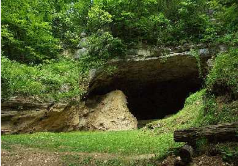
Slika 7. Špilja Vindija ( www.hkv.hr )