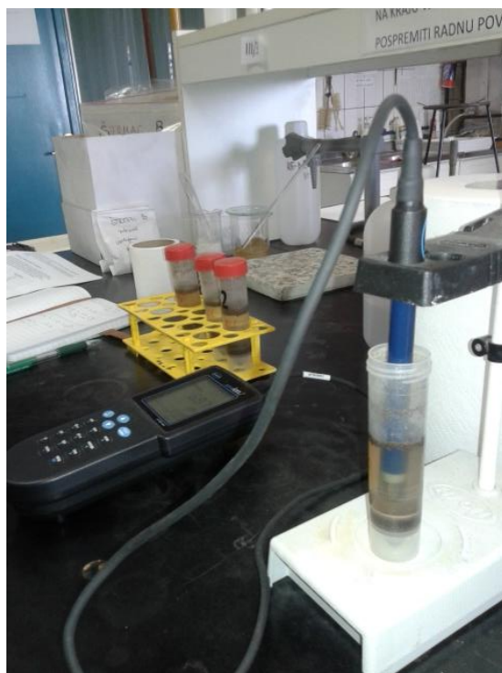
Slika 5. pH - metar za određivanje pH tla (Geološki odsjek PMF-a)

Prema rezultatu analize pH reakcije, tlo se svrstava u odgovarajuću klasu. Podjela može biti prema trenutnoj ili supstitucijskoj kiselosti tla, ali je češće prema supstitucijskoj kiselosti pošto je ona stabilnija (manje podložna sezonskim promjenama) i obuhvaća i tekuću i krutu fazu tla. Jedna takva podjela je prema Ph reakciji u 1 M KCl po Schefferu i Schachtschabelu (Blume i sur., 2016):