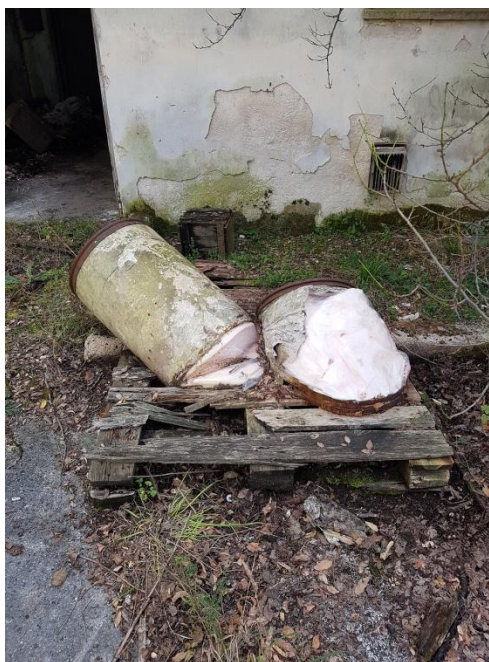
Slika 9. Napuštene bačve s ekološki opasnim sadržajem na području Krapana

Vrijednosti Pb, Zn i Cu puno su veće od dopuštenih razina (600, 3000 i 500 mg/kg), a to zahtijeva sanaciju tla (Verner i sur., 1996). Tri maksimalne vrijednosti potencijalno toksičnih elemenata (Cr, Cu i Zn) zaslužuju posebnu pozornost, budući da su one znatno veće od graničnih vrijednosti tla na industrijskim i komercijalnim područjima. Najveća koncentracija kroma je zabilježena na području Krapana u blizini tvornice metala (tablica 4). To se može objasniti mogućim propuštanjem bačava i oštećenih vrećica koje su napuštene na tom području. Oznake koje se na njima nalaze upućuju na njihov ekološki opasan sadržaj (NaOCl, CuSO 4 , Na 2 SO 4 OH, itd.). Bačve i vrećice su ostavljene bez nadzora i bez odgovarajućih sigurnosnih mjera sanacije, te su djelomično ili potpuno izložene atmosferskim uvjetima (sl. 9).