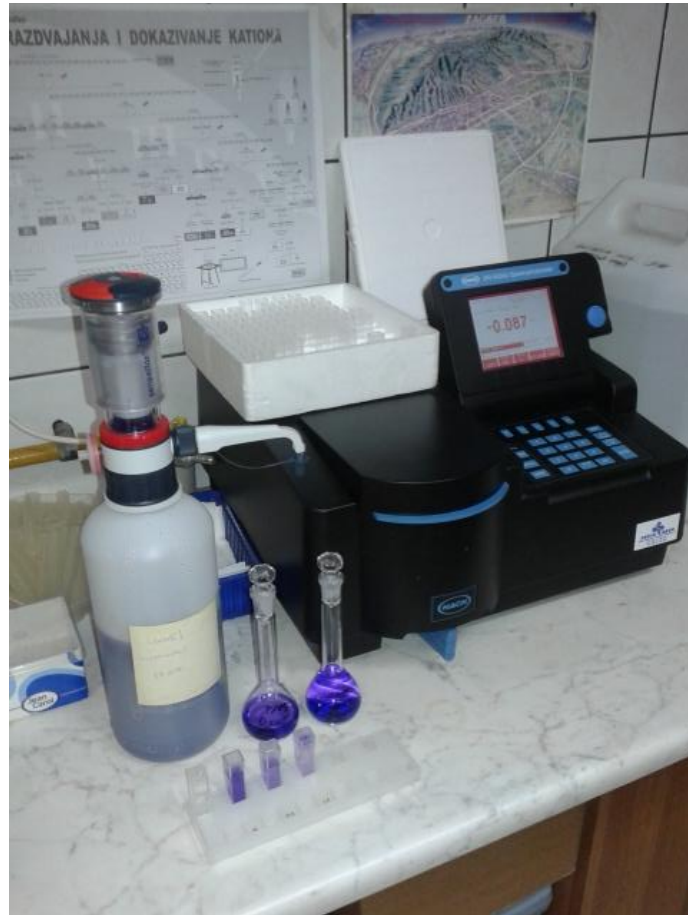
Slika 8. Spektrofotometar za određivanje kapaciteta kationske izmjene (Geološki odsjek PMF-a)