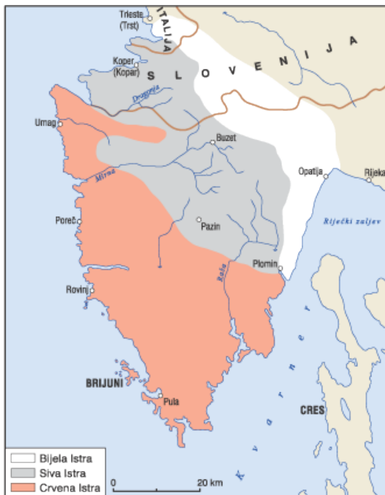
Slika 2. Geomorfološka karta Istre ( http://istra.lzmk.hr )

Površinske naslage Istre mogu se podijeliti u četiri megasekvencije koje odgovaraju različitim stratigrafskim rasponima međusobno odvojenim emerzijama: 1) bat-donji kimeridž; 2) gornji titon-gornji apt; 3) gornji alb-donji kampan; 4) eocen (sl. 3) (Velić i sur., 1995; Šikić i Polšak, 1973). Velik dio karbonatnih naslaga prekrivaju kvartarni sedimenti i oni čine petu sedimentacijsku cjelinu ovog područja.