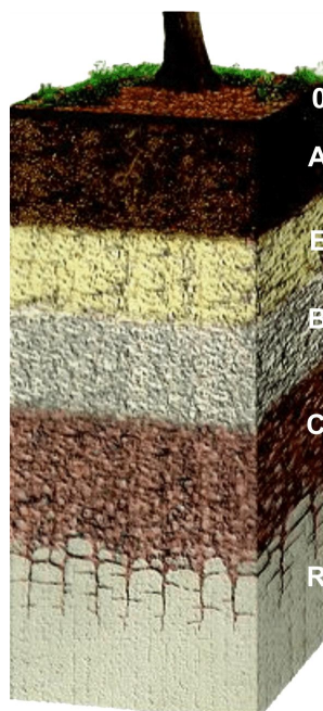
Slika 4. Pedološki profil; O – organski površinski horizont, A – horizont bogat mineralnom tvari, E – eluvijalni horizont, B – iluvijalni horizont, C – najdonji horizont tla, R – matična stijena

Urbano tlo definirano je prema Bockheimu kao tlo koje se sastoji od nepoljoprivrednih materijala čiji je površinski sloj deo više od 50 cm i koje je nastalo miješanjem, punjenjem ili kontaminacijom površine zemljišta u gradskim i prigradskim područjima. Sama urbana tla mogu se podijeliti na prirodna i antropogena. Prirodna tla nastaju taloženjem materijala prirodnim procesima (vjetar, voda, led) ili trošenjem matičnih stijena dok antropogena tla nastaju kao rezultat unosa materijala antropogenim djelovanjem. Taj materijal može biti prirodni, pepeo, kruti komunalni i/ili građevinski otpad (Scheyer et Hipple, 2005). Metali (npr. As, Zn, Pb, Ni, Hg, Cu, Cd i Cr) mogu ući u urbani okoliš na razne načine: iz domaćinstava, grijanjem u stambenim prostorima, raznim spalionicama, elektranama, industrijama, iz motornih vozila itd. Druga podjela urbanih tla je prema Klasifikaciji tla Hrvatske (KTH) te dijeli urbana tla na antropogena i tehnogena. Antropogena tla su izmijenjena uslijed obrade i gnojidbe i odnose se na poljoprivredna tla, a nisu vezana za gradove. Tehnogena tla odnose se na tla koja nastaju odlaganjem tehnogenih materijala. Razlikuju se tla deponija, flotacijski materijal i nanosi iz zraka (Škorić, 1986).