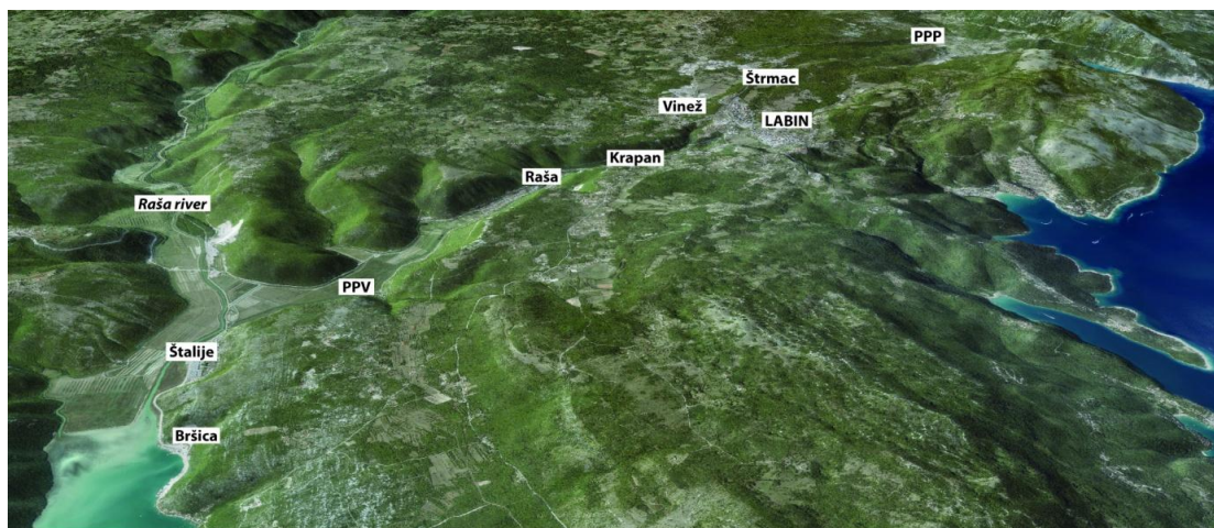
Slika 1. Geografski smještaj istraživanog područja

Područje Labinštine (sl. 1) nalazi se nekoliko desetaka kilometara sjeverno od najvećeg grada Istarskog poluotoka – Pule, na istočnoj strani obale koja vodi prema Kvarneru i Rijeci. Najveći grad tog područja je Labin, koji se tim imenom naziva tek od 1945. godine te sa svojom okolicom čini manji poluotok dugačak 23 i širok 13 kilometara. Istraživano područje na jugu graniči rijekom Rašom i zaljevom, na istoku Kvarnerom, na sjeveru Plominskim zaljevom dok ga na zapadu određuje isušeno Čepičko polje (Matošević, 2011).