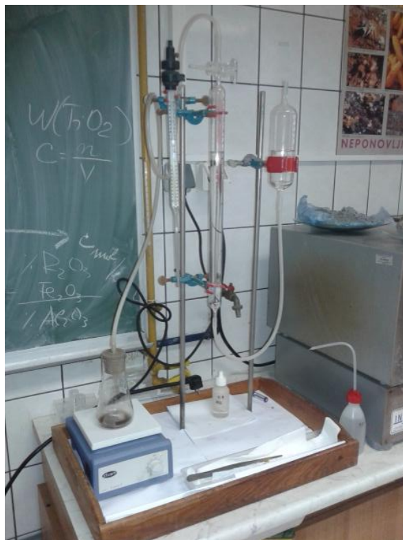
Slika 7. Scheiblerov kalcimetar za određivanje sadržaja karbonata u tlu (Geološki odsjek PMF-a)