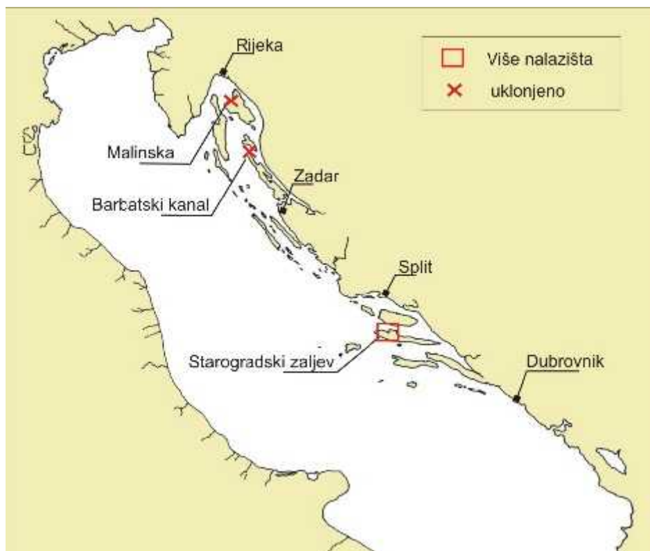
Slika 2. Rasprostranjenost alge C. taxifolia u Jadranu 2008. g.

Do danas Caulerpa taxifolia u Jadranskom moru pronađena je jedino u hrvatskom podmorju i to na tri lokacije: Starogradski zaljev kod otoka Hvara, kod Malinske na otoku Krku i u Barbatskom kanalu između otoka Raba i otoka Dolina (Sl. 2.).