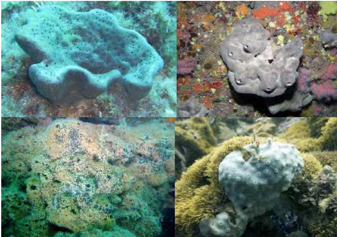
Slika 5. Zdrave (gore) i „bolesne“ S. officinalis (dolje).