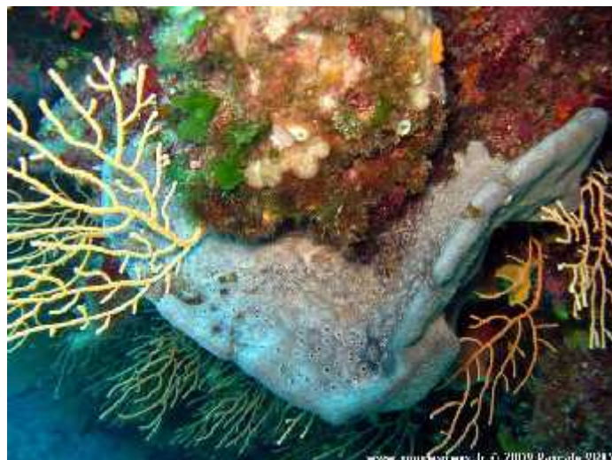
Slika 2. Suživot S. officinalis s drugim organizmima.