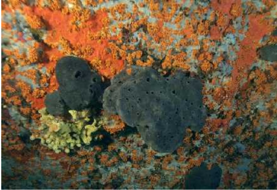
Slika 1. Spongia officinalis na koraligenskim stjenama.