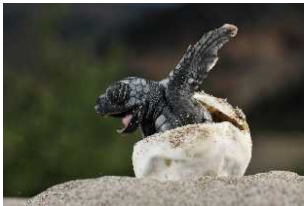
Slika 3. Izlaz kornjake iz jajeta

Razmnožavanje je gotovo identično kod svih vrsta morskih kornjaka. Ženke kada su spolno zrele migriraju iz staništa ishrane u stanište razmnožavanja, što posebno kod nekih vrsta znači i put i od nekoliko tisuća kilometara. U obalnom moru, blizu plaže pare se sa mužjacima te nedugo nakon toga izlaze na pješačane plaže kako bi se gnijezdile. Kopaju rupe u pijesku pomoću prednjih peraja i zatim u njih polažu i do 100 jaja veličine loptice za golf. Ponovno zakopavaju rupu pijeskom i vraćaju se u more ostavljajući svoje potomstvo zauvijek ( http://www.plavi-svijet.org/hr/kornjace/ ).