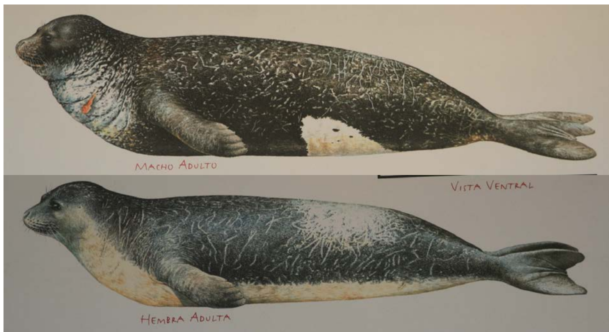
Slika 1. Razlika u boji tijela između mužjaka (gore) i ženke (dolje)

Veličinom su najbližnje tuljanima, prosječna duljina tijela im iznosi oko 2,4 metara, a prosječna težina iznosi između 250 do 300 kilograma. Ženke su samo neznatno manje nego mužjaci. Mužjaci su uglavnom crni sa bijelim mrljama na trbuhu, dok su ženke najčešće sive ili smeđe sa svjetlijim obojenjem po trbuhu (Sl. 1). U oba spola postoji mogućnost varijacija u boji. Sredozemna medvjedica ima najkraće krzno od svih perajara. Dok je dlaka kod mladunaca mekana, kod odraslih pripadnika ove vrste, ona je gusta, kratka i kruta. Medvjedica može zaroniti i do 50 metara dubine i pod morem se zadržava 5-7 minuta. Dok se morem kreće vrlo vješto i brzo, kopnom se kreću nespretno, zato što stražnje peraje ne može okrenuti prema naprijed, nego su uvijek ispružene straga. Na prednjim perajama ima dobro razvijene pandže duge oko 2,5 cm, dok su na stražnjima, one znatno manje. Prosječan životni vijek im iznosi između 20 do 30 godina.