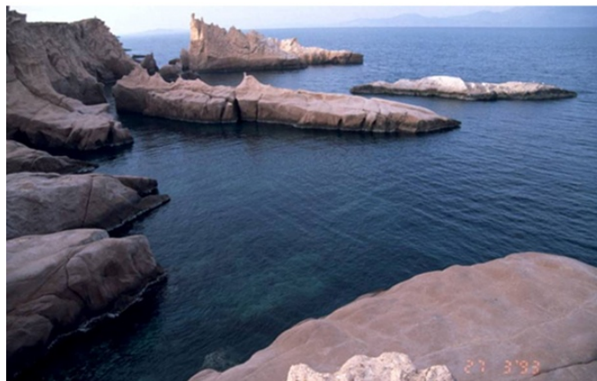
Slika 3. Primjer prirodnog staništa sredozemne medvjedice

Prirodna staništa medvjedica su duge obale gdje nema urbanog razvoja, ili udaljena mjesta na koja čovjek nema pristup, poput udaljenih stijena (Sl. 3). Glavni kriterij po kojem medvjedice biraju stanište su špilje sa podzemnim ulazom, zbog podizanja mladunaca i potencijalna hranilišta koja su dovoljno blizu.