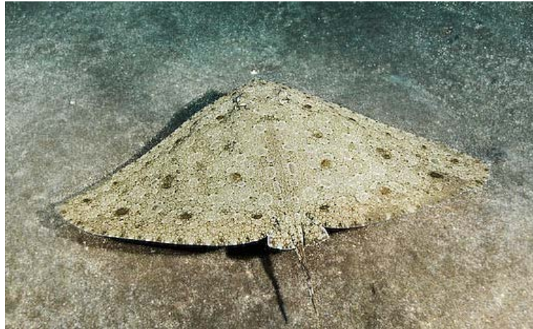
Slika 7. LEPTIRICA ( Gymnura altavela )

Osim golubovki i žutuga još jedna razlika riba ima otrovnu bodlju na repu. To je leptirica (Slika 7.) ili pazdrk koja može narasti do 2,9 m međutim promjer krila joj je veći od 4 m. Ukupna težina do 60 kg. Pripada porodici Gymnuridae koje se od drugih skupina razlikuju po veličini krila koja su im i dva puta duža nego dužina tijela od vrha repa do glave. Živi do 100 m dubine na mekanim dnima u koje se zakopava. Bentoska je i sedentarna vrsta. Obitava u istočnom Atlantiku i cijelom Mediteranu, te u Jadranu, iako je dosta rijetka. Žućkasto-sive i mramorne je boje, a sa donje strane bijelo crvene. Po obliku glave i nedostatku leđne peraje je bliže opisu žutuljama. Rep je kratak, a uz sam početak smještena je kratka nazubljena bodlja. Otroavno žljezdano tkivo nalazi se u uzdužnom žlijebu bodlje. Kratki rep ne može obuhvatiti žrtvu. Smještaj uz samo tijelo onemogućuje zamahivanje bodljom (Wöfl, 1994).