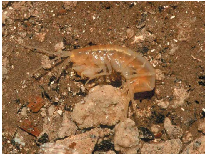
Slika 3. Endemična vrsta Niphargus miljeticus Straškraba, 1959, špilja Ostaševica, otok Mljet (foto. R.Ozimec)

Tipaska Niphargus s. steueri Schellenberg, 1935 na području Istarskog poluotoka, N. s. subtypicus Sket, 1960 u jugoistočnoj Sloveniji i sjeverozapadnoj Hrvatskoj, N. s. liburnicus Karaman, G. & Sket, 1989 na području otoka Krka i na području Gorizia u Italiji. Podvrsta N. s. kolombatovici se rasprostire najjugoistočnije te ima najveći areal rasprostranjenosti od svih podvrsta vrste N. steueri (Fišer i sur., 2006).