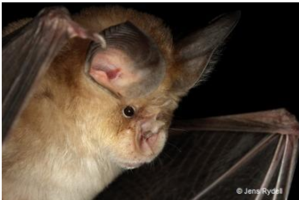
Slika 4.5.1 - Rhinolophus euryale ( www.eurobats.org )

Lovno stanište su mu livade s grmljem, a lovi noćne leptire i ostale kukce. Ljeti često tvori zajedničke kolonije s velikim potkovnjakom ( Rhinolophus ferrumequinum ), riđim šišmišem ( Myotis emarginatus ) i dugokrilim pršnjakom ( Miniopterus schreibersii ). Zimske kolonije su samostalne, ili s velikim potkovnjakom, no u Hrvatskoj do sada nije pronađena veća zimujuća kolonija. U primorju je često aktivan i zimi. Živi prosječno 13 godina. Također je globalno ugrožena vrsta, a razlozi ugroženosti su uznemiravanje prstenovanjem, speleološki posjeti i uporaba pesticida.