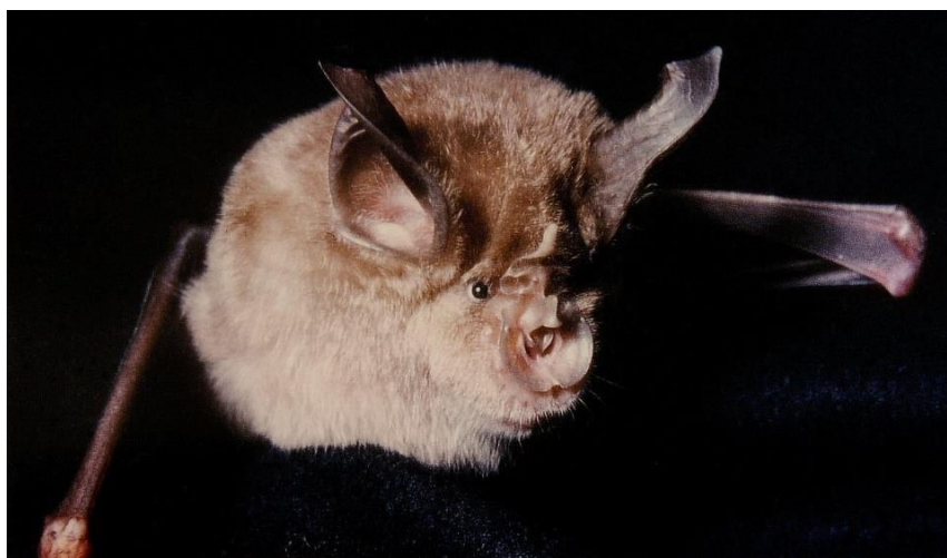
Slika 4.6.1 - Rhinolophus ferrumequinum

U skladu s akcijskim planom za zaštitu velikog potkovnjaka u Europi (Ransome & Hutson 2000) koji je prihvaćen od članica Europske zajednice, a postao je za Hrvatsku obveza zbog potpisivanja sporazuma EUROBATS, potrebno je nastaviti kartiranje ljetnih i zimskih kolonija i utvrđivanje njihove brojnosti, te započeti utvrđivanje područja staništa pogodnih za ishranu i procjenu njihova stanja. Istovremeno treba zaštititi veće ljetne kolonije i područja njihove aktivnosti, te zaštititi značajnije zimske kolonije. S obzirom na broj poznatih kolonija, veliki potkovnjak bi mogao biti prva vrsta šišmiša u Hrvatskoj na kojoj će se započeti pratiti stanje brojnosti kolonija u špiljama, s tim da će rezultati biti značajni za procjenu trenda promjena stanja hrvatske populacije. (Mrakovčić i sur., 2008)