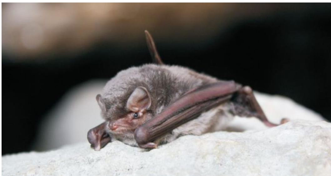
Slika 4.1.1 - Vrsta Miniopterus schreibersii

Dugokrili pršnjak (Slika 4.1.1) šišmiš je srednje veličine čija boja tijela varira od sivo-smeđe do pepeljasto smeđe, te svjetlije sive s trbušne strane. Na relativno maloj glavi smještene su kratke i trokutaste uši te izrazito kratka njuška. ( www.dzpz.hr ). On je primarno špiljska vrsta, no pronađen je i u rudnicima te napuštenim podrumima. Vrsta je izrazita selica te može preći i preko 1.300 km. Porodiljske kolonije isključivo su vezane uz špilje ili napuštene rudnike. Ženka kraljem proljeća rađa najčešće jedno mlado. Odlaze u lov tik nakon zalaska sunca. Love na otvorenom području na visini od 10 do 20 m. Plijen su im noćni leptiri, komarci, mušice i paukovi. Hibernacija započinje u listopadu i traje do ožujka. Provode je u špiljama zajedno s drugim vrstama šišmiša. Uz sivog dugoušana ( Plecotus austriacus ) i dugonogog šišmiša ( Myotis capaccinii ) on je najugroženija vrsta u Hrvatskoj. Vrsta je izrazito osjetljiva na uznemiravanje te je ugrožena ljudskim aktivnostima što vodi do gubitka skloništa u špiljama. Ostali razlozi ugroženosti su upotreba pesticida čime im se ograničava izvor hrane te nestanak porodiljskih kolonija i smanjenje broja jedinki u porodiljskim kolonijama koje su opstale.