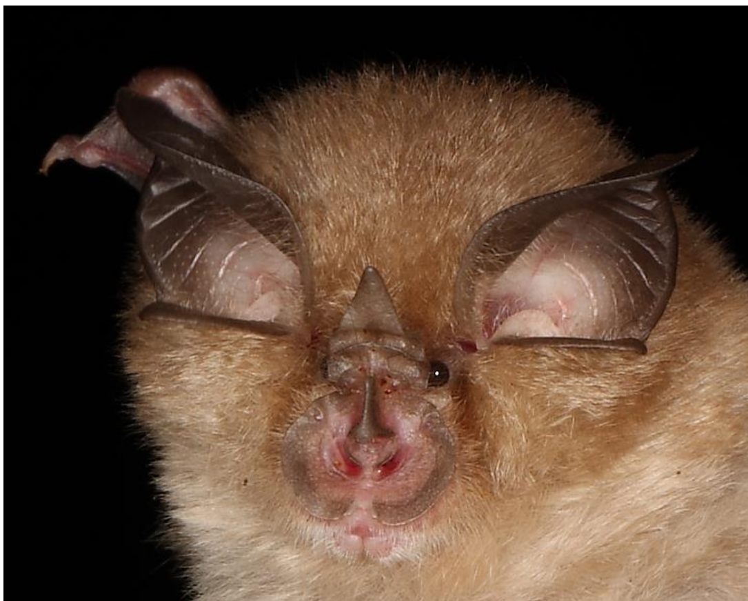
Slika 4.7.1 - Rhinolophus hipposideros ( www.milbourne.net )

On je najmanja europska vrsta šišmiša. Gornja strana tijela im je sivo-smeđa dok je donja strana sivo-bijela. Parenje započinje u jesen i završava na proljeće uz pauzu zimi. Ženske se često pare odmah nakon zimskog sna u prostoru gdje su prezimile. U proljeće kote mladunce koje već u prvom tjednu vode sobom u lov. Love noću u zajednicama između stabala na visini tik od tla pa do pet metara. Hrani se komarcima, manjim noćnim leptirima, tvrdokrilcima i manjim paukovima. Zimovališta su im u špiljama, rudnicima i podrumima. Ljetne kolonije su u potkrovljima zgrada i crkvenim tornjevima. Razlozi potencijalne ugroženosti su osjetljivost na uznemiravanje kolonija u skloništima, obnova zgrada na način da mali potkovnjak gubi svoja tradicionalna skloništa, promjene u krajoliku koji koristi za sklonište te lov. Potencijalno je ugrožen i impregnacijom drvene građe za krovništa otrovnim spojevima. Mali potkovnjak je također među prioritarnim vrstama EUROBATs-a. (Crvena knjiga sisavaca, 2006)