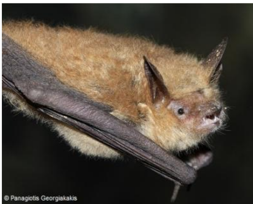
Slika 4.3.1 - Myotis emarginatus

On je globalno ugrožena vrsta. Pretpostavlja se da je ugroženosti doprinijela pojačana upotreba pesticida, te uništavanje i uznemiravanje kolonija. U panonskom dijelu areala ugrožen je i zbog impregnacije drvene građe za krovove tvarima otrovnim za toplokrvne životinje (Mrakovčić i sur, 2008).