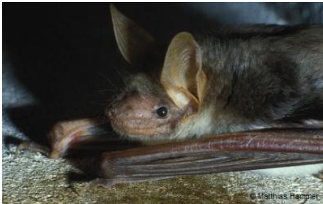
Slika 4.2.1 - Myotis blythii ( www.eurobats.org )

Živi u podzemnim skloništima i napuštenim kućama. U ljetnim skloništima često dolazi zajedno s dugokrilim pršnjakom ( Miniopterus schreibersii ), velikim šišmišom ( Myotis myotis ) i vrstama roda Rhinolophus ( Rhinolophus sp. ). Porodijske kolonije mogu imati preko 5 000 jedinki. Počinju se pariti u kolovozu. Uglavnom su stacionarna vrsta čija su ljetna i zimska prebivališta udaljena oko 15 km. Lovni u krugu 25 km od prebivališta a hrani se insektima. U nas je prilično česta vrsta, pa je njezin status očuvanosti prema IUCN-u 'najmanje zabrinjavajući'. Iako nije uvrštena na popis ugroženih vrsta šišmiša u Republici Hrvatskoj, mogući razlozi njene ugroženosti u budućnosti mogu biti trovanje drva u potkrovljima zgrada insekticidima, uznemirivanje porodijskih kolonija i kolonija na zimovanju. (Antonić i sur., 2015)