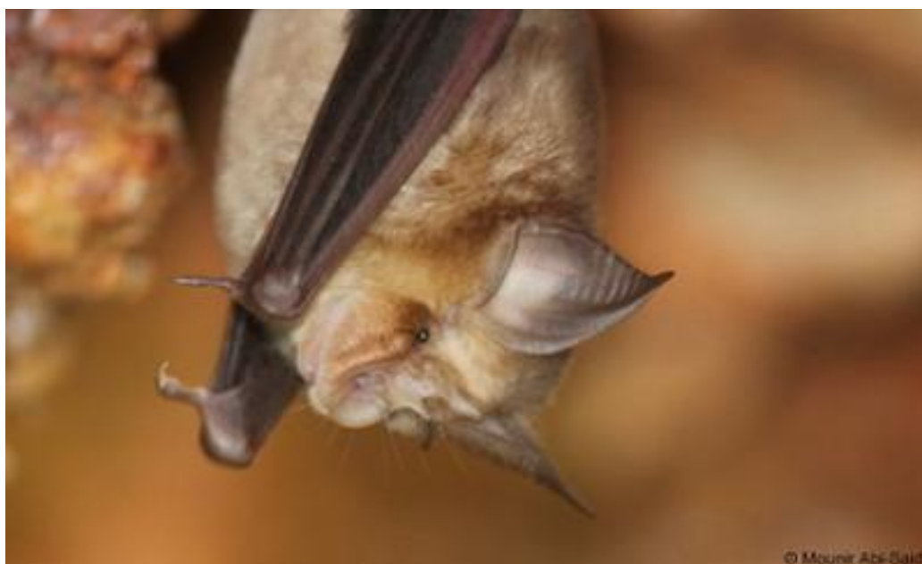
Slika 4.4.1 - Rhinolophus blasii

Krzno mu je mekano, na leđima sivo-smeđe a na trbuhu gotovo bijele boje. Pare se jednom godišnje - u jesen prije hibernacije. Zimuje uglavnom od listopada do ožujka. U proljeće ženka koti jedno mlado. Ovisno o temperaturi okoliša, mlado nosi od 7 do 10 tjedana. Hrani se paucima, noćnim leptirima, mušicama, moljcima i ostalim sitnim kukcima (D. Marguš). Lovi na visini od jednog do pet metara leteći između vegetacije. Ugrožen je promjenom i gubitkom staništa, uznemiravanjem porodiljskih kolonija te upotrebom pesticida.